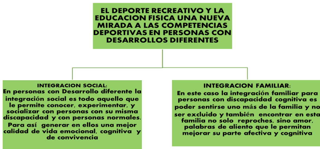
Figura 1. Conceptos de integración. (Vigotsky, Piaget, Humberto Maturana y Paulo Freire)