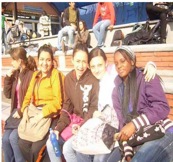
Figura 7 En las gradas con las compañeras primer semestre en la UPN (2009)

Hoy reconozco que mi proceso formativo llevado a cabo en cada uno de los espacios académicos que ofrece el Programa de Educación Infantil, aunque han sido favorables en lo que respecta a mi desempeño, también he podido apreciar que han representado inconvenientes respecto a mi poca participación ante situaciones que requieren una mayor expresión y comunicación de mis ideas, pensamientos, saberes y conocimientos en dichos espacios; esto es debido a que como lo anoté anteriormente, toda mi formación previa al ingresar a la Universidad fue “marcada” por unas consignas culturales creadas por esta sociedad como: el imaginario del “negro bruto”, donde la gran mayoría de las poblaciones afrodescendientes han sido relegadas por las condiciones sociales, económicas, culturales y han tenido que enfrentarse a un tipo de educación excluyente y diferente a la de las demás poblaciones.