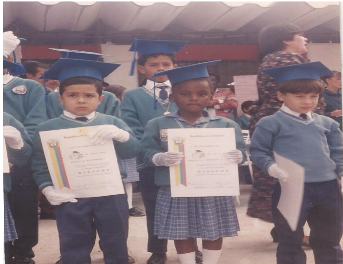
Figura 5 Grados de Preescolar. Escuela Brasilia

esto se debía a los imaginarios que socialmente han sido creados, donde a la persona negra la relacionan con lo feo, la ignorancia y la inferioridad.