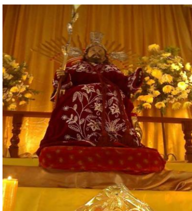
Figura 1 Jesús Nazareno de Magüi Payan.

Teniendo en cuenta todo el recorrido genealógico, histórico y ancestral. A continuación mi historia de vida resaltaré los procesos formativos desde la infancia hasta mi formación como maestra, para ver como dicho proceso ha incidido en mis prácticas pedagógicas y en mi actual práctica como maestra en ejercicio.