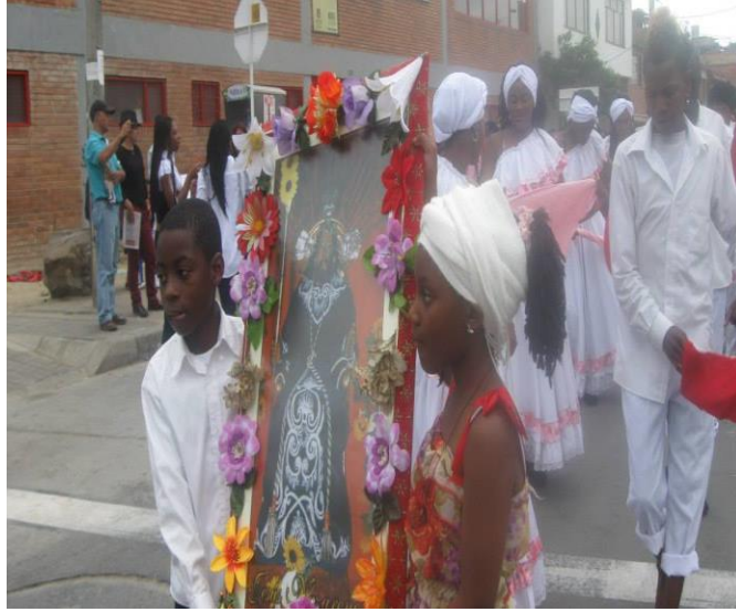
Figura 3 Celebración fiestas patronales de Jesús de Nazareno en Bogotá- Bosa.