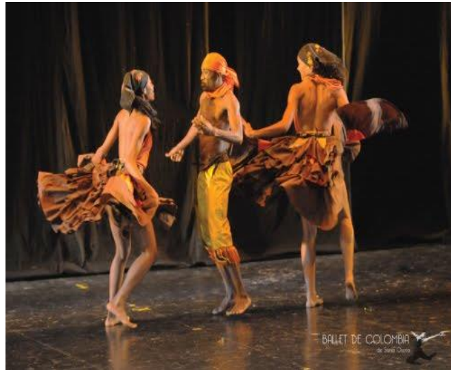
Figura 6 Presentación de danzas en la Media torta de Bogotá

incomodaba la presencia de una persona afro en mi salón. Cuando estaba en noveno grado ingresé a un grupo de danzas afro y empecé todo un proceso de reconocimiento de algunas de las características de la comunidad afrodescendiente, y de esta manera comencé a integrarme y a hacer parte de los procesos de reivindicación cultural a través de la danza y la música.