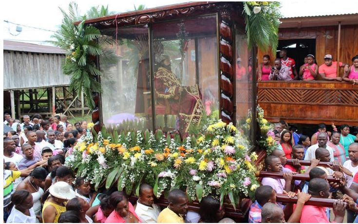
Figura 2 Fiestas patronales de Magüi Payan 6 de Enero de 2012.

demostraciones artísticas y culturales a través de la danza, música, cantos y muestra gastronómicas propias del municipio.