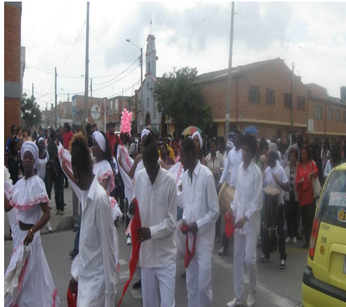
Figura 4 Procesión de los Magüireños residentes en Bogotá.

De allí que el momento de iniciación de mi educación básica en una institución pública en la Ciudad de Bogotá, representó para mí un gran choque ,debido a que empezaba a interactuar con otros niños y niñas mestizos; esto significó una experiencia muy dura, porque debido a mi color de piel, los niños y las niñas no querían compartir ni jugar conmigo, ahora comprendo que