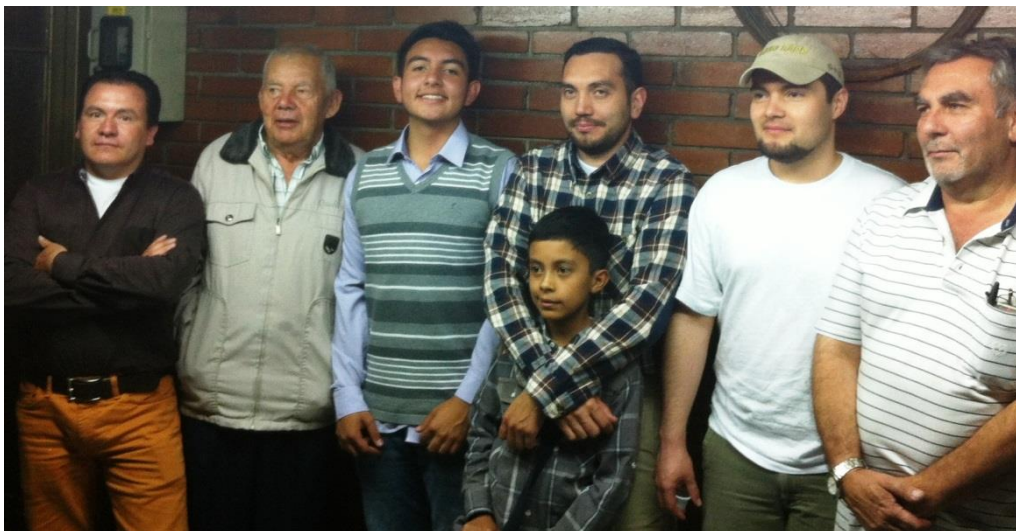
Figura 10 Hombres integrantes de la familia Gómez (2014)