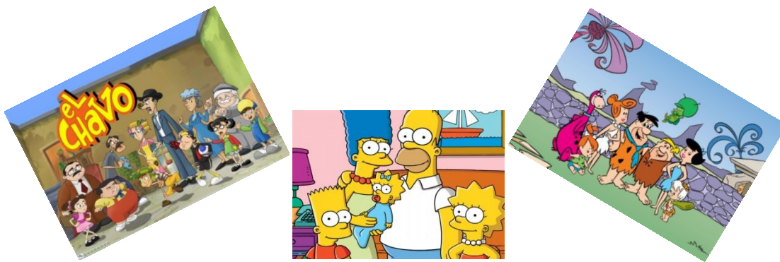
Figura 14. Imágenes de dibujos animados mostrados a los niños para la actividad propuesta