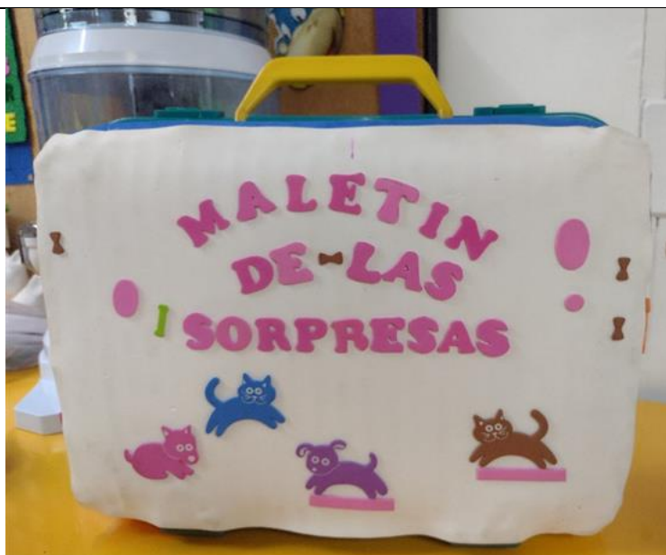
Ilustración 6 Tomada por Zuly Soriano, noviembre, 2023. Esta imagen evidencia el maletín de las sorpresas de transición 1, el cual contenía un amigo de peluche y la pregunta a resolver con las familias, quienes luego lo llevaban al colegio con diferentes materiales y