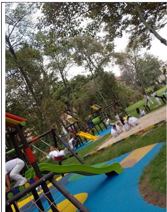
Ilustración 1 abril 2024

“Al niño cada nuevo descubrimiento le causa una alegría y un sentimiento de dignidad que le anima a buscar indefinidamente nuevas sensaciones en el ambiente”. (Montessori, 1918, p. 4) es por ello, que se deben disponer espacios que propicien la exploración y la interacción, de tal manera que los niños y las niñas puedan tener esa autonomía para desplazarse, moverse y empezar a reconocer el mundo, no solo físico sino también social y cultural; según Sanchidrián (2013) “la clave es organizar el espacio de forma que los niños sean los protagonistas de su aprendizaje y que sepan usar el material sin depender constantemente de sus educadores” (p. 27) es así como los amplios escenarios con los que cuenta el Instituto Pedagógico Nacional favorecen esta exploración, ya que tiene diferentes zonas verdes y aulas que enriquecen la interacción con la naturaleza y los objetos, teniendo “la posibilidad del material concreto, de poderse desplazar a sus diferentes salones, de observar, de tocar, de manipular, de tener su