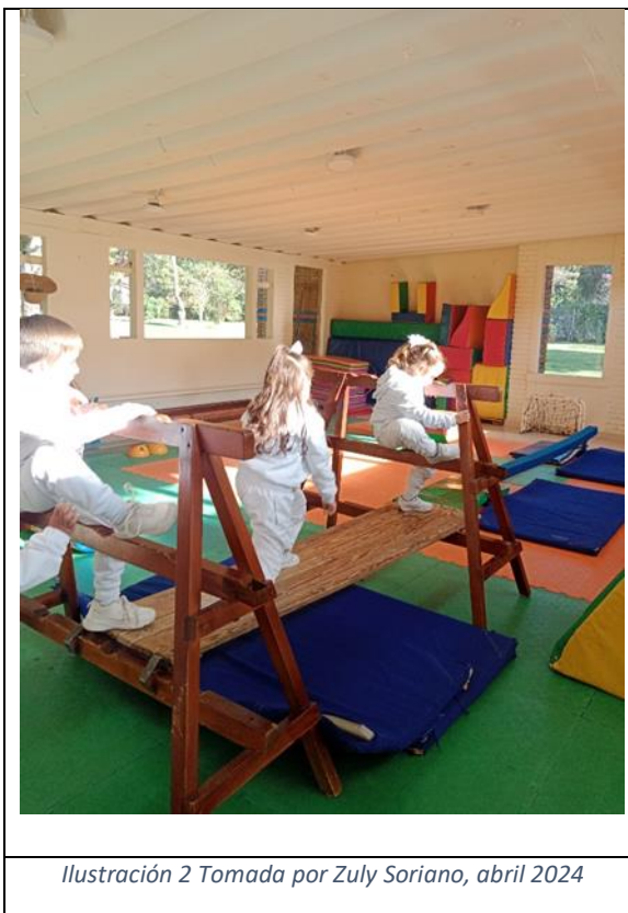
Ilustración 2 Tomada por Zuly Soriano, abril 2024