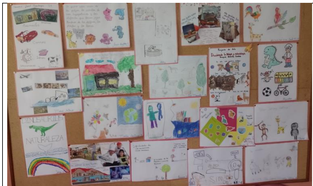
Ilustración 4 abril 2023. Esta imagen evidencia dibujos realizados por los niños y las niñas de jardín 4 con los que demostraron aquello que les interesaba indagar.

Una vez se haya definido el tema del proyecto de aula se iniciará la fase dos que corresponde a la estructuración y planificación del proyecto “con esas ideas, con esos intereses, esas inquietudes, ya se hace todo un mapa conceptual donde se organiza cuál va a ser el rumbo del proyecto, porque si partimos de pronto de una pregunta, una pregunta nos puede dar para muchas cosas, entonces, también hay que darle un orden” (M.S.P., P.8). Esta etapa se refiere a lo que se quiere saber, a lo que se quiere hacer y lo más importante, con quiénes se va a elaborar, pues cada maestra conoce a su grupo y aunque una temática es general para jardín y otra para transición, existe libertad para ejecutar actividades y poner en marcha el proyecto.