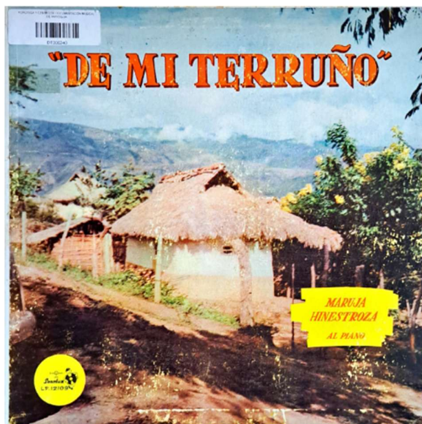
Ilustración 8 Portada del álbum “De mi terruño”