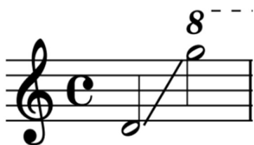
Ilustración 11. Registro Tiple

Registro de la guitarra y el tiple manejados en los arreglos.