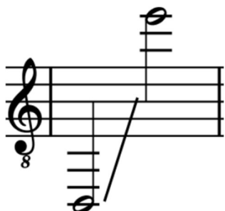
Ilustración 12. Registro de Guitarra, con Sexta con (scordatura en D)