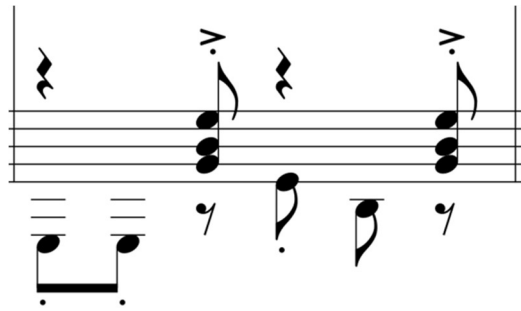
Ilustración 13 Ritmo de pasillo ecuatoriano presente en compases: 50, 66,67 y del 74 al 78.