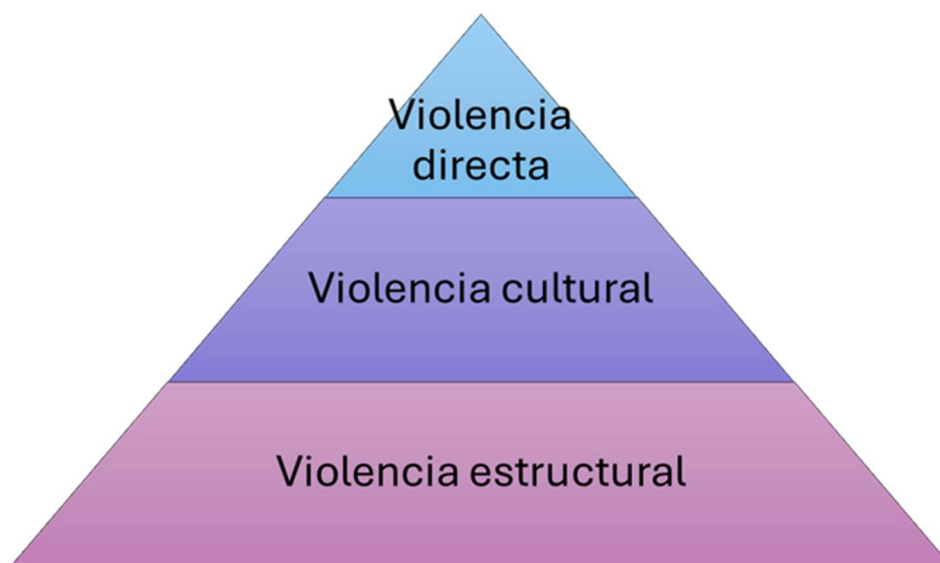
Ilustración 1 Pirámide de la Violencia.

Estos dos tipos de violencia encuentran su sustento en una tercera, aquella que está presente en aspectos y elementos constitutivos de la cultura desde estamentos como la religión, la ideología, el lenguaje, el arte y la ciencia, denominada por Galtung (2003) como Violencia cultural la cual encuentra su sentido en la esfera simbólica de la existencia y está tan arraigada al componente cultural que resulta difícil una superación de esta.