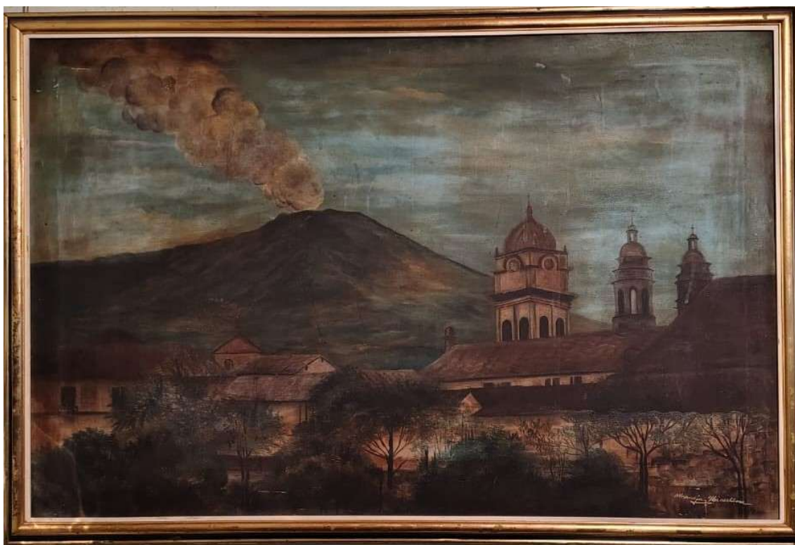
Ilustración 7 Pintura realizada por Maruja. Valle de Atriz (San Juan de Pasto)

Dentro del acervo de Maruja debe destacarse la alusión al paisaje andino, partiendo desde el hecho de nombrar algunas obras como: “Yahuarcocha” (que refiere a la laguna ubicada en Ibarra, Ecuador) y que si bien no hace parte de la geografía colombiana, se ha constituido como un atractivo turístico para la cultura nariñense y puede que para la familia de la compositora esto no haya sido la excepción.