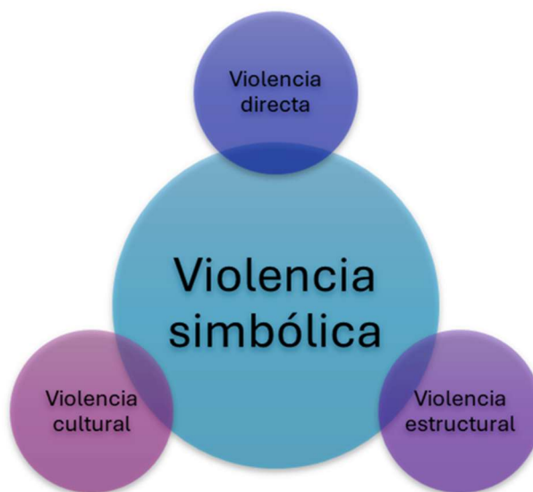
Ilustración 2 Diagrama relacional de las violencias.

La violencia simbólica es esa coerción que se instituye por mediación de una adhesión que el dominado no puede evitar otorgar a la dominante (y, por lo tanto, a la dominación) cuándo sólo dispone para pensarlo y pensarse o, mejor aún, para pensar su relación con él, de instrumentos de conocimiento que comparte con él y que, al no ser más que la forma incorporada de la estructura de la relación de dominación, hacen que ésta se presente como natural. (Bourdieu, 1999. 224-225).