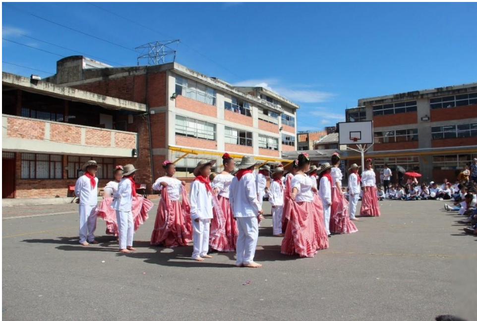
Fotografía 7 Estudiantes grado 501 en formación para empezar la coreografía de la danza cumbia