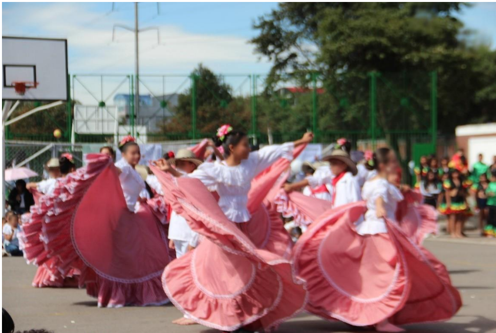
Fotografía 8 Estudiantes niñas moviendo energéticamente faldas llamadas en la cumbia pollera colorada.