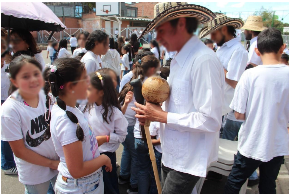
Fotografía 9 Grupo musical invitado hace acercamiento pedagógico hacia la comunidad estudiantil invitada a la presentación del carnavalito interesados con los instrumentos musicales.