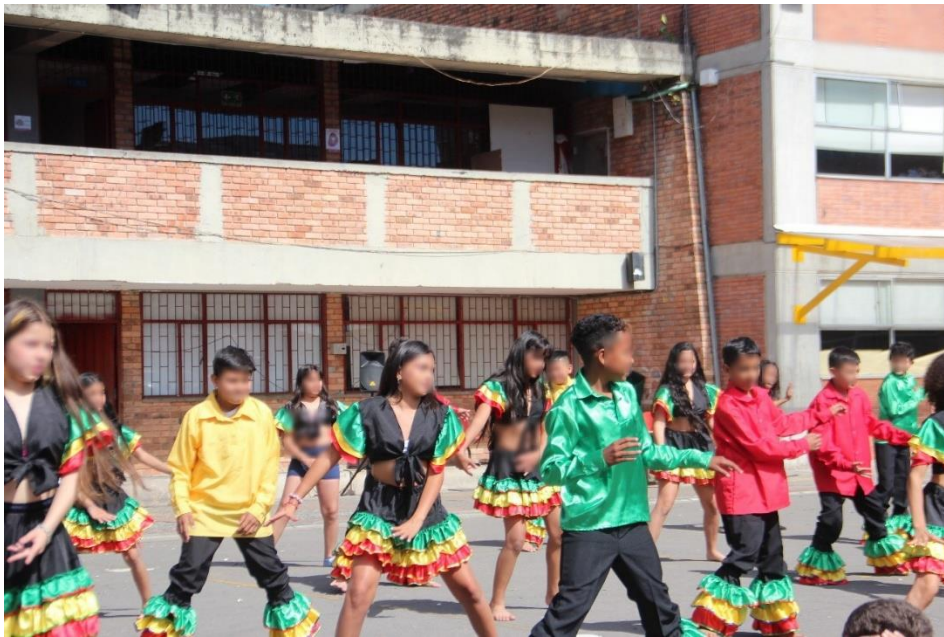
Fotografía 5 parte inferior Fotografía 6 parte superior estudiantes de 502 danzando e interpretando el ritmo Mapalé