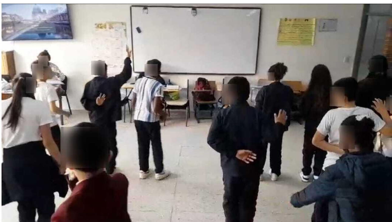
Fotografía 4 momento en el cual se hace interpretación coreográfica de la cumbia propuesta desde un inicio a las y los estudiantes de 502.

Cuarta sesión: Notablemente crece con cada sesión el interés de que las clases sean más veces por semana, en algunas ocasiones los estudiantes mostraban cansancio o aburrimiento por los tiempos de ensayo, así que desde la lúdica, se creaban estrategias de juegos para mantener el cuerpo y la mente interesados en el espacio de aprendizaje, relacionaron conceptos de danza y cultura lo que hizo que fuera un encuentro basado en el disfrute y la mímica, generando ambientes positivos y no hostiles para la memoria de un recuerdo fructífero y placentero; no hay alguna alteración en cuestiones de relacionamiento social entre ellos. (ver anexo 6)