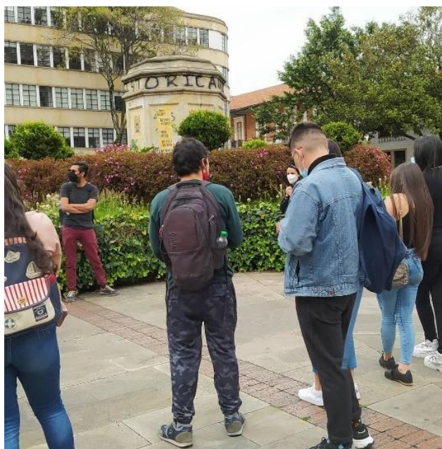
Figura 5 Plaza Misak

Nota. Recorrido por el centro de Bogotá. [Fotografía], por Antorcha Educativa, 2022, Instagram https://www.instagram.com/stories/highlights/17966364541538729/