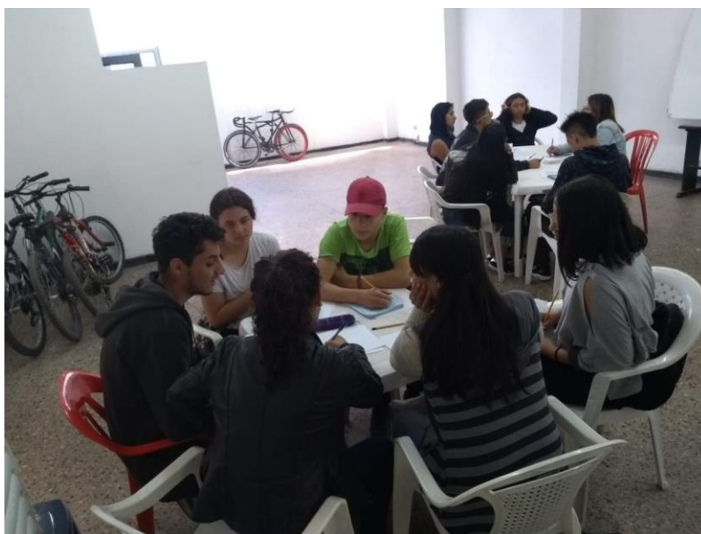
Figura 10 Clase de Análisis Textual

Nota: Clase de Análisis Textual durante el ciclo de formación del 2019.