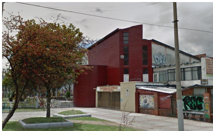
Foto 1 Imagen salón cultural Luis A. Morales; capturada desde google maps. 2018