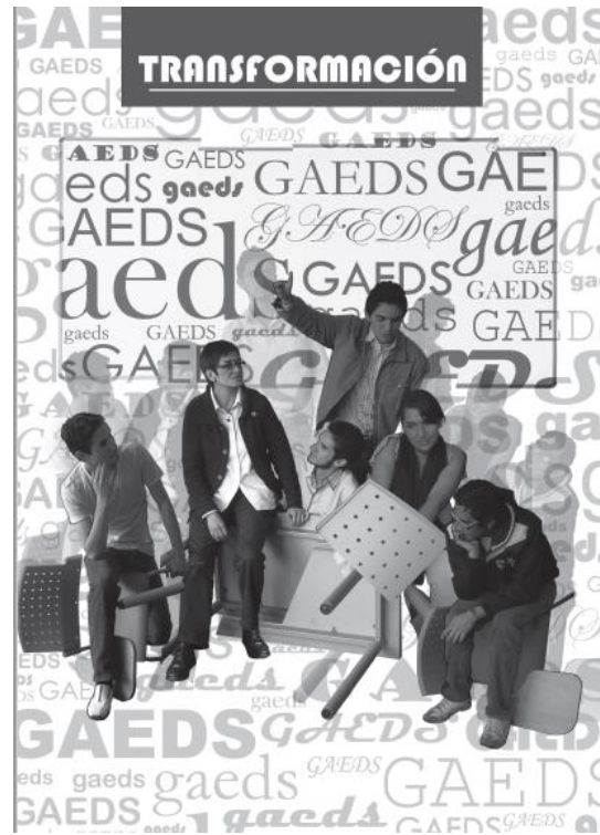
Imagen 4. Portada Revista Transformación 1

Nota: Primer número de la revista Transformación – GAEDS-UN, 2010