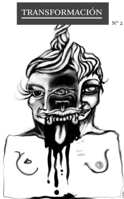
Imagen 5. Portada Revista Transformación 2

Nota: Segundo número de la revista Transformación – GAEDS-UN, 2011