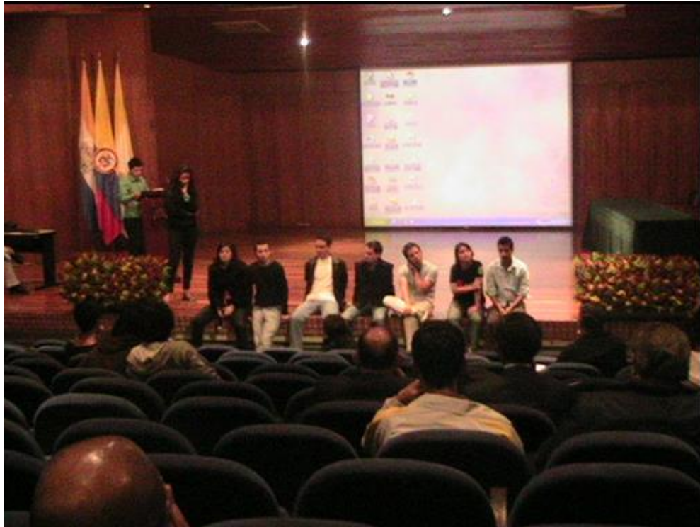
Imagen 1. Evento de Lanzamiento de Reddes – Universidad Javeriana

Nota: Lanzamiento de Reddes en la Universidad Javeriana – 2008