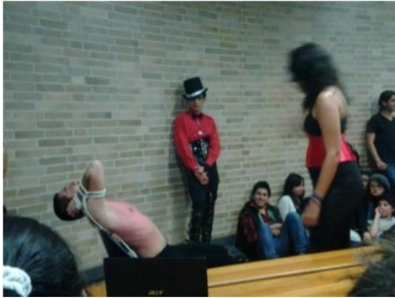
Imagen 3. Encuentro Lúdico-Académico - 2011

Nota: Actividades en el marco de los ELAS: ErotEla: Prácticas sexuales. GAEDS-UN, 2011