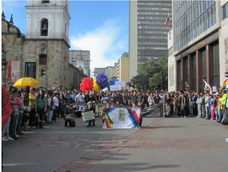
Nota: Participación de GAEDS-UN en la Marcha del Orgullo LGBT en Bogotá – 2015