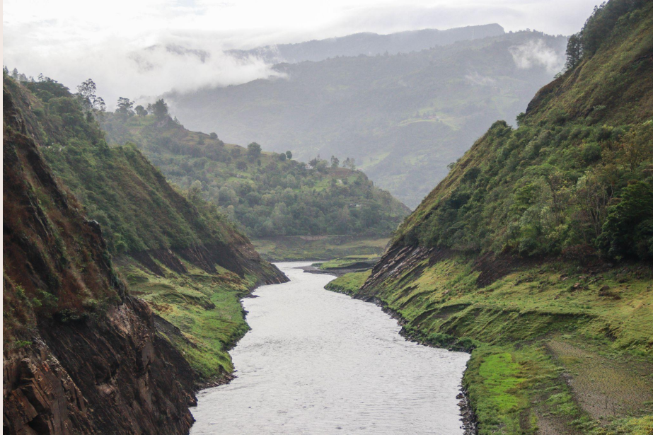
Imagen 7. Las Juntas, Represa Chivor (2022).

Para mayo de 2022, junto con mis mujeres, decidimos visitar la tierra nativa, este era un encuentro significativo para todas. Algunas de nosotras llevábamos sin visitar Santa María desde el tiempo en el que la abuela hizo su transición de este plano. De manera particular mis recuerdos sobre este territorio se situaban en imágenes de la abuela, algunas en mi mente y otras en el archivo, éstas me hacían volver para presenciar el lugar en el que empieza a acontecer nuestra historia. Debo mencionar que el tiempo en el que hemos decidido tomar distancia de este lugar ha sido necesario; sin embargo, la no presencia del cuerpo en este espacio no significa una relación de abandono u olvido, este tiempo nos enseñó cómo habitar el lugar desde la memoria, a reencontrarlo desde el archivo y revivirlo de manera subjetiva entre rituales, que nos llevaron a retornar para sentirlo desde la fuerza de la presencia.