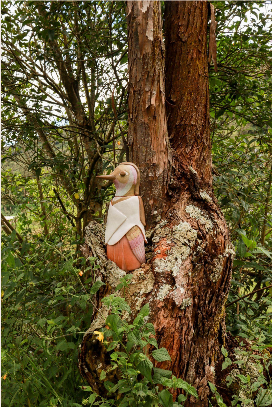
Imagen 26. Mujer ave, mujer colibrí. Choachí (2022). Autoría propia.