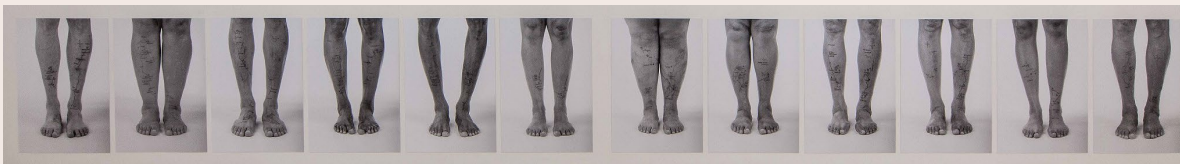
Imagen 16. Signos Cardinales (2008). Libia Posada. Fuente: https://www.banrepcultural.org/coleccion-de-arte/obra/signos-cardinales-ap4843

desplazamiento, pies desnudos y plantados de frente, desnudos y demarcados por el mapa del tiempo, heridas y cicatrices, el trazo de un mapa que también se ubica en la corporalidad, en su memoria, cuerpos que se manifiestan como territorios mismos.