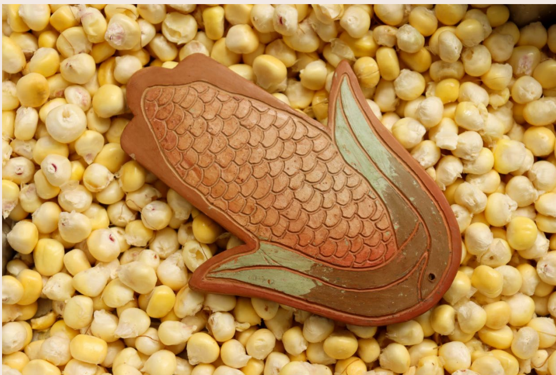
Imagen 35. Aba-Maíz. San Cristóbal Sur (2023). Autoría propia. 24

El Maíz “aba” en Muyscubun, en nuestro territorio colombiano y latinoamericano, además de ser la representación de nuestra cultura, es la base de la soberanía alimentaria. Según las cifras de Fenalce, en Colombia respectivamente, el cultivo de maíz depende en gran manera de los sistemas de cultivo tradicionales que devienen de la labranza de las manos campesinas, que sustentan la alimentación de las familias, aportando en mayor volumen a la producción de maíz en el territorio nacional.