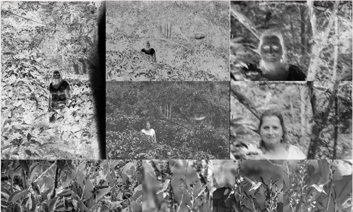
Imagen 4. Reencarnar. Archivo análogo y digital (2019). Autoría propia.

Las imágenes alojadas en el sueño, me llevaron a fotografiar por primera vez un colibrí junto a mi madre, a ella la fotografié de manera análoga, revelando el rollo, positivando los contactos, y ampliando la imagen, al colibrí le hice una serie de fotografías digitales, las cuales convertí en negativos para imprimirlas en acetatos, todas las fotografías se podían superponer sobre las otras para verlas retratadas juntas, las técnicas por las que pasaba la imagen me permitían suspenderlas en el tiempo de manera indefinida. En el proceso de realización de “Reencarnar”, que ahora es referenciado en este documento como archivo, debo mencionar que no dejaba de pensar en el “ instante decisivo ” acuñado por Cartier Bresson y su concepción de la fotografía como “el impulso espontáneo de una atención visual perpetua, que atrapa el instante y su eternidad.” (Cartier-Bresson, 2003, p. 35).