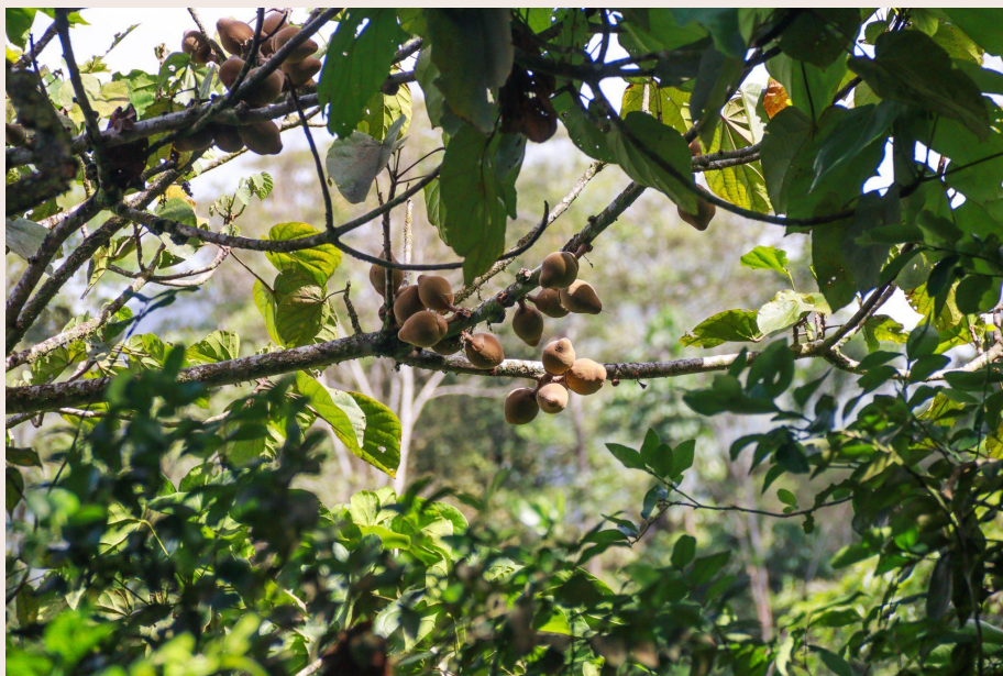
Imagen 2. Árbol de zapote en Calichana, Santa María, Boyacá (2022).

Entre la añoranza de la memoria y la vida de la mujer campesina, guiada por la voz de mis mujeres llegamos hasta las imágenes contenidas en el álbum familiar, un archivo de elementos visuales que detonaba aún más sus recuerdos. Visitábamos los lugares desde la memoria; sin embargo, entre la reminiscencia y el valor del olvido, evidenciamos que después de cierta época el álbum se detuvo, no se continuaron revelando las fotos análogas de la familia y la abuela no siguió apareciendo. Nuestra experiencia empezó a sentirse volcada y decidimos ir hasta la tierra nativa en la búsqueda de algo tangible, las narraciones visuales de las imágenes, acompañadas por los relatos de mis mujeres, me llevaron hasta los municipios de Santa María y Mambita en el departamento de Boyacá a buscar la continuidad de estas historias y atestiguar los lugares que evocaban nuestros recuerdos. La presencia del cuerpo en el espacio se enredaba conmigo en el telar del tiempo, todas resultamos metidas en algunas de las imágenes del archivo, reviviendo lo acontecido e interconectando el pasado con el presente... Dejando en el caminar la creación de nuevas imágenes y con ellas otras historias.