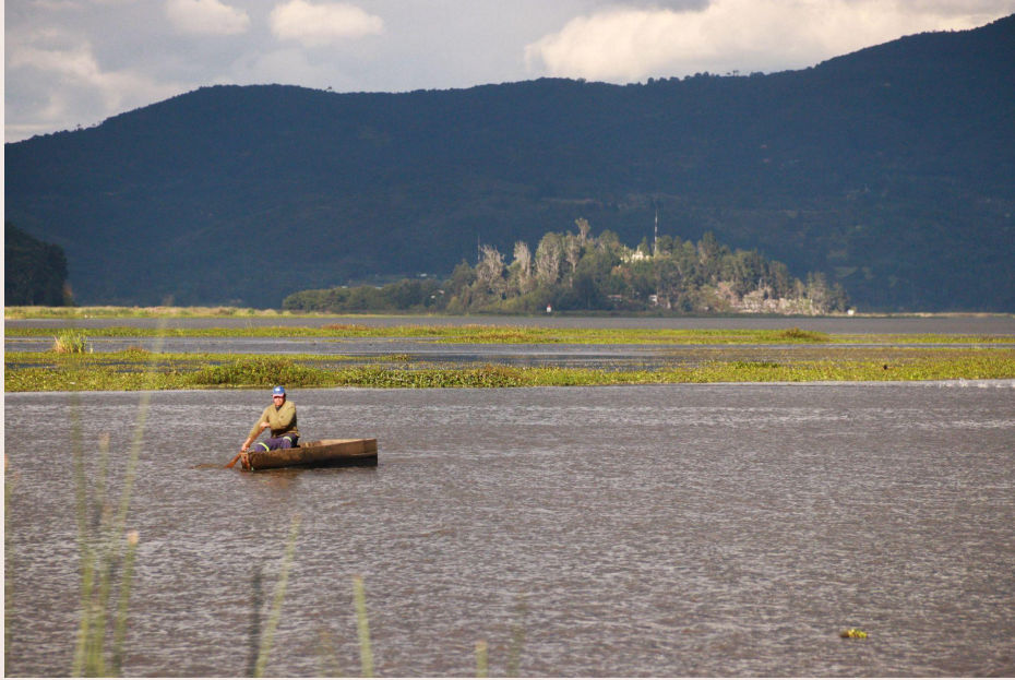
Imagen 11. Laguna de Fúquene (2022). 7

¿Qué significa la pervivencia cuando la vida está amenazada?