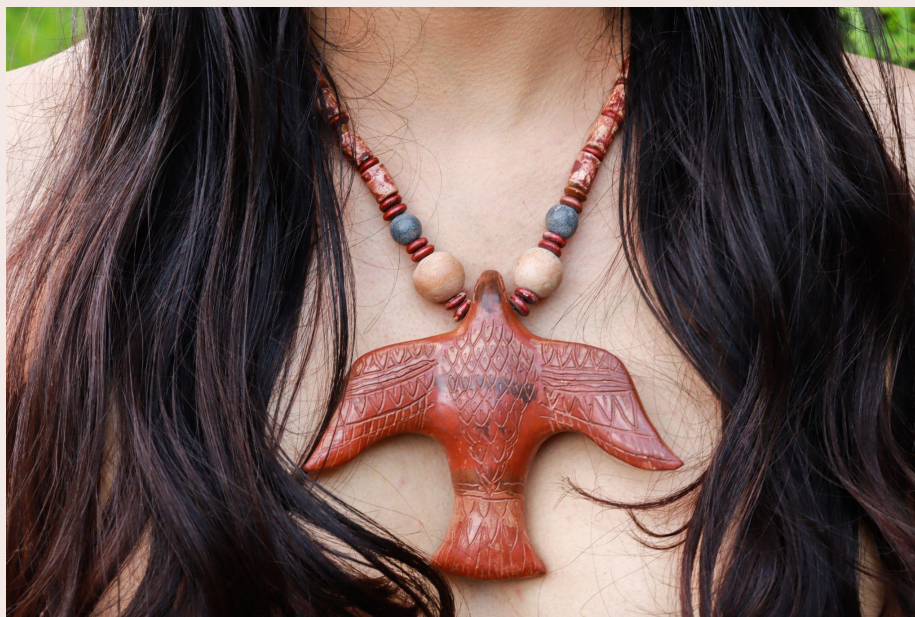
Imagen 21. Silbato Águila. Choachí (2022). Samuel E. Pardo Caro.

El escenario rural, donde se da acontecimiento a lo campesino, con todo lo que representa, es uno de los escenarios en los que se tiene la oportunidad de comprender la potencia del trabajo comunitario. Por ello, esta experiencia se relaciona en el presente apartado como encuentro para la co-creación, pues es aquí donde tengo la oportunidad de encontrarme con diversos aprendizajes que posibilitan la conformación de un proyecto colectivo sobre el arte de la tierra, un saber que hace parte de la memoria indígena y campesina, que se ha mantenido en el telar del tiempo desde hace milenios, y que desde la co-creación renace entre la fuerza de la pervivencia.