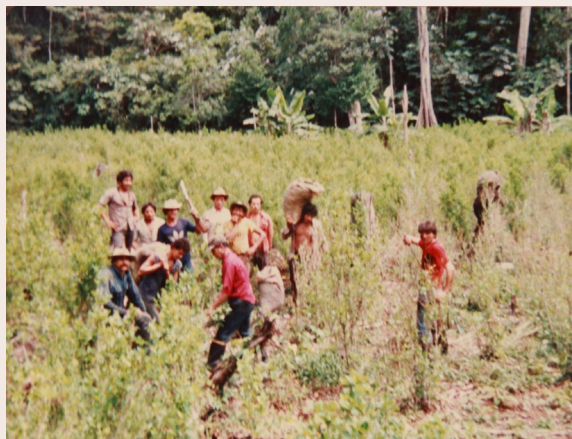
Imagen 15. Fotografía de archivo. Anónimo. s.f. 9

¿A quién pertenece la tierra? Reconstruyendo las raíces de la familia campesina, encontramos en el álbum de la abuela las imágenes con mayor antigüedad del archivo familiar, el cual está compuesto por elementos visuales que se han distribuido entre los álbumes que conservan las mujeres de la familia. En estos registros encontramos a la Perla, y con ella una serie de fotografías análogas, con instantes de luz transicionales que han quedado en la memoria, en el acontecimiento de la vida campesina, en el sendero de abrojos, en el arado y la semilla, donde se van entrelazando experiencias violentas que han penetrado de manera amenazante territorios que lindan entre la paz y la guerra.