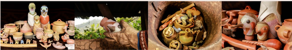
Imagen 23. Jornada de quema. Choachí (2022). Colectivo Alfarería Tybso Furatyba.

Una de las formas de la naturaleza que ha coexistido entre esta narración, ha sido la tierra, un material que guarda perfectamente la memoria. En la arcilla todos los vestigios y todas las huellas perduran: El brote y la grieta. El trabajo de las manos que se imprime en cada gesto profundo y sensible: extraer, limpiar, amasar, modelar, bruñir, detallar, engobar, grabar, soltar, quemar, sellar, ritualizar. Los adobes, los tiestos, las múcuras y el barro simbolizan un ciclo especial con los elementos que convergen en sus procesos: La arcilla que se toma del vientre de la montaña, el agua que yace dentro de la tierra, el aire que fluye entre su reverdecer, el fuego que fusiona y cristaliza, y el éter para su reafirmación.