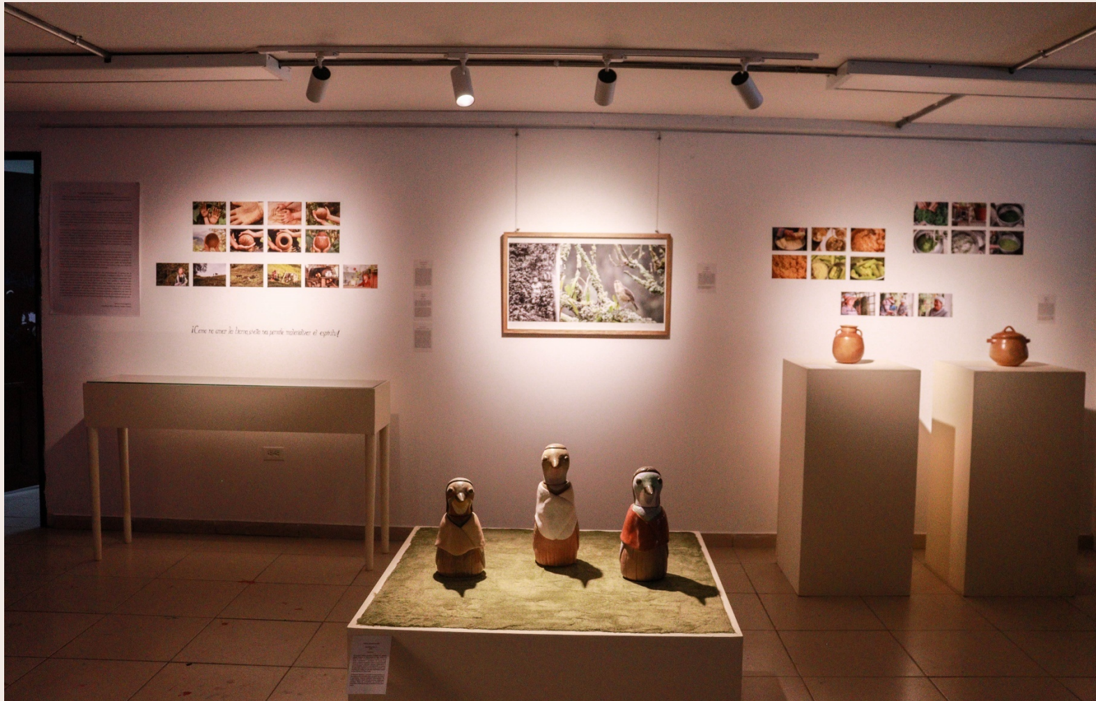
Imagen 42. Registro montaje. Instalaciones LAV, UPN. Bogotá. D.C. (2023).