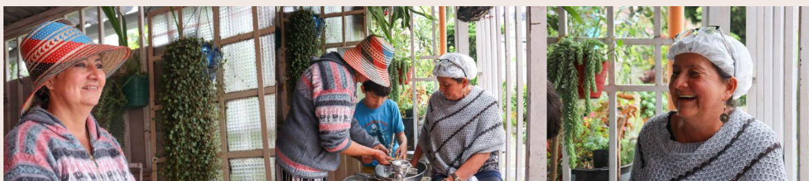
Imagen 31. La molienda. San Cristóbal Sur (2022).

La molienda ha sido una tecnología milenaria, moler hace parte de la cultura alimentaria que en nuestro territorio latinoamericano se sustenta en el maíz, en muchos casos, tomando forma de harina entre granos tostados y molidos. Antiguamente la abuela molía en piedra o con pilón, antes de la llegada del molino europeo la triada pilón-fogón-chorote fue por siglos la tecnología que dio mantenimiento a las familias indígenas, siendo heredada a las familias campesinas, este ajuar característico de la cocina criolla ha sido símbolo identitario de nuestra memoria ancestral y, aunque el intercambio entre culturas haya transformado la forma de preparar los alimentos, estos haceres siguen siendo una práctica cultural propia de nuestros territorios que entre memorias ha ido resistiendo.