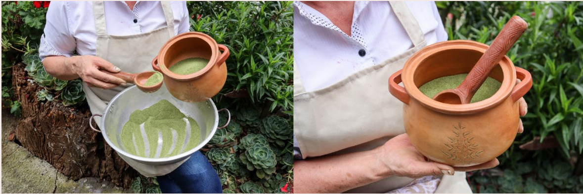
Imagen 32. Ollera con ruda. San Cristóbal Sur (2023).