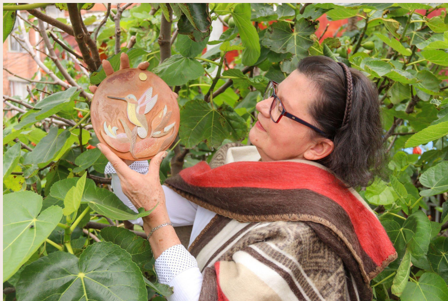
Imagen 27. Quincha. San Cristóbal Sur (2023). Autoría propia

¿Las palabras del pensamiento campesino y el apañe a todas nuestras querencias? ¿La canción que he dedicado con gratitud y aprecio hacia la admiración de mis mujeres? 21