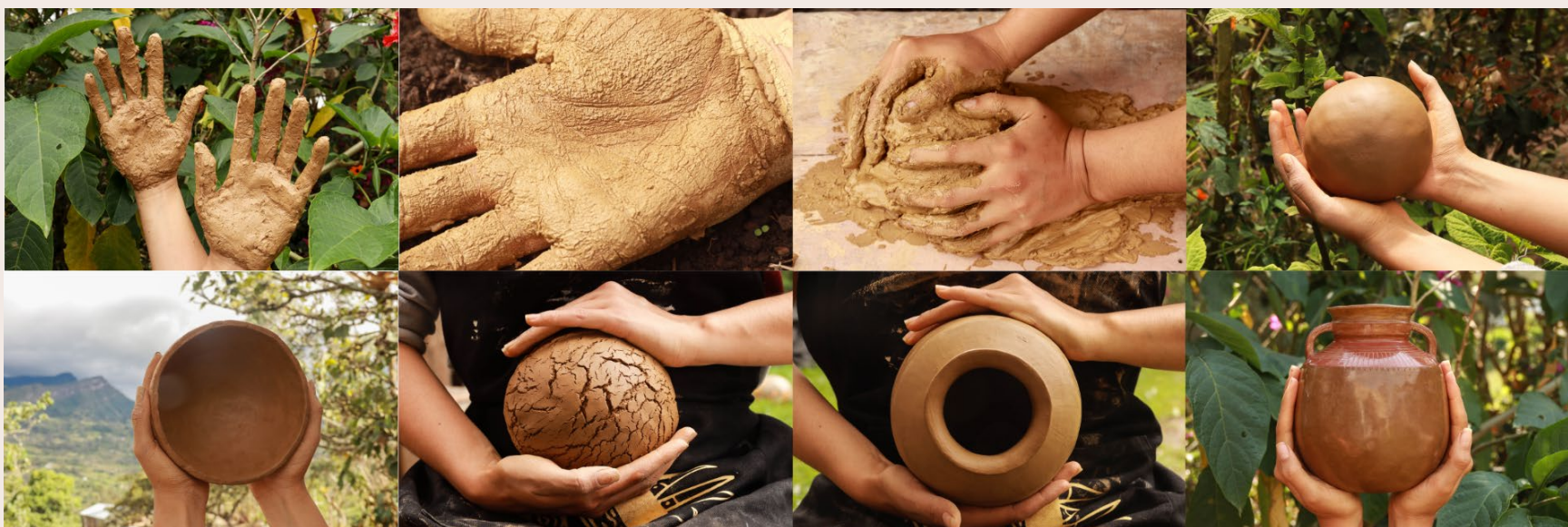
Imagen 19. Serie Barro que germina. Choachí (2022). Concepto: Ana Milena Rico.

¡Cómo no amar la tierra, si ella nos permite materializar el espíritu!