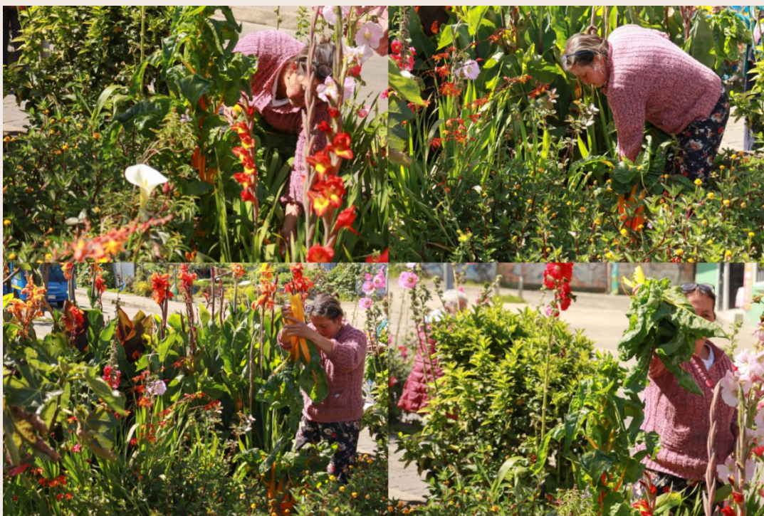
Imagen 25. Madre Recolectora. San Cristóbal Sur (2022).

Resistir a través de la juntanza, ha sido una de las prácticas culturales que les ha permitido a nuestras mujeres fortalecer su capacidad de resiliencia, mediante la sororidad, acompañamiento y hermandad al sanar juntas para reconstruir sus propias vidas y hacer de la germinación un arraigo y de la espera una nueva luna naciente; sentipensar con la vida, defenderla y tener la esperanza de otros mundos posibles. ¡La resiliencia! Eso es lo que podemos reafirmar como defensa de nuestro sentir, ¿cómo sentir la tierra mediante el compartir de algunas prácticas que se han salvaguardado desde los tiempos de la abuela en nuestras memorias?