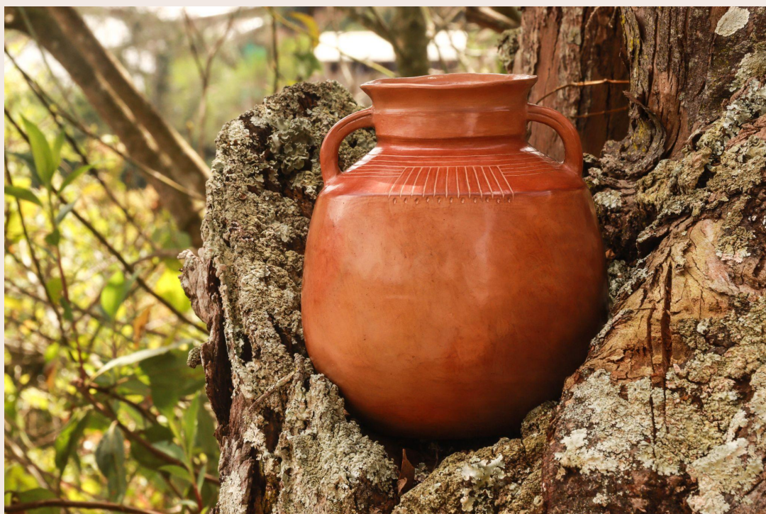
Imagen 37. Múcura chichera. San Cristóbal Sur (2023). Autoría propia.

Sentir la tierra implica esa necesidad de recuperar la diversidad en el pensar y hacer de nuestros territorios de vida, como manifiesto de defensa de lo que somos. La co-creación de esta múcura surge para responder a las significaciones del objeto de barro, que se manifiesta entre los recuerdos del moyo, la vasija y el tiesto en la cultura campesina, la vereda, la cocina, la surca y el maíz. Una olla para transportar fermentos es contenedora también de las historias que hemos tenido la oportunidad de compartir, una antigua tradición artesanal elaborada con barro. De allí que hacer una múcura rememorando la raíz de la tierra fue una de las experiencias más bellas por el proceso de tejer nuestra memoria entre el barro, el pensamiento y los sentires que nos evocaban a nuestras abuelas chicheras.