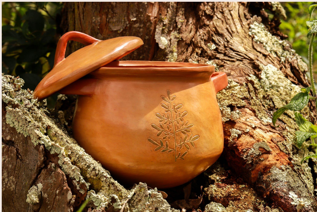
Imagen 34. Olla Rudera. Choachí (2022). Autoría propia.

Una olla rudera de arcilla dorada, elaborada con el pálpito de mis manos, el conocimiento de mis mujeres, nuestros saberes heredados y oficios aprendidos, una vasija que guardará el vínculo de nuestra raíz con la tierra, las semillas que alimentan el cuerpo de la mujer enraizada, el retorno a los recuerdos arraigados, olvidados, sanados y anidados por la memoria que nos enseña cómo habitar el presente.