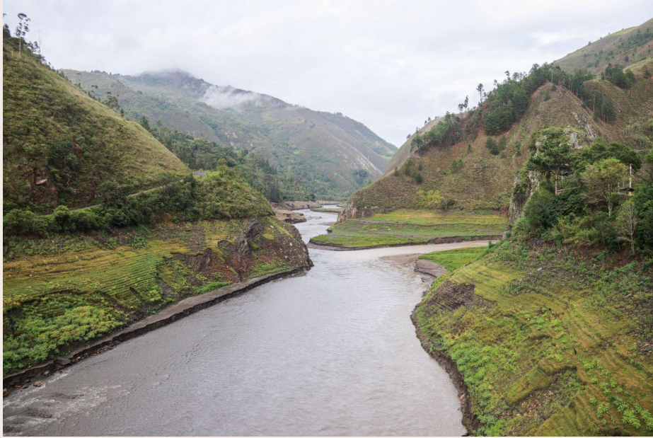
Imagen 10. ¿Cómo detener el cauce del río? Represa Chivor (2022).