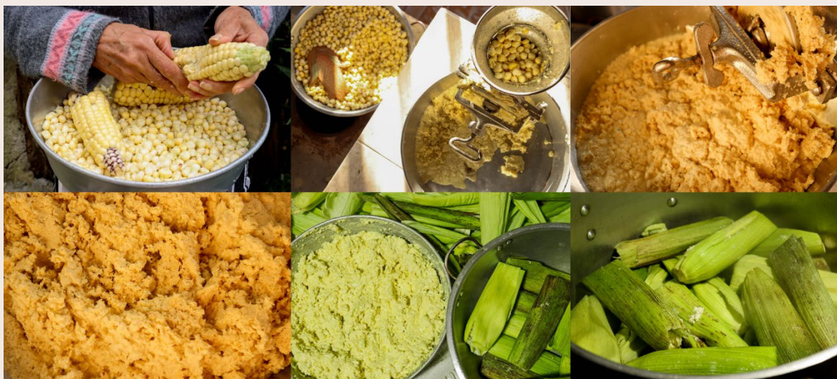
Imagen 36. Molienda de Maíz. San Cristóbal Sur (2023).

Empezamos con los envueltos, primeramente, abonar la tierra, sembrar el maíz y esperar seis meses para que crezca. Cosechar y escoger las mazorcas tiernitas, sacar las hojas, limpiarlas bien, moler los granos, que queden bien triturados. ¡Bien molidos! Echarle suficiente queso y mantequilla, un poquito de sal, un poquito de miel, y envolverlos en los ameros de la mazorca. Mientras tanto, hacer una camita en el asiento de la olla con las tuzas, las hojas y un poquito de agua, por encima van los envueltos que se ponen a cocinar durante una hora o dos, dependiendo la cantidad de envueltos que se enrollen para que queden bien cocidos.