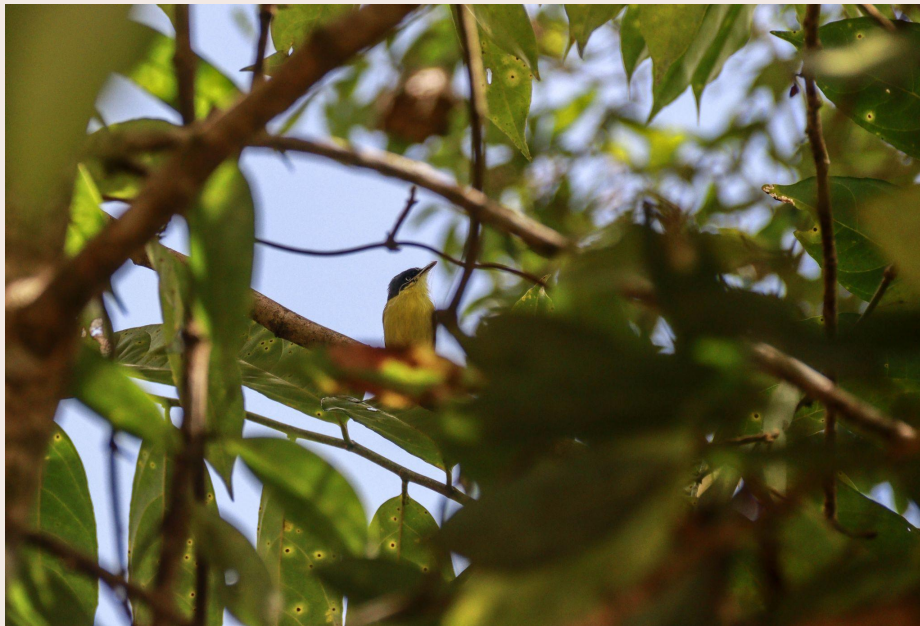
Imagen 3. Titiriji ( Todiostrostrum cinereum ). Alto Calichana, Santa María, Boyacá (2022). Autoría propia.