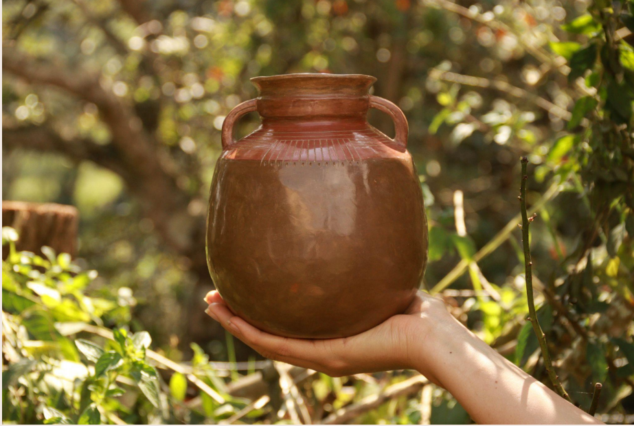
Imagen 18. Mucurita de barro. Choachí (2022). Samuel E. Pardo Caro.