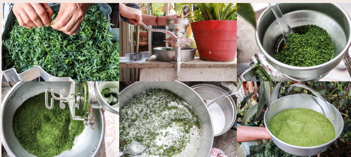
Imagen 33. Molienda de Sal Ruda. San Cristóbal Sur (2022).

Para la molienda, una vez recolectada la planta de ruda, se separan las hojas de los tallos, se ponen a secar al sol durante 20 días y se mueven periódicamente hasta que estén deshidratadas. Una vez secas las hojas, se ajusta el molino a un nivel no tan apretado para que la ruda quede con una textura granulosa, después de esta primera pasada se ajustan las chapolas del molino para quede más apretado; luego agregamos la sal a la ruda al interior de la tolva para que se integren homogéneamente. La colamos y repetimos el procedimiento hasta que la sal quede completamente verde y con una textura refinada.