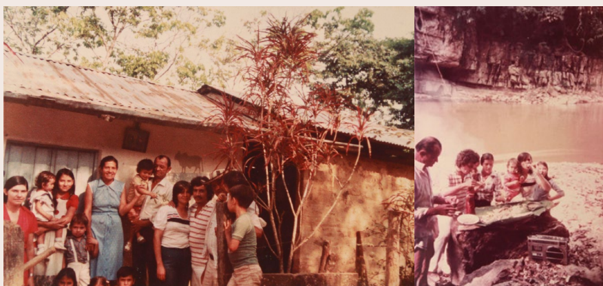
Imagen 13 y 14. Fotografía de archivo. Anónimo. s.f. 8

Nohora: Esas, mi papá compró esa casa y esas son las escrituras, y la casita se llamaba la Perla, por ahí están las fotos de la casa, a esa casa fue don Manuel y doña Clemencia.