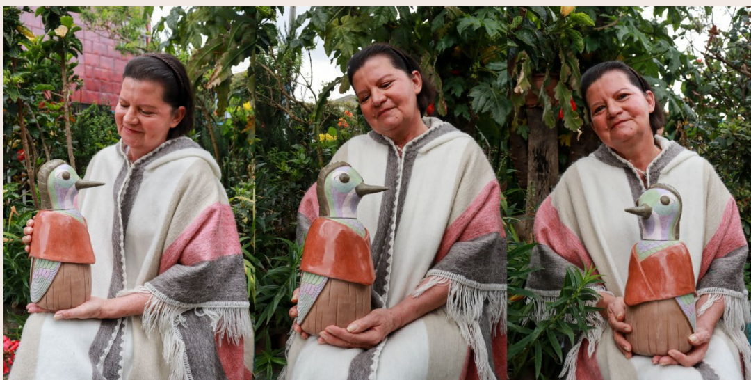
Imagen 29. Esperanza y la Abuela Colibrí. San Cristóbal Sur (2023).

Se hacen manifiestas estas aves nativas del altiplano cundiboyacense, recordándonos el espíritu de la abuela como un ave, sus vuelos y anidaciones. En nuestro sentipensar con la tierra, y el cariño que por sus críos tiene la madre naturaleza, el conmuevo especial de mis mujeres por estas habitantes del cielo, su danza y su canto, que van recreando la expresión de otros mundos florecientes entre las semillas que transportan sus alas migrantes.