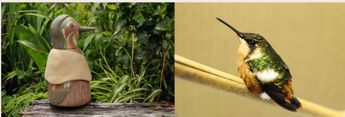
Imagen 28. Mensajeros alados. San Cristóbal Sur (2023). Autoría propia

La elaboración de estas piezas fue para mí sentir, la posibilidad de modelar una gran mujer contenedora, en cuanto a su forma y sugerencia estética, desde la representación zoomorfa de las aves de la tierra nativa, plumas multicolores y picos alargados, desde lo antropomorfo, el cuerpo de una mujer colibrí cubierta con una ruana o poncho. Las estéticas y simbologías de mis mujeres colibríes contenedoras de vuelos rituales y cantos de pervivencia. Estos objetos utilitarios que he creado y ofrendado, hechos del polvo, emergen nuevamente desde la concavidad de relatos y memorias con una multiplicidad de formas desde las que es posible dignificar y reivindicar nuestras vidas.