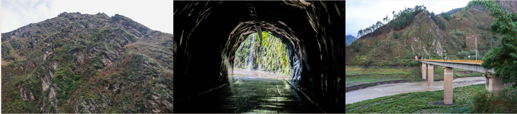
Imagen 9. Trayecto Las Juntas (2022).

Atravesar la tierra desde su interior me hacía sentir como si estuviera siendo parida por la montaña ¿cómo olvidar el sonido que emerge desde allí dentro? Los chorros de agua que se liberan en las filtraciones de la montaña y descienden entre las rocas, un instante aturdidor pero maravilloso, senderos oscuros que me recordaban una gran historia sobre la luz al final del túnel. Cuando mi madre me parió el escenario convergía en las pulsaciones que hacen frágiles la fuerza de la vida; mientras yo estaba naciendo, la mujer que daba origen a mi vida moría, de su voz escuché este relato en el que ella recuerda caminar entre un túnel descalza, cargándome con las pocas fuerzas que le quedaban, acompañada por una estrella que guiaba su camino logró atravesar el túnel y en ese momento como si se tratara de un milagro, volvió a la vida. Salir entre la montaña me hacía sentirla como a mi propia madre, una gigante que me cubría toda, las montañas de la tierra nativa eran las abuelas ancestrales que iban hablando sobre sus milenios de resistencia.