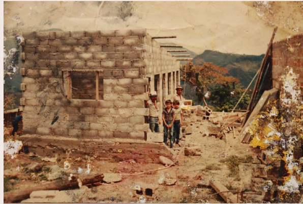
Imagen 17. Fotografía de archivo. Anónimo. s.f. 13

“¿Construiría el pájaro su nido si no tuviera su instinto de confianza en el mundo?” (Bachelard, 2000, p. 103).