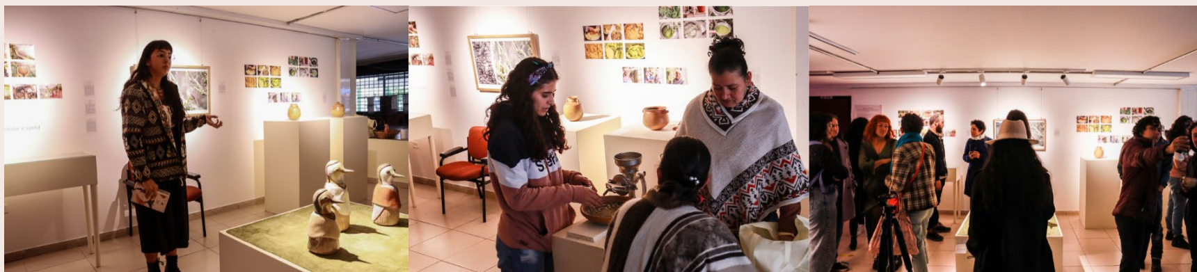
Imagen 44. Registro mediación. Instalaciones LAV, UPN. Bogotá. D.C. (2023). Samuel E. Pardo Caro.