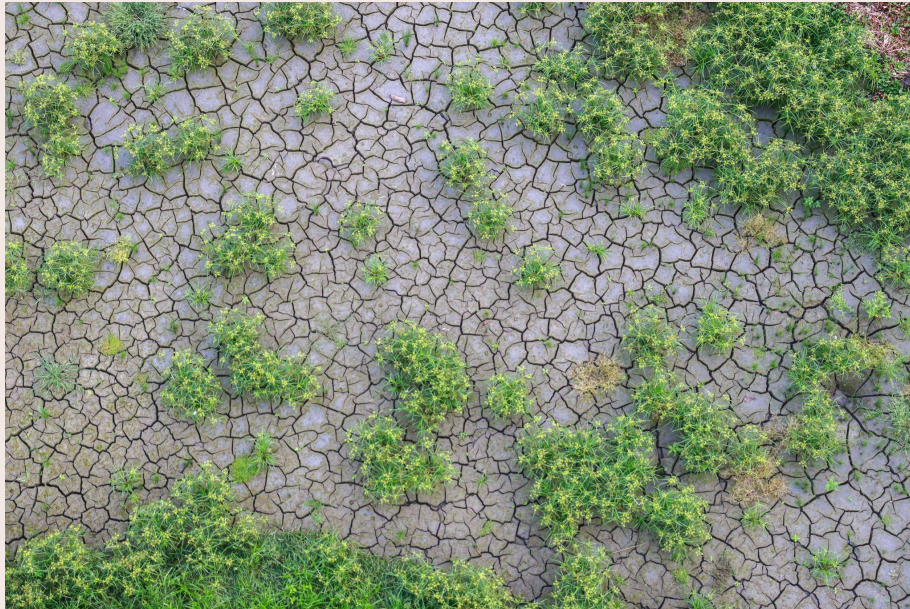
Imagen 8. Un manantial de greda. Santa María Boyacá (2022).

Gran parte de la represa de Chivor se puede observar en el trayecto de la vía las Juntas, una carretera construida durante la primer etapa del proyecto que buscaba reconfigurar el espacio, modificando la carretera antigua que desde hace siglos seguía el curso del río, de este modo se construyó una nueva carretera que atraviesa las montañas de la cordillera oriental por medio de catorce túneles que conectan las Juntas con Santa María, un recorrido que transcurre cruzando por la vía alterna a los llanos orientales a la altura de la represa del Sisga, pasando por la hidroeléctrica de Chivor que rodea los tres municipios: Macanal, Guateque y Santa María.