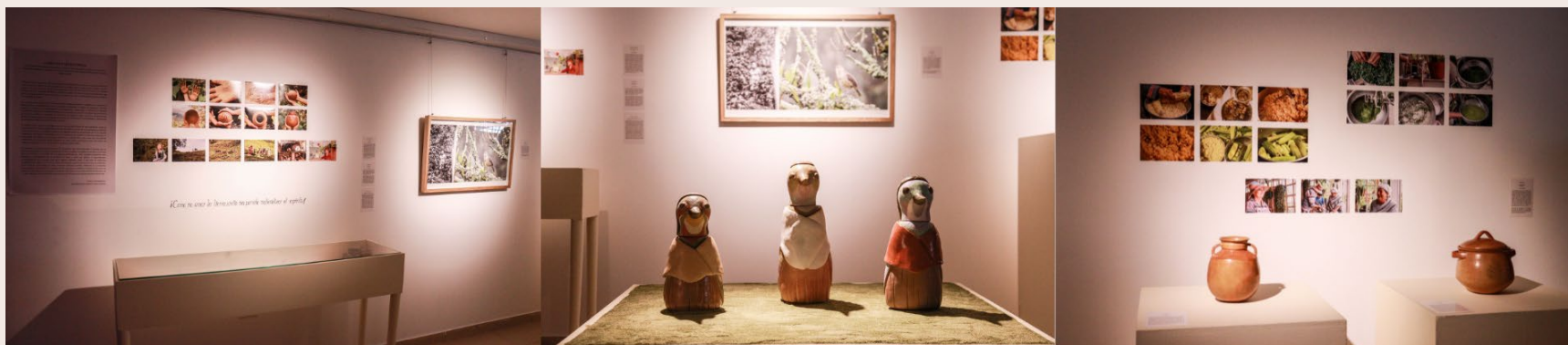
Imagen 43. Registro montaje. Instalaciones LAV, UPN. Bogotá. D.C. (2023). Autoría propia.