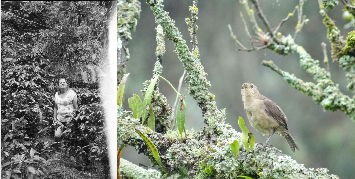
Imagen 5 y 6. Semejantes. Archivo análogo y digital (2019). Autoría propia. 4

Eran los días en que los sueños me habitaban, yo simulaba ser pájaro haciendo romería a tus cuentos. Bajo la brisa el tenue sonido de tu canto aun me narra historias, bajo el sol, tu sombra surca la tierra recordando el camino que estoy por recorrer, en silencio te sueño vestida de colores, habitando la hierba, recolectando flores rojiamarillas. Junto al camino mi madre se va deteniendo, ve crecer las flores, juntas escuchamos tu canto, eran los tiempos del encuentro, del ensueño de un ave.