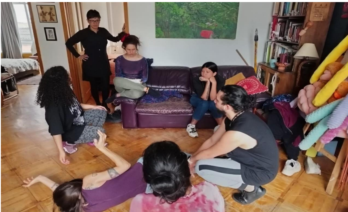
Imagen 5. Segundo encuentro co-laboratorio.

Para el tercer encuentro, desde el equipo coordinador diseñamos un archivo compartido como herramienta de sistematización colectiva. En este espacio digital se recopilaban