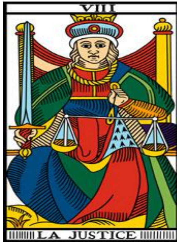
Imagen 2. La justicia en el Tarot Marsella. Nicolas Conver (1760)