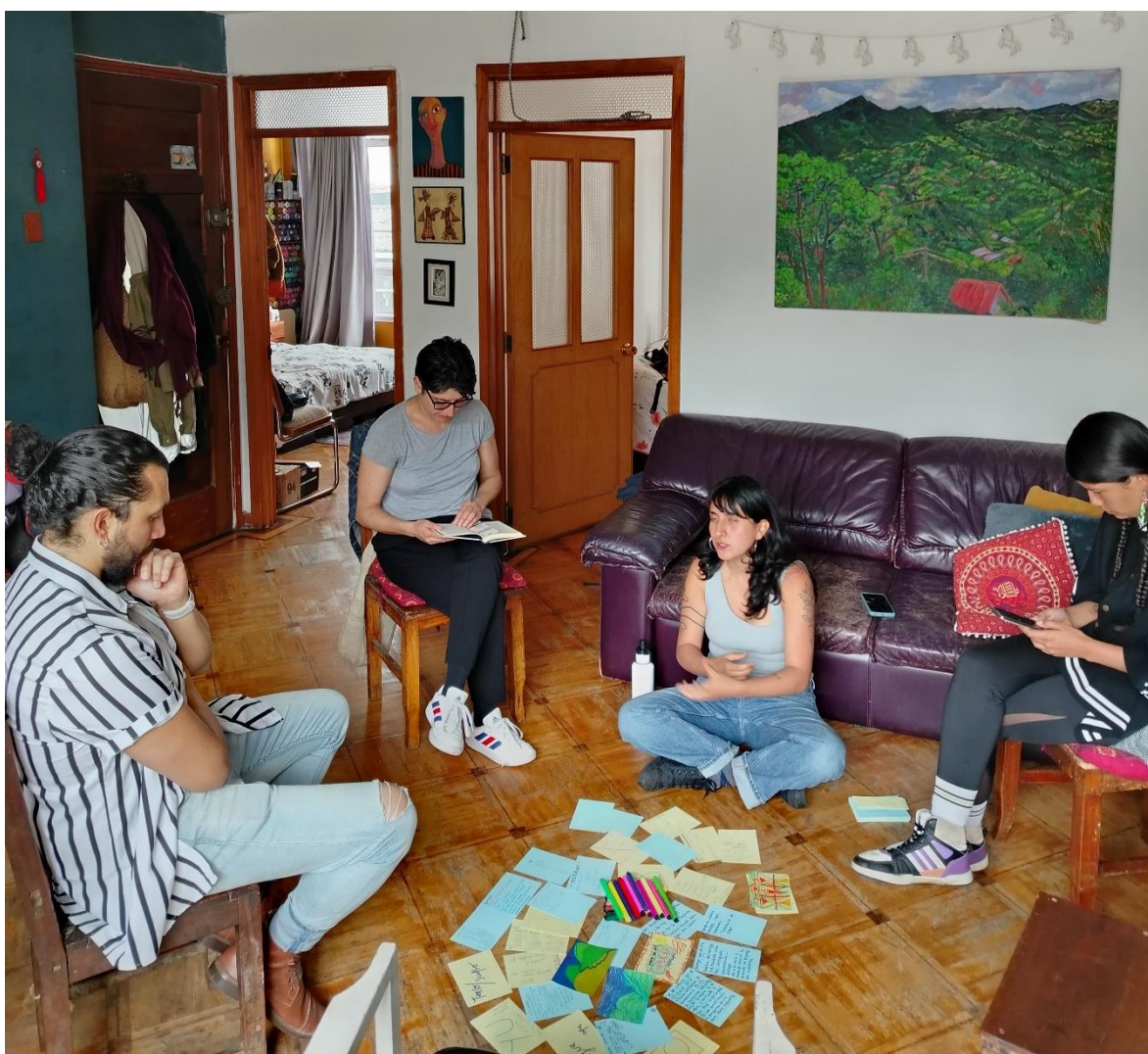
Imagen 7. Cuarto encuentro co-laboratorio.

El cuarto encuentro lo dedicamos exclusivamente a la creación colectiva del guion del cortometraje, a partir de las reflexiones, bifurcaciones narrativas y tensiones simbólicas nos sumergimos en un proceso de creación que convocó a la memoria, intuición e imaginación de todas las participantes. Todas las voces tenían lugar y la autoría individual se intentó desdibujar para abrir caminos hacia una obra colectiva y consensuada en su mayoría.