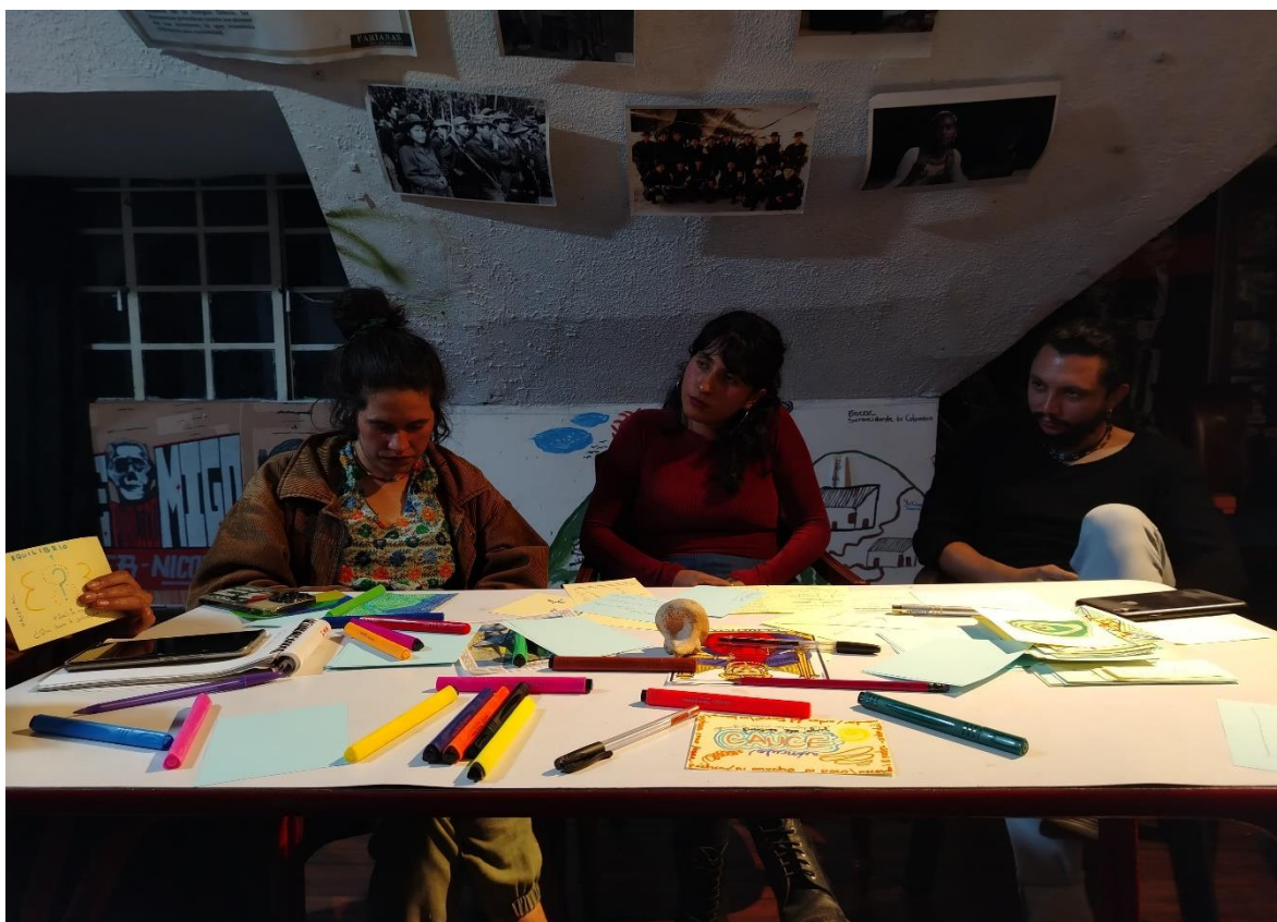
Imagen 6. Tercer encuentro co-laboratorio.