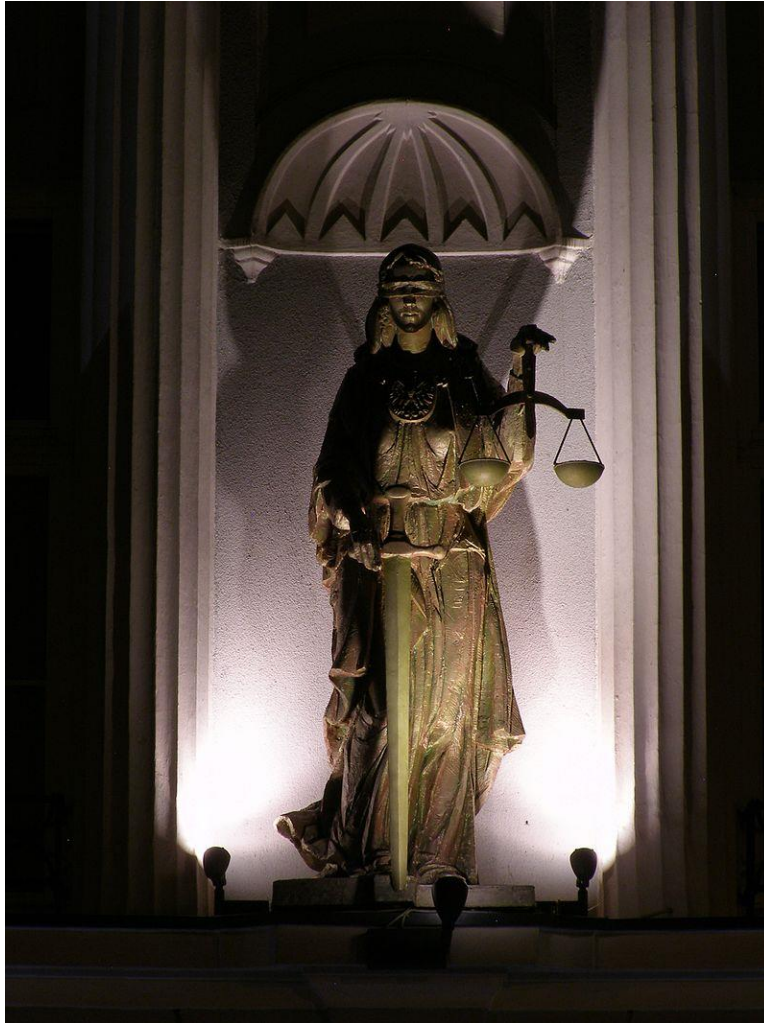
Imagen 1. Fuente: Estatua de Temis del Palacio de Justicia de Tarrow. Otrębski, A. (s.f.). Justitia (sculpture at the District Court in Toruń)