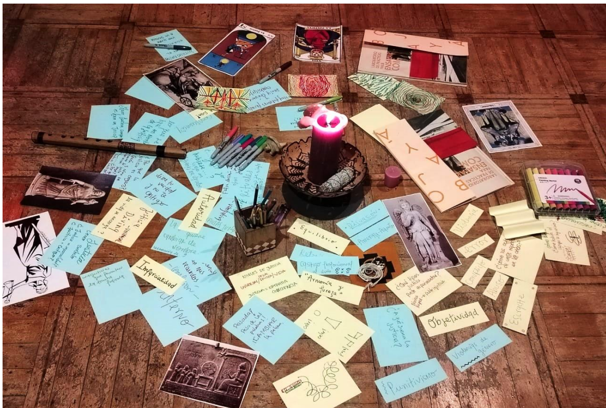
Imagen 3. Primer encuentro co-laboratorio.