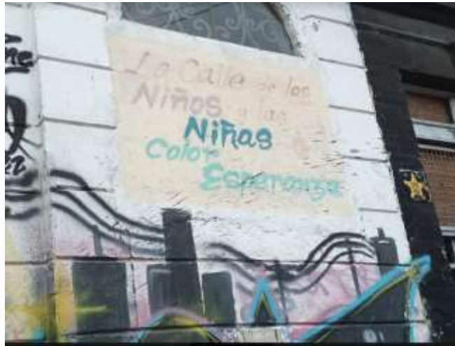
Figura 7. Mural elaborado por la Fundación Social Crecer (calle en la Favorita)

El informe desarrollado en la Fundación Social Crecer, sede la Favorita, planteado a través de la metodología de Estudio de caso, permite construir las conclusiones, desde tres puntos de reflexión: