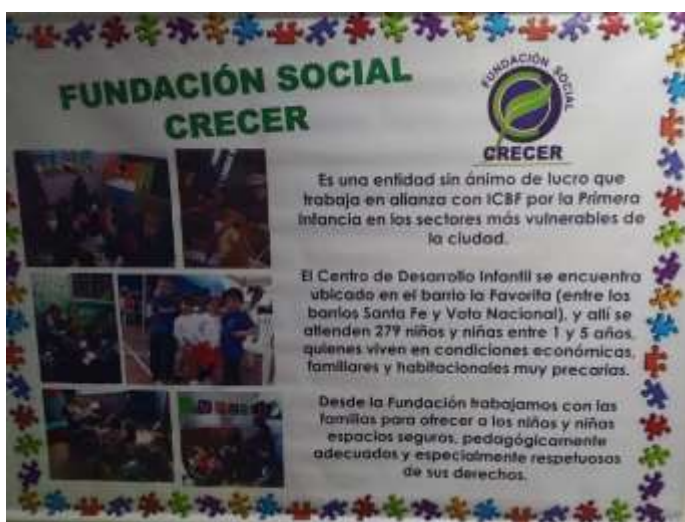
Cartel de las instalaciones de la Fundación Social Crecer