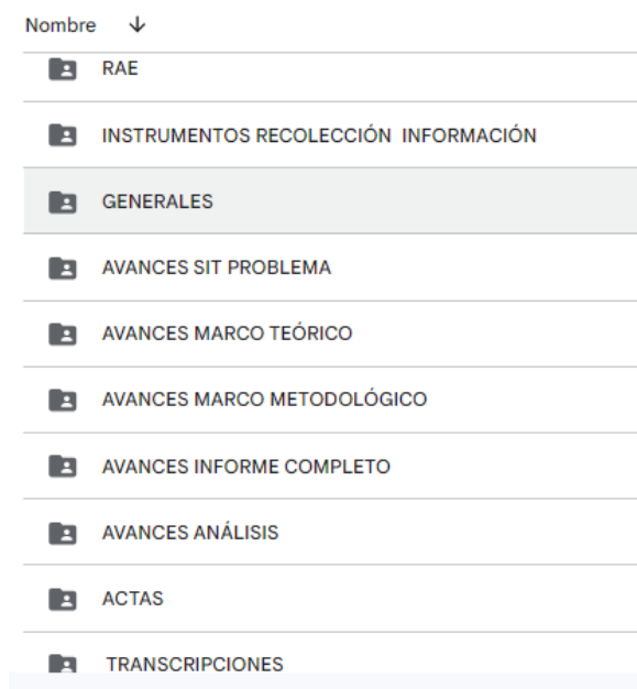
Tabla 2. Organización y registro de la información

A partir del registro organizado en dicho drive, se seleccionaron imágenes, referencias y anexos relevantes para la comprensión del estudio de caso los cuales se encuentran a lo largo del presente informe.