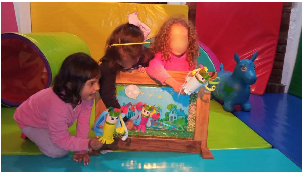
FOTO 35: Un pedacito de sueño en la montaña.