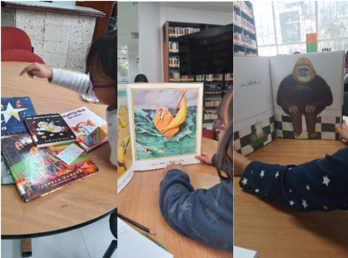
FOTO 48: Amamos la literatura infantil. 2023 y 2024