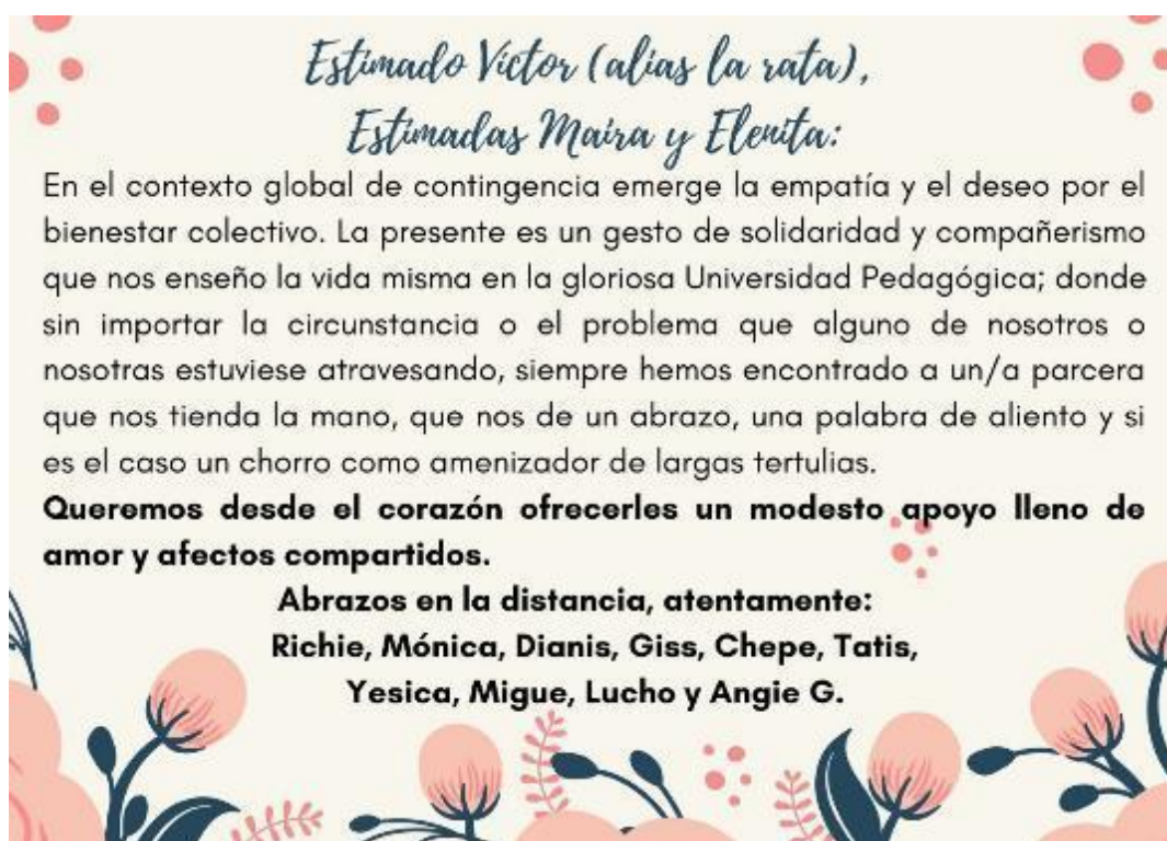
FOTO 8: Les amigues apañándonos en tiempos oscuros. 2020

En medio de nuestra corta relación con el colegio de Enena, venía llegando la pandemia del coronavirus a Colombia y el 25 de marzo se declara cuarentena nacional, por lo que nuestra relación de forma presencial con la escuela formal terminó en ese momento. Nuestra historia como manada, en un momento tan