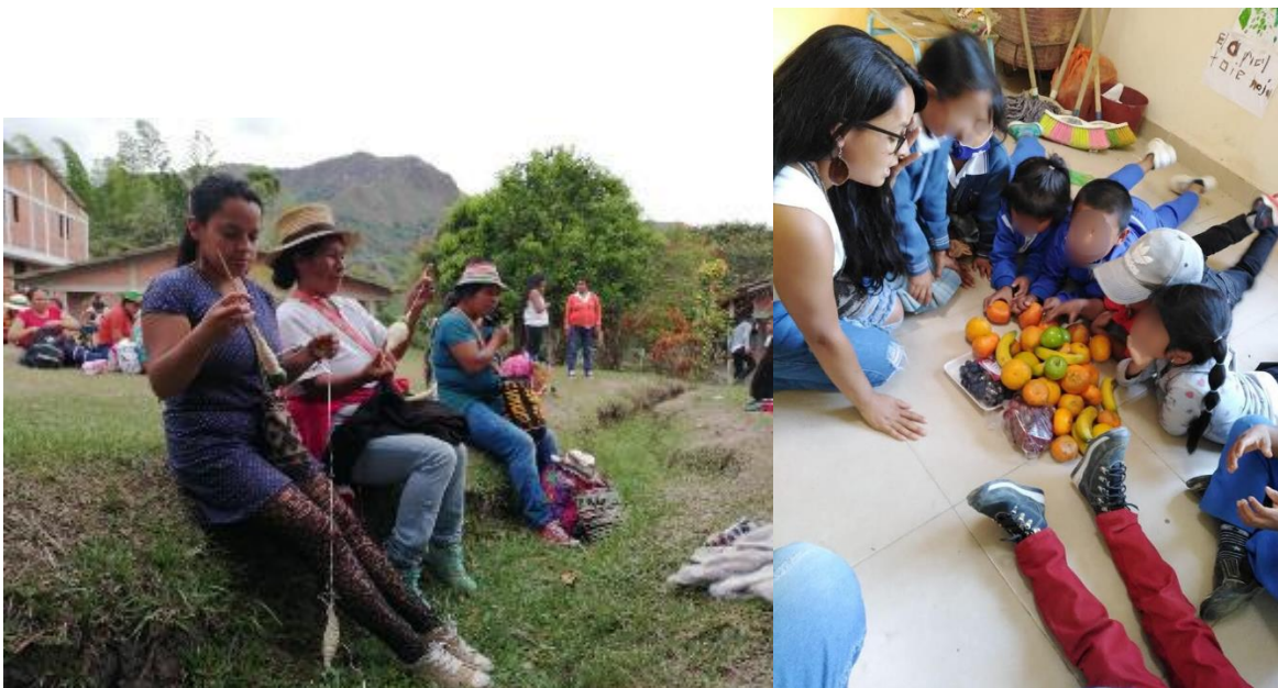
FOTO 18: Aprendiendo de los saberes que se manifiestan en el Sakhelu. Y compartir alrededor de las semillas con lxs niñxs.

ancestrales para no olvidar los usos y costumbres como pueblo. Además, de mantener viva la cosmovisión para seguir perviviendo como pueblos indígenas.