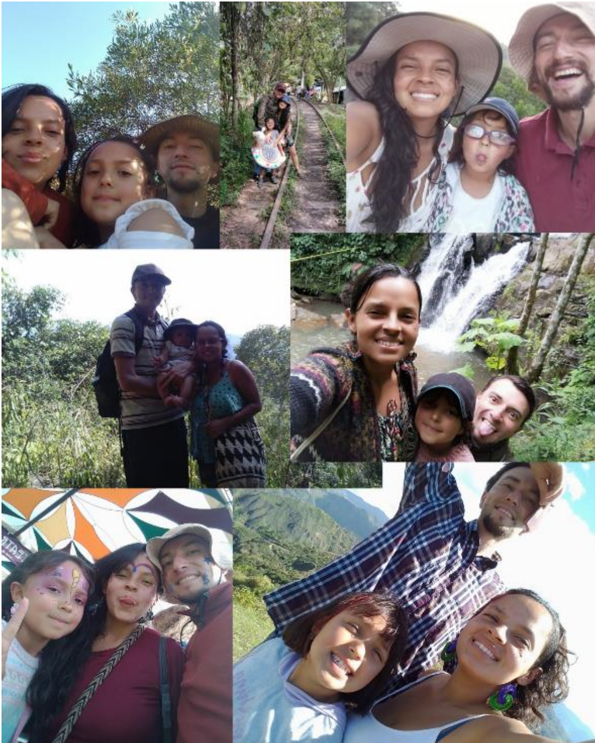
FOTO 54: Hacer hogar no ha sido sencillo, pero somos refugio.