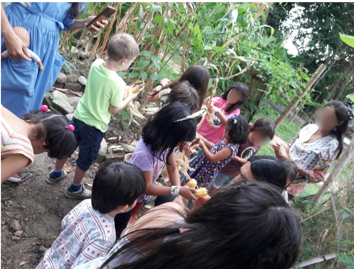
FOTO 43: Cosechando maíz sembrado por lxs niñxs.