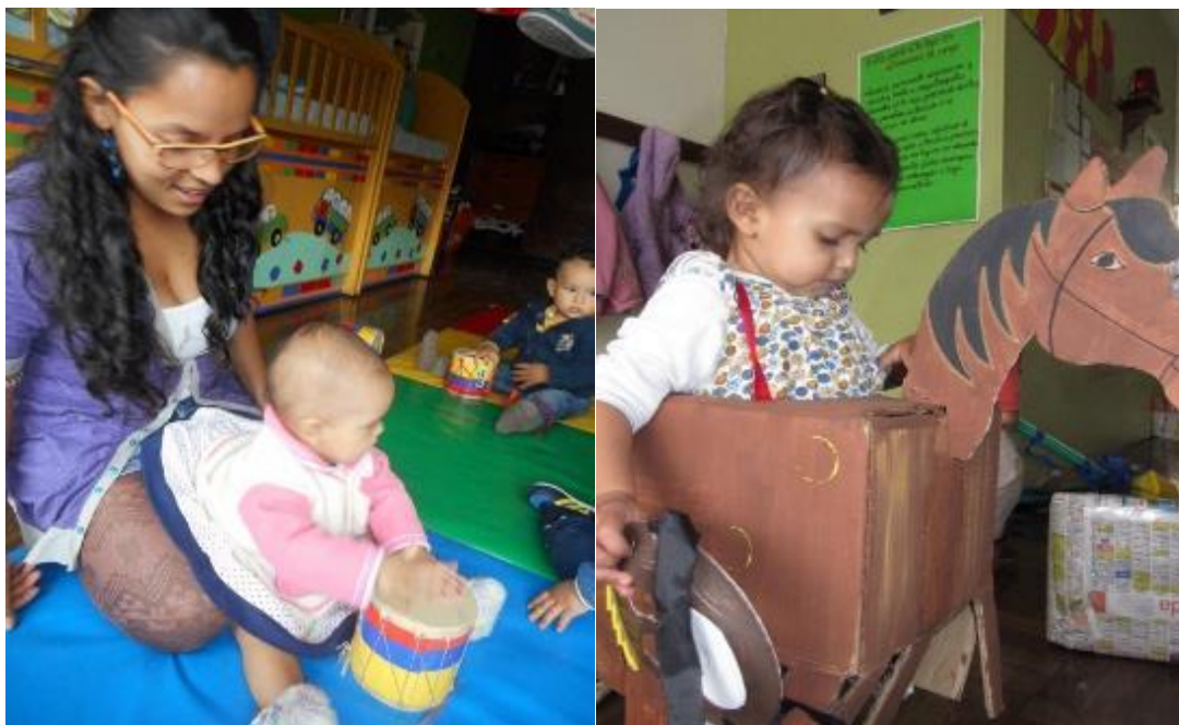
FOTO 4: Momentos vividos en la Escuela Maternal. 2016 y 2018