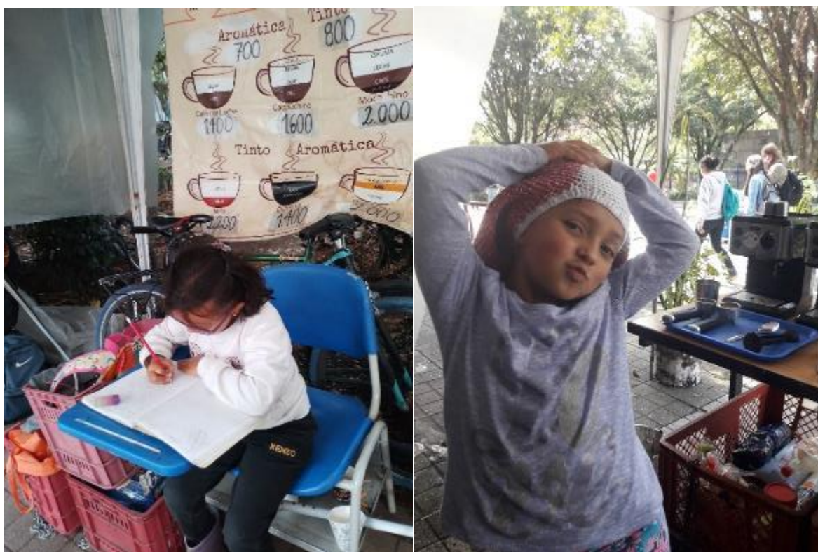
FOTO 50: Nuestro lugar seguro en la universidad.