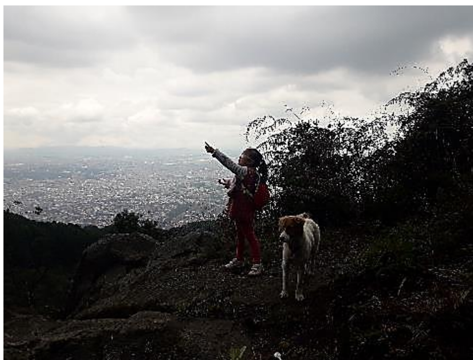
FOTO 23. Leer la naturaleza. 2021