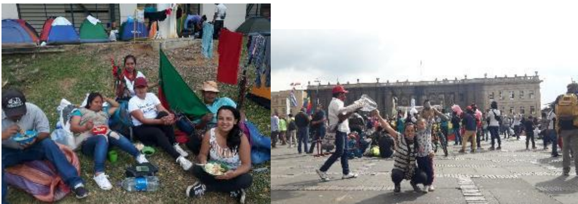
FOTO 17: Almorzando en el coliseo del pueblo. Con mi hija y la Minga en la Plaza de Bolívar de Bogotá.