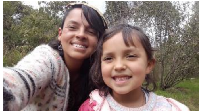
FOTO 30: Crecemos como las plantas, desde la semilla hasta ser grandes árboles que le darán abrigo a otros seres. Vivero parque la florida.