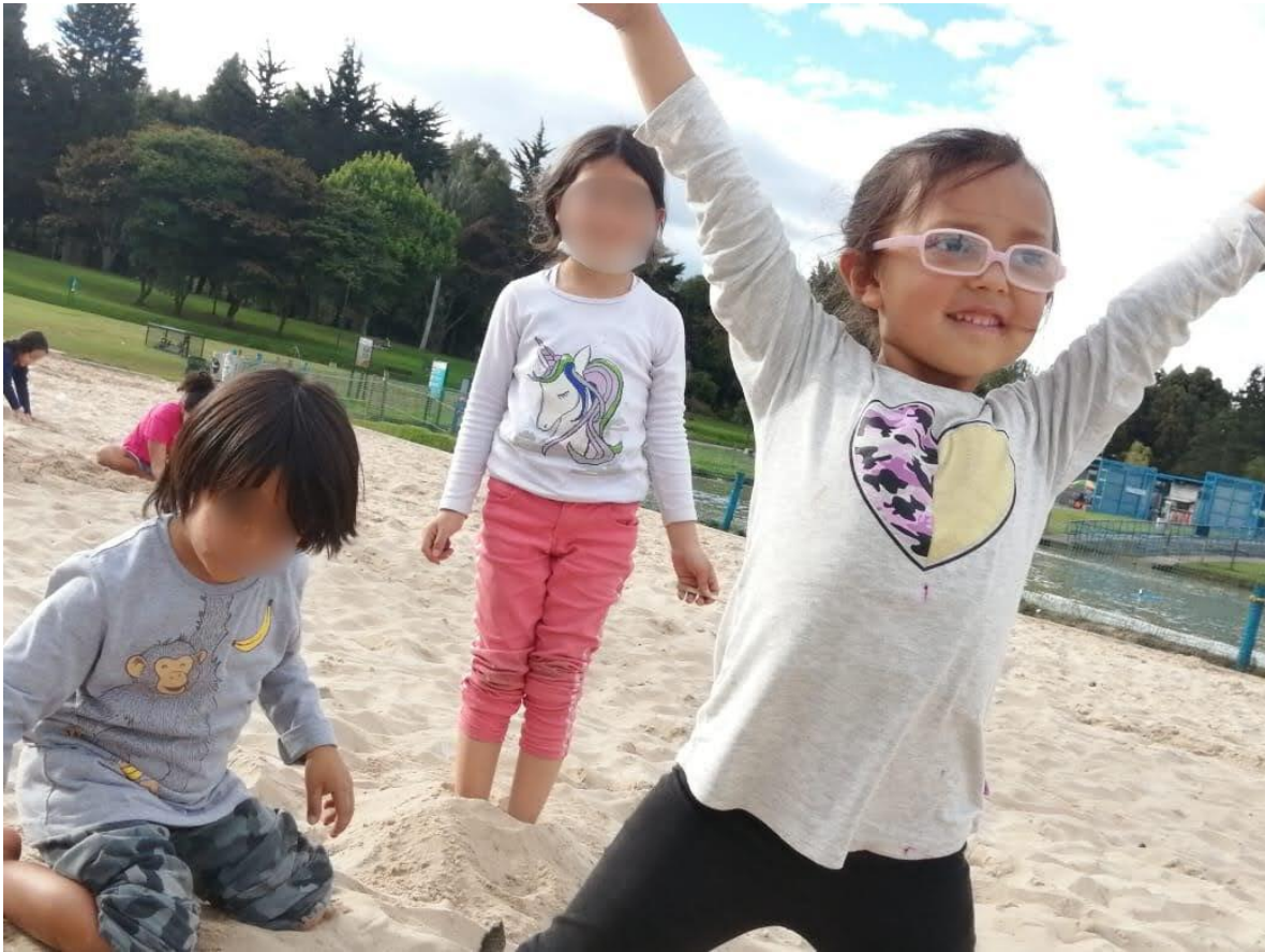
Foto 21. Salida con Casa Taller al parque Simón Bolívar.

Dentro de las múltiples experiencias que se viven en este lugar se realizan procesos que desde el compartir permiten aprender de panadería, tejidos (macramé, crochet, chaquira) pintura, cerámica, esténcil, agricultura donde se promueve el cuidado de la semilla y la soberanía alimentaria, las plantas como fuente de medicina (pomadas, jabones, baños) , yoga, música, teatro, bio-construcción, entre muchas más que van surgiendo en el día a día construyendo espacios que van configurando la magia de la casa, estas vivencias se van tejiendo desde las voluntades de muchas personas que llegan a este espacio con la energía de apoyar y vivir el proceso, a través de estas experiencias se promueve una mirada holística de la vida en donde van emergiendo herramientas desde el hacer y la acción. (Cárdenas, 2019)