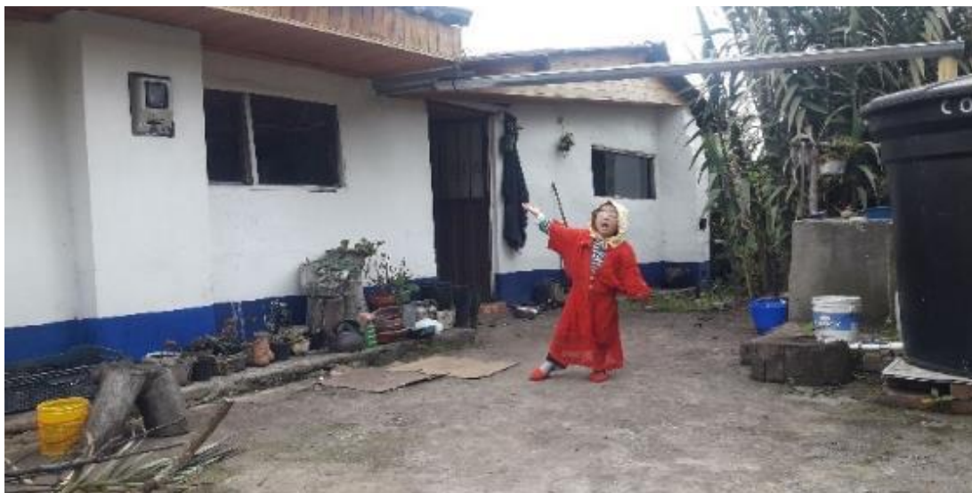
FOTO 14: Resultados de compartir con una teatrera. 31 de julio 2020

Ese relato abriría mi mirada frente a las diversas formas de educar; que son invisibilizadas, menospreciadas, subvaloradas, señaladas y hasta perseguidas por el orden hegemónico.