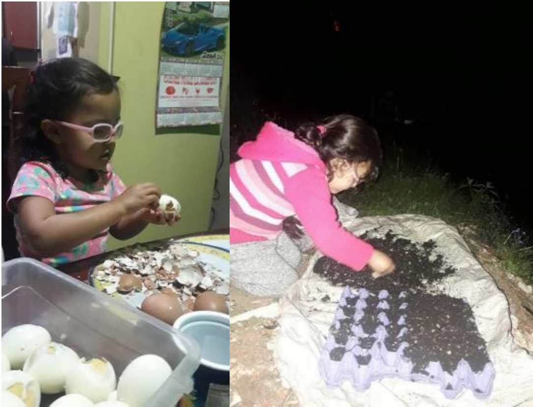
FOTO 11: Aprendizajes vitales para la vida. 2020

Desde entonces andan con nosotres lombrices rojas californianas; a las que alimentamos principalmente con desechos de frutas y composta, el objetivo principal es: obtener humus, un abono orgánico rico en nutrientes para las plantas. Sin buscarlo, nuestro lombricultivo se ha convertido en una herramienta pedagógica para grandes y peques, que: guiades por su curiosidad; quieren cogerlas en sus manos, observando con asombro sus movimientos. Aprovechan para preguntar por los cuidados que se les debe tener, su funcionamiento biológico, el ecosistema que necesitan para vivir, el ciclo de vida que tienen, etc.