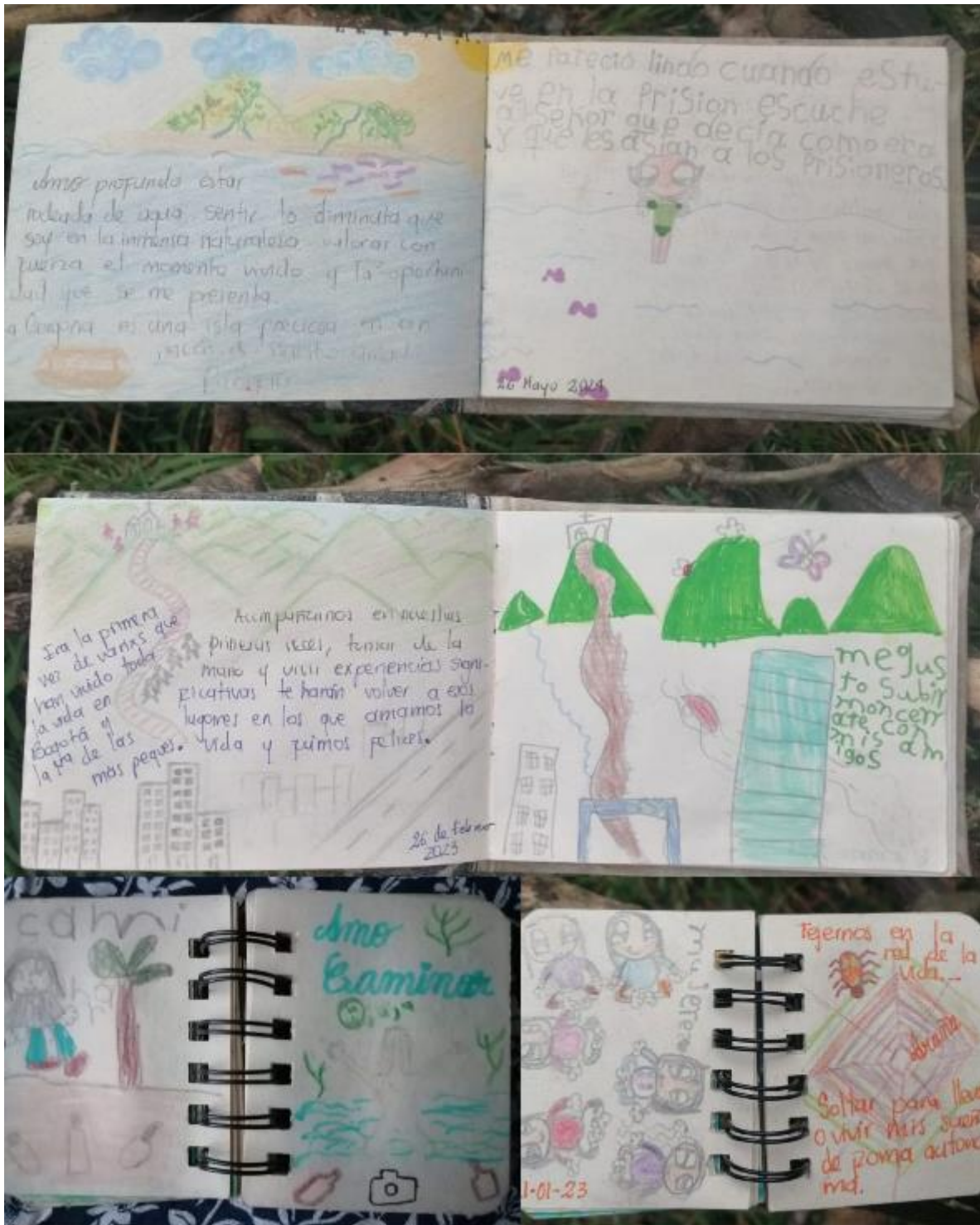
FOTO 3: Memorias de una madre-maestra y su hija.