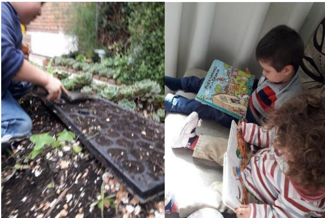
Foto 28: Aprendiendo con las infancias a Ser mejores personas para este amado planeta.