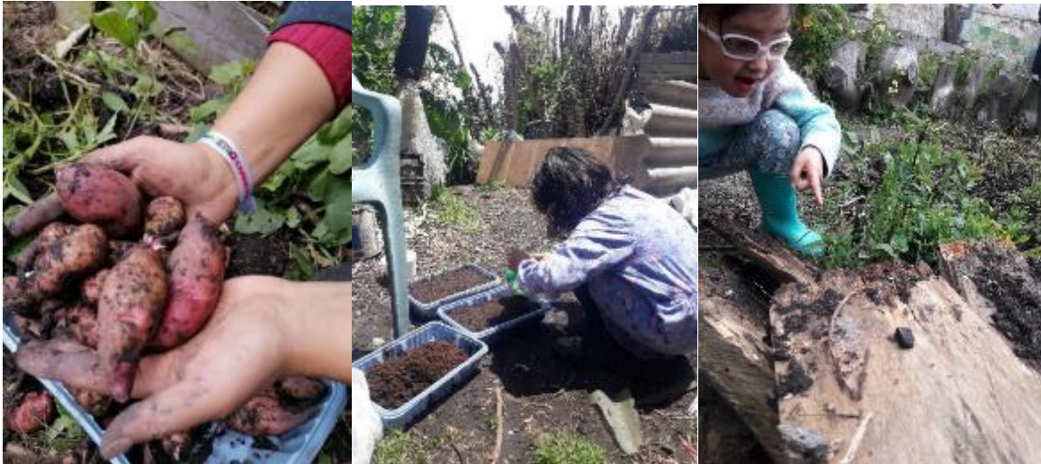
FOTO 33: Aprendiendo a coexistir con los demás seres de la naturaleza.