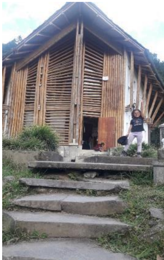
Foto 41: Biblioteca Pública la Casa del Pueblo de Guanacas.

Luego, pasamos por Popayán y subimos hasta el morro escuchando su historia o mito de creación, no sin antes pasar a la plaza de mercado donde confluye la etnicidad caucana. Con miedo a quedarme por carretera, por los derrumbes que habían sucedido y las fuertes lluvias de esos días, nos aventuramos a ir hasta Inza para llegar al resguardo indígena de Yaquiva, donde mi amada estaba esperándonos. En esta oportunidad iba de la mano de mi hija, volvía a este territorio que me ha dado tantas experiencias espirituosas e interculturales, que me permitieron romper imaginarios alrededor de las comunidades indígenas del Cauca, donde aprendí lo complejo y la multiculturalidad que existe en la palabra “indígena”.