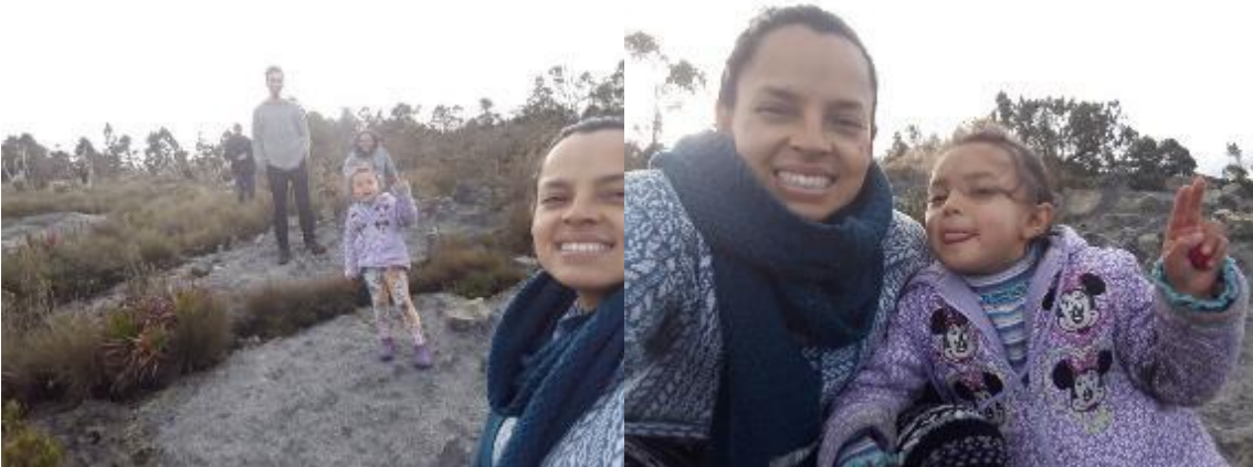
FOTO 13: Agradeciendo lo vivido en el territorio con la nostalgia que generan las despedidas.