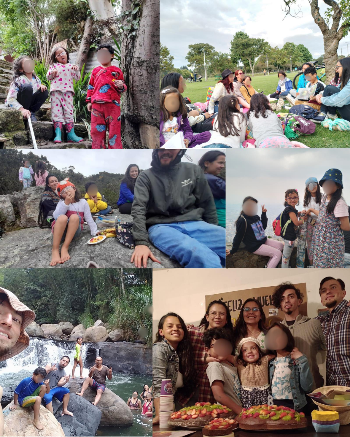
FOTO 55: Tejer lazos de amistad resistentes y duraderos.