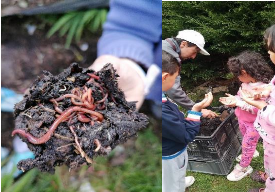
FOTO 12: Coexistir con otros seres de la naturaleza nos enseña lo que es vital.

Con el paso de los meses, nuestros recursos económicos eran más escasos, por lo que no lográbamos pagar el arriendo del apartamento en el que vivíamos, como consecuencia se acabaría el buen trato de alguien con quien teníamos una relación mediada por el dinero. Pronto empezaron a actuar de forma grosera; nos quitaron el acceso al internet por el cual pagábamos y que me era indispensable para estudiar, buscaban el más mínimo pretexto para discutir, nos amenazaron con sacarnos a la calle por deberles dos meses de arriendo, en fin.