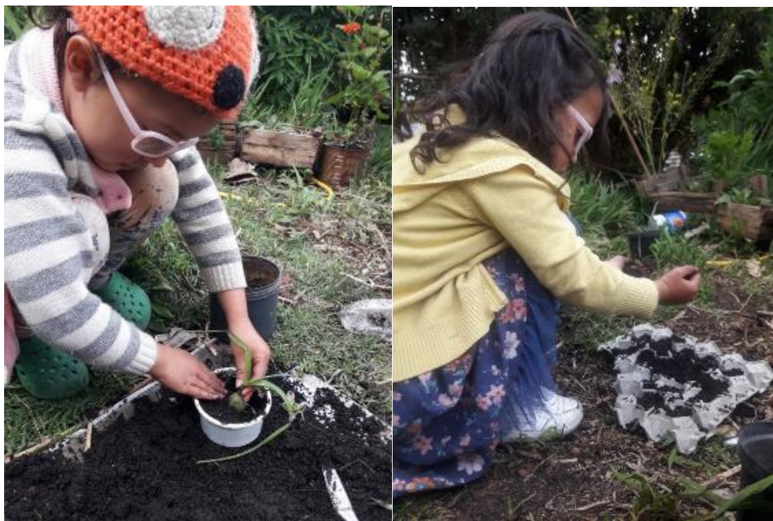
FOTO 22. Sembrando verdes huertas.

Junto con las plantas que fueron y volvieron con nosotres y con otro puñado aún más grande que venían de Tabio, fuimos creciendo, reverdeciendo y tomando