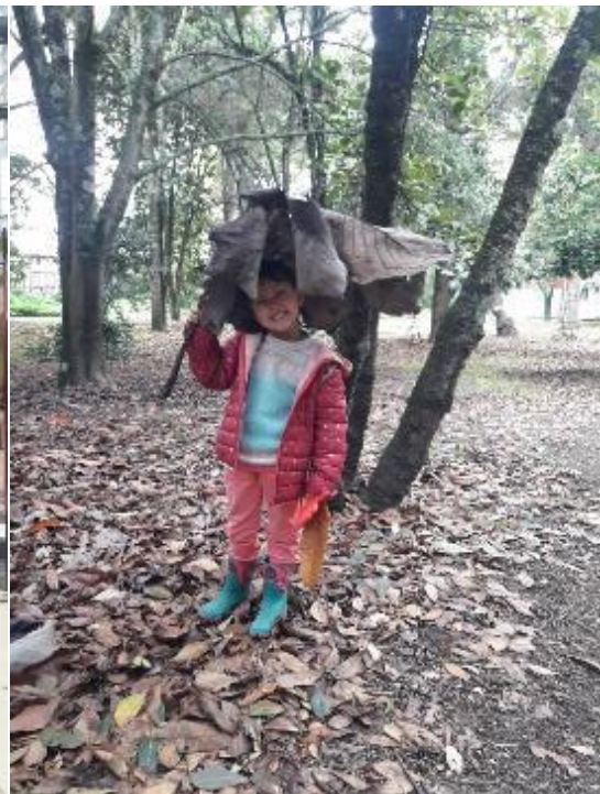
FOTO 31: Aprovechar cualquier espacio para no soltar su mano. Jardín Botánico de Bogotá. 2022