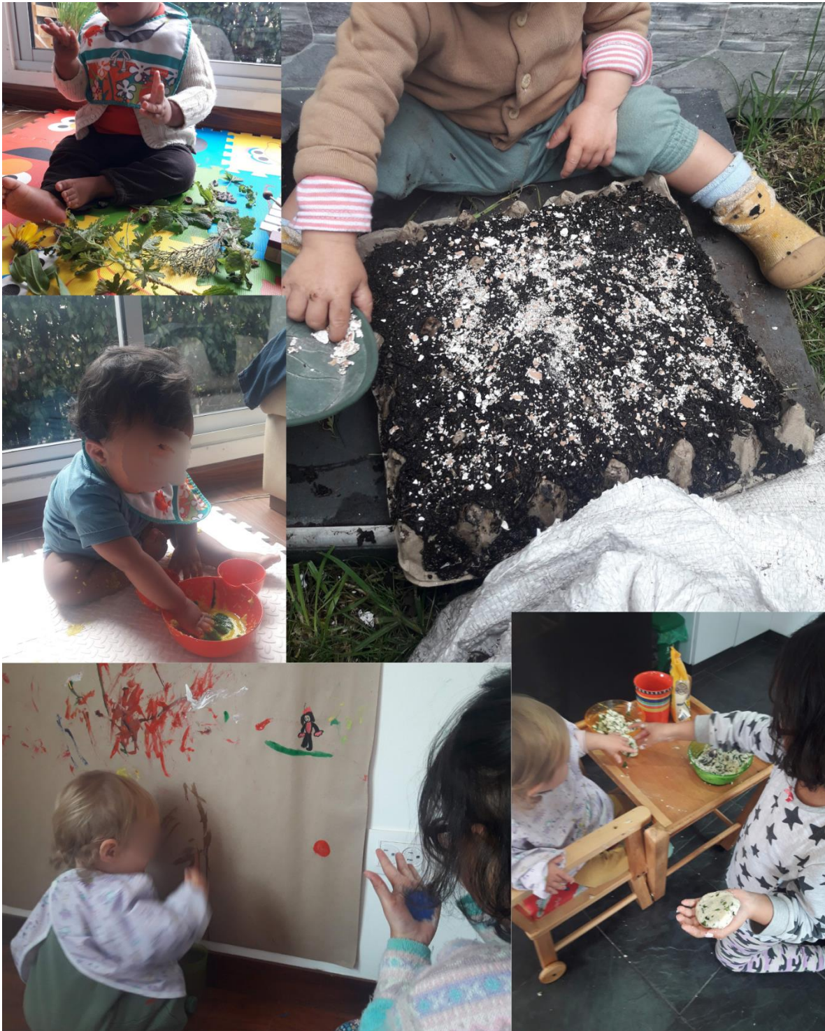
FOTO 53: Trabajar desde el ser madre-maestra con otras infancias.