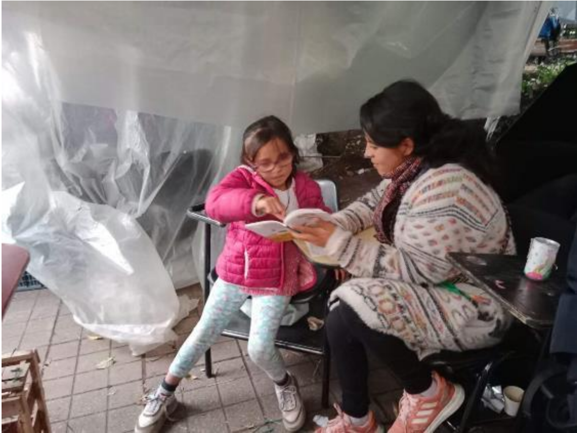
FOTO 49: En la chaza podemos educarnos para la libertad. Archivo personal. 2024

Sin duda este es un escenario bastante significativo para mí, por todo el tejido humanx que se ha construido alrededor de ese espacio, la historia que lo conforma y para este proyecto investigativo en específico, las posibilidades tan enormes que me brinda de estar con mi hija mientras trabajo. El trabajo informal es una opción para quienes decidimos que podemos educarnos de otras formas, es una posibilidad para quienes no encuentran lugar en la poca oferta de trabajo formal, es una herramienta emancipatoria frente a este sistema laboral precario, es una alternativa para quienes priorizamos nuestro mundo de la vida sobre la producción del capital, es una escuela de vida (una buena parte de mi familia es vendedora de ropa).