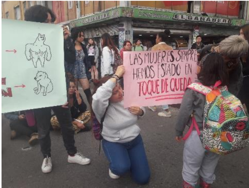
FOTO 47: Protesta en torno a una mujer violada en un Transmilenio. Archivo personal. 2023

Adicional a los espacios académicos, fuimos encontrando otros lugares que habitar, que resonaban con nuestros intereses, tiempos y energías. Entre esos, estaba la sala de lectura de la biblioteca de la UPN, el semillero DERMIS, las plazas y sus malabaristas, lxs amigxs de las chazas, las clases de natación. Cada uno de estos escenarios nos aportaba desde su intención educativa y desde la libertad con la que nos permitían frecuentarles. Por un lado, la sala de lectura con su oferta en literatura infantil tuvo muchas veces nuestras visitas, porque era el espacio perfecto para la lectura, tanto ella como yo podíamos leer lo que deseábamos o hacer alguna otra actividad que me había pensado.