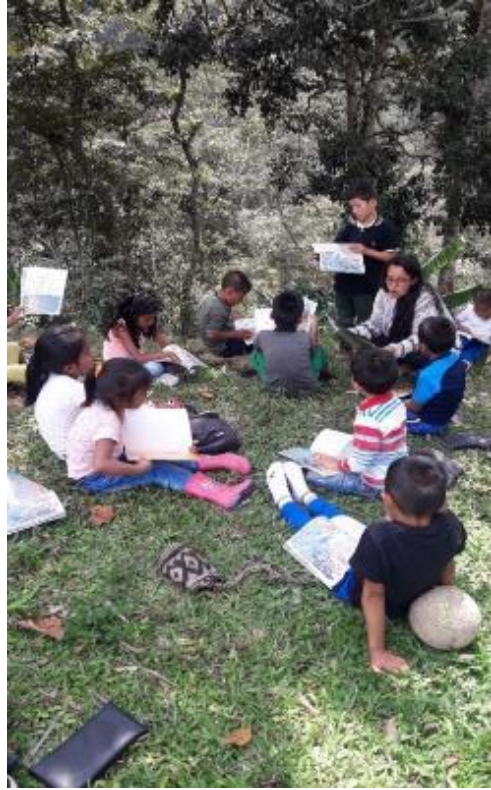
FOTO 19: Aprendiendo a compartir desde la naturaleza que nos habita y los gustos que nos motivan.