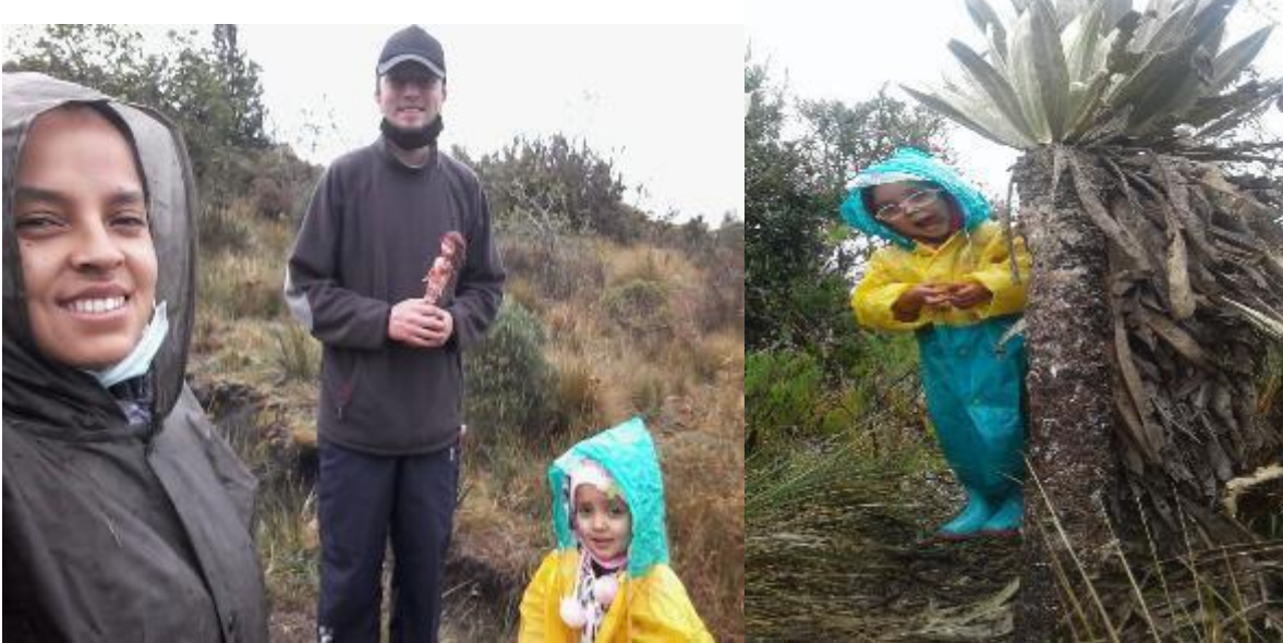
FOTO 10: Respirando hondo y profundo para evitar el contagio.

nuestrxs decisiones, felices de la autonomía que ganábamos con los pasos dados, creyentes firmemente en lxs poderes curativos de las plantas, serenxs en un momento de crisis humanx.