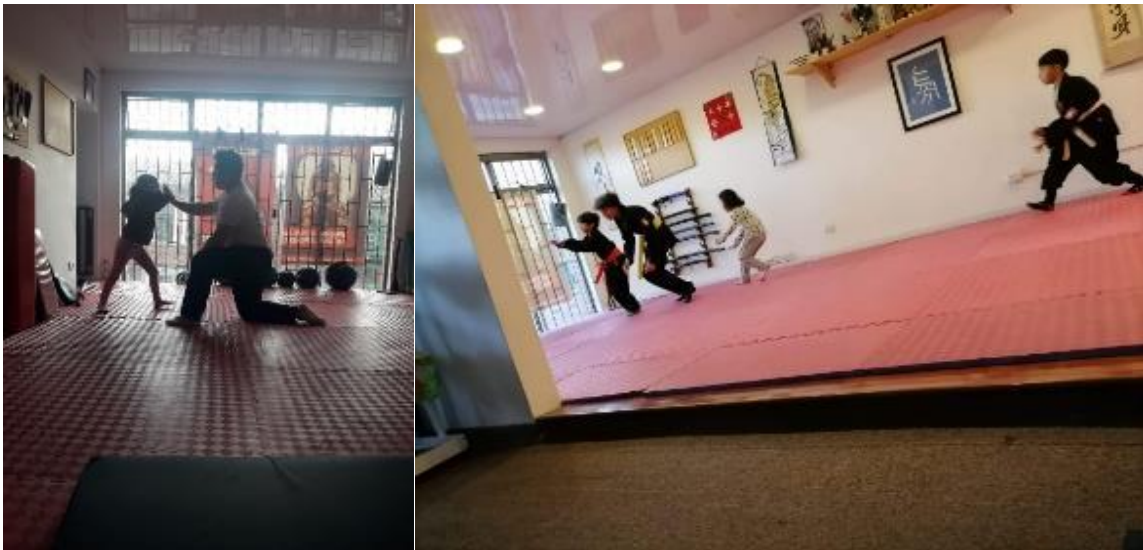
Foto 36: Elena fortaleciendo su cuerpo para aprender a defenderse de este mundo violento.

escucharas tu intuición y le harás caso a tu cuerpo, serás sin miedo porque sabes cuidarte, ahora sabrás lo necesario para moverte con fuerza. No quiero que vivas los miedos sin herramientas, no quiero que sufras las violencias que sufrí, no quiero que nadie vulnere tu fragilidad, quiero creer que sabrás defenderte de la gente mala. Pequeliss (Sierra, 2024)