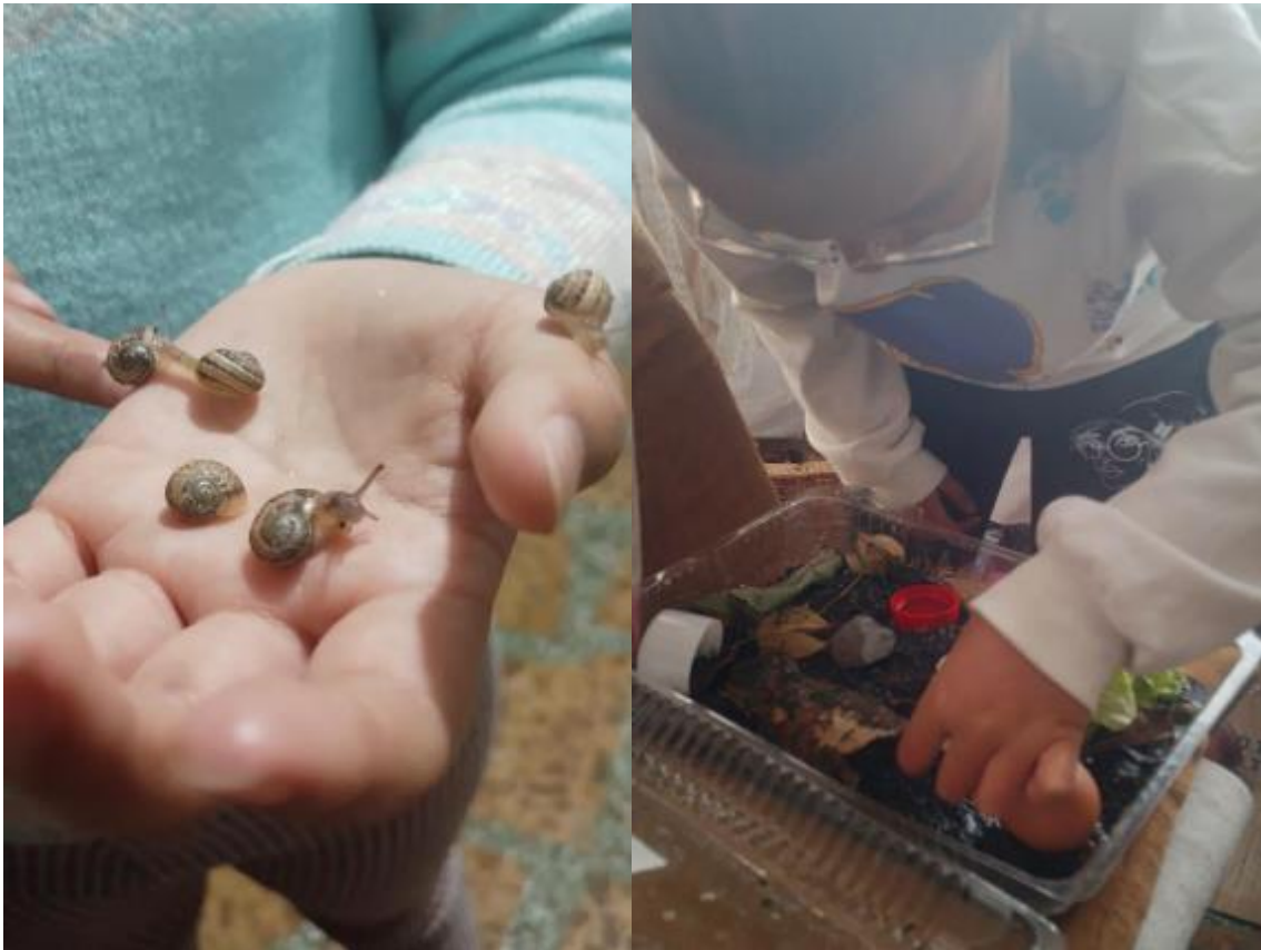
Foto 1: Coexistir con otrxs seres de la naturaleza. 2024

Caminando va Caminando va Caminando va Caminando va Caminando va (Gomez, 2016)