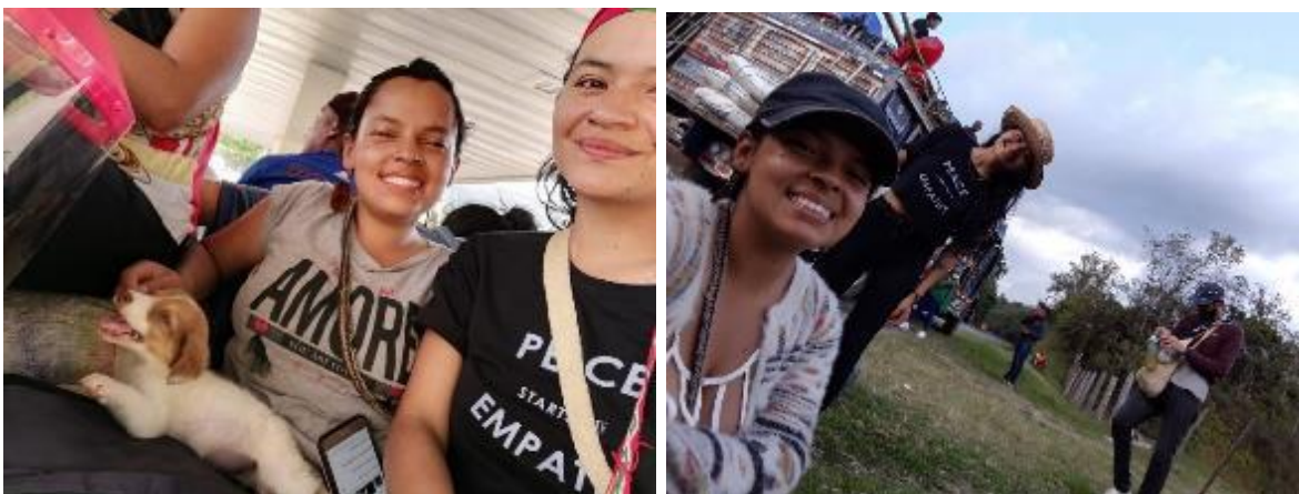
FOTO 16: De Monterilla -Cauca a Cali subidas en la chiva en compañía de mi amor perruna.

Al mismo tiempo, decidía que me acompañaría el resto de mi vida Sek 11 : una cachorra criolla-montañera, la única hembra de una camada de 5 perrxs, que se encontraba en condiciones complejas al igual que su mamá; a la que se le marcaban las costillas mientras amamantaba a lxs 5. Fue inevitable no hacerme cargo de ella, así que continúe el viaje en compañía de una pequeña bola de pelos, a la que bañé y espulgué muy bien con la ayuda de una niña del lugar, antes de subirnos a la chiva para partir hacia Cali, el siguiente lugar que había escogido la Minga Indígena.