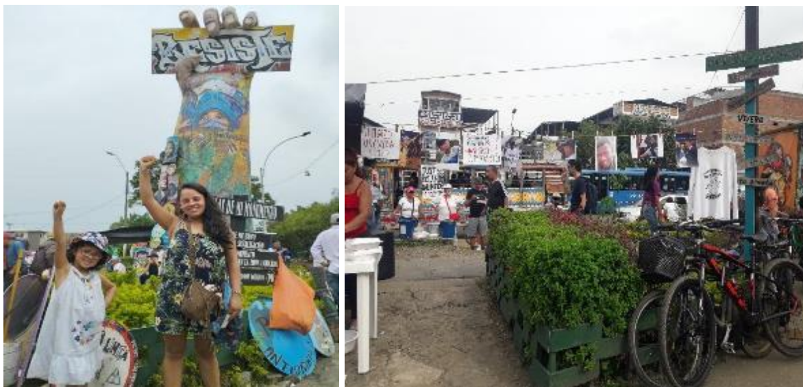
Foto 38: Nuestra primera salida de campo fuera de la ciudad. Puerto Resistencia (PR). 2022