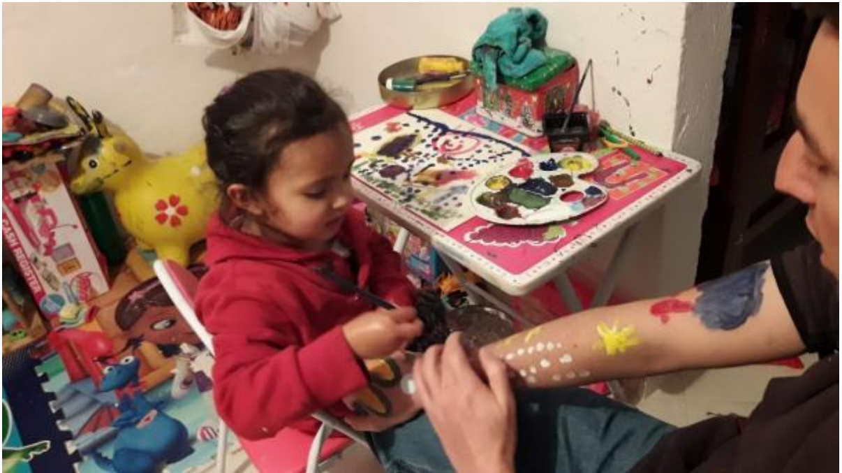
FOTO 9: Pintando la incertidumbre de colores. 2020.

del alimento, a observar las aves que nos visitaban, a tejer... Con el pasar de las primeras semanas y de tener que salir a comprar lo necesario, reclamar el mercado que daba el Programa de Alimentación Escolar (PAE) y tareas indispensables para seguir viviendo. Decidimos aventuramos a hacer lo que “no se debía”, salir a la calle a buscar nuevos caminos, nuevos lugares que recorrer en un territorio de montaña, alejado de la multitud de la ciudad y de las mismas medidas tomadas frente al COVID.