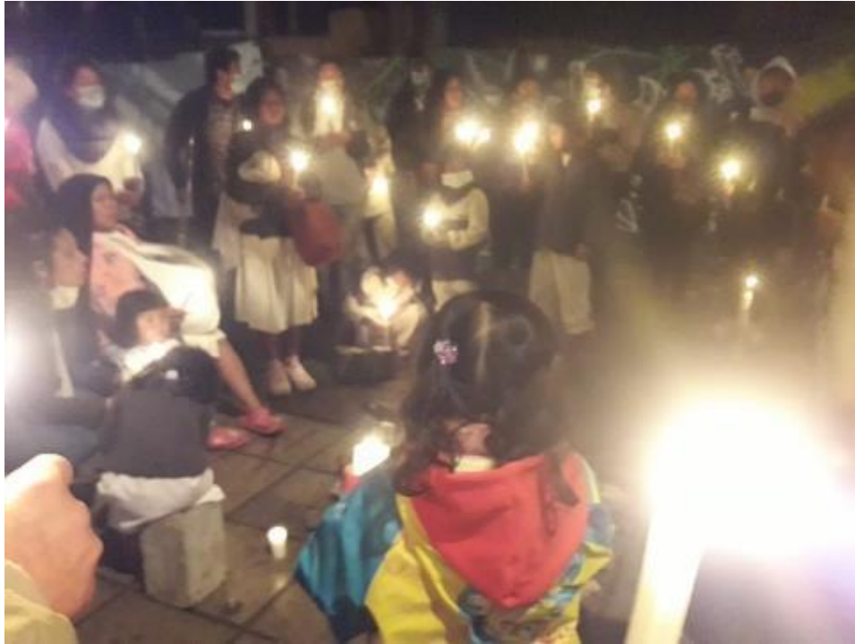
FOTO 25: Apaciguar la violencia con la que el Estado nos atacaba por protestar.

Fue un momento álgido en la historia reciente de Colombia que nos incitaba a actuar en correspondencia a nuestro pensamiento crítico y conciencia de clase. Nos convocaba la olla comunitaria, la concentración en las plazas públicas, la marcha por el barrio, la elaboración de carteles, el canelazo que moja la palabra, el círculo de tejido y toda aquella expresión simbólica que se nos ocurría. Fueron espacios para compartir con mi hija la indignación que como pueblo vivíamos, quería que sintiera el calor de la rabia que dan las injusticias, que se acercara a la protesta de la mano de su familia, era el momento de que viviera estos escenarios de movilización tan importantes para luchar por nuestros derechos.