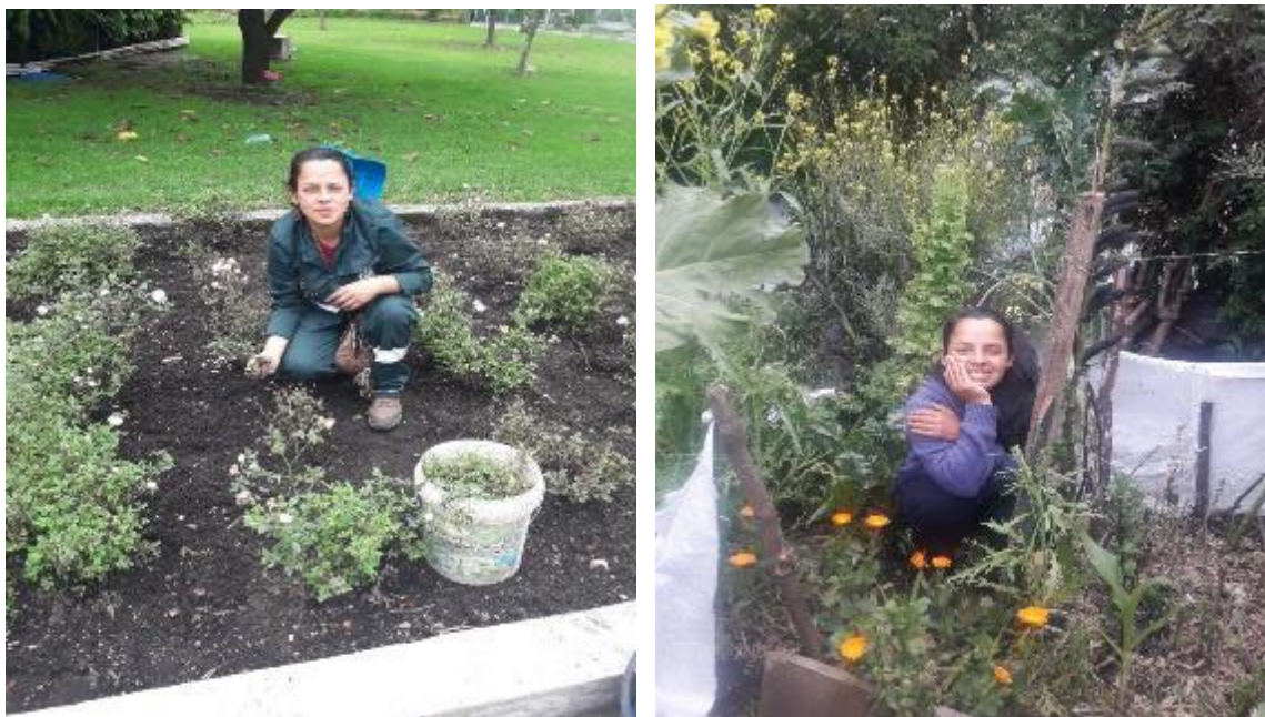
FOTO 32: Realizando labores culturales en el Jardín Botánico. FloreSiendo con nuestra huerta.

Ver y escuchar a mis compañeras conversar alrededor del cuidado: de las plantas, de sus hijxs, de sus familias, de sus animales, de sus casas, me hacía pensar en cómo esa labor tan importante ha recaído sobre nosotras, quienes priorizando el cuidado hacia otros dejaron de lado sus sueños y hasta su propio autocuidado, cosa que no me sucedió a mí por tener el privilegio de estudiar en una universidad pública en la que está presente el pensamiento crítico.