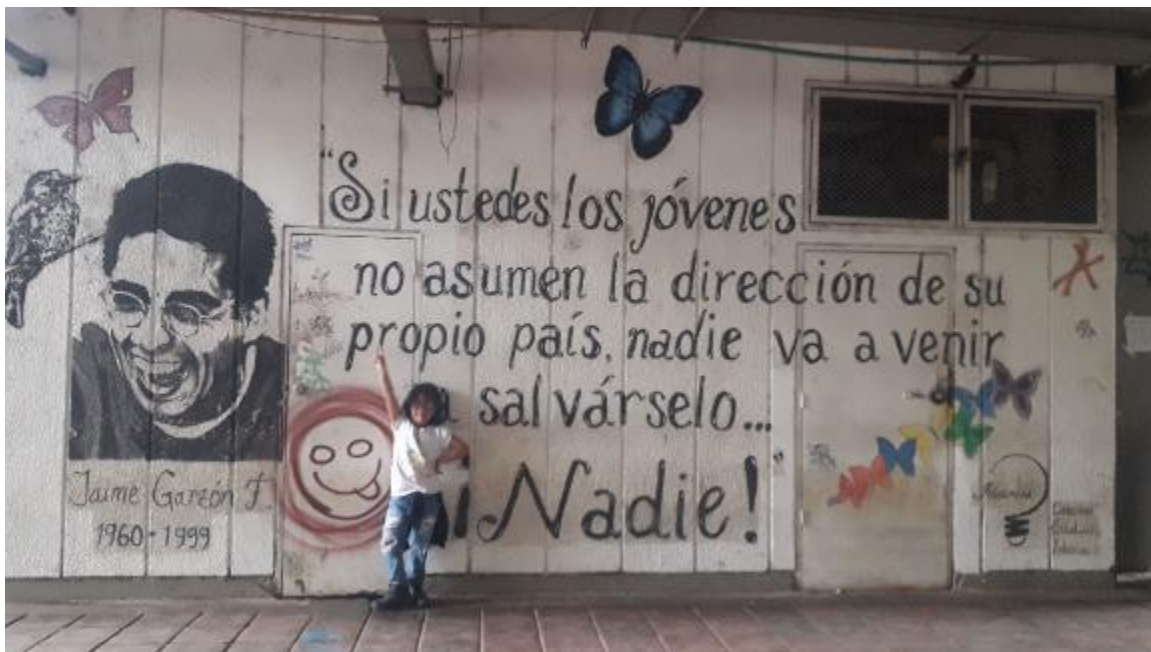
FOTO 39: Amamos la biodiversidad con la que nos encontramos dentro de la Univalle.