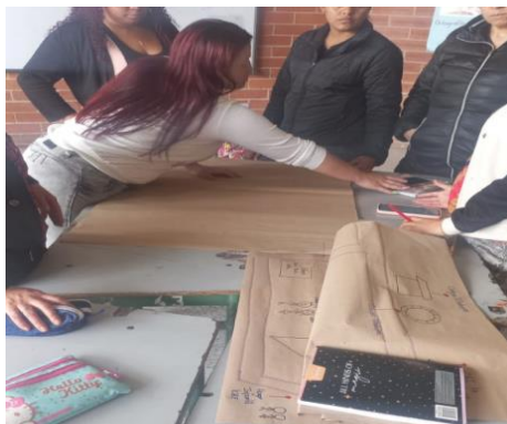
Ilustración 9 - Practica

manera en una sesión posterior, presentaron su trabajo y desarrollaron la problemática que habían observado, proponiendo soluciones posibles.