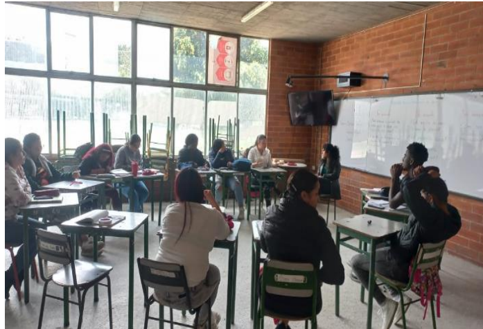
Ilustración 6 - Socialización tras el recorrido urbano.

barrio? Esto nos permitió crear un espacio de socialización y entender mejor su perspectiva sobre el barrio.