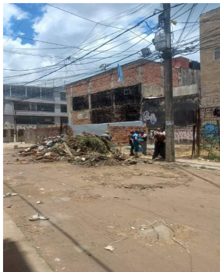
Ilustración 5 - Recorrido urbano

derechos, situaciones de desesperanza e incluso pérdidas de familiares; a final de la sesión y aunque no estaba explícito en las instrucciones de la actividad, los estudiantes resaltaron las causas migratorias que habían evidenciado en las historias de sus compañeros.