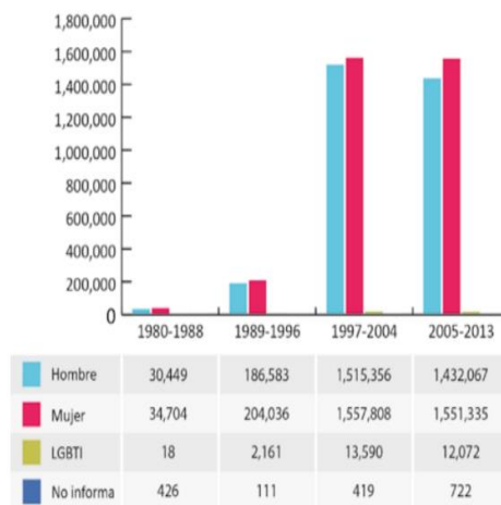
Gráfica 23. Evolución histórica de las víctimas de desplazamiento, desagregada por género (1980-2014)

Fuente: RUV – UARIV, con corte a 31 de diciembre de 2014.