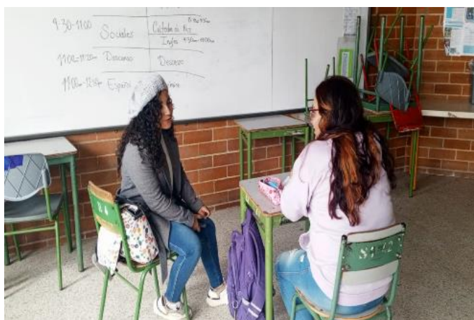
Ilustración 2 - Estudiante escuela Hekima.

“Nosotros somos siete hermanos y mi papá murió cuando yo tenía once años, entonces a los mayores nos trajeron aquí a trabajar en casas de familia, como internas para mantener a mi mamá y a nuestros hermanos menores, y hoy en día sigo trabajando con esa familia, pero ya no de interna. Ellos son los que me dan permiso el sábado para faltar y venir aquí a estudiar” (Diario de Campo, 2025).