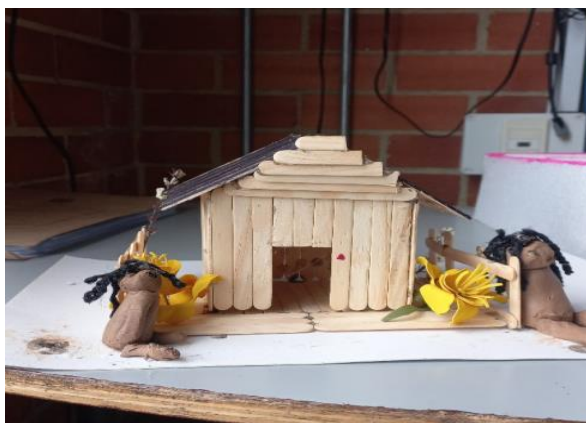
Ilustración 4 - Maqueta realizada por estudiante de ciclo 5 al abordar el concepto de Territorio.

“El territorio es donde yo esté, a mí no me importa si es aquí o allá, el territorio soy yo, es mi cuerpo. Y mi territorio es ideal desde que esté en compañía de mi hija, no importa si es en Buenaventura o aquí. Yo misma soy mi territorio” Estudiante Escuela Hekima (Diario de campo, 2025).