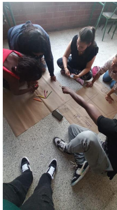
Ilustración 8 - Ejercicio de cartografía

Nota: Recorrido urbano realizado para ampliar el concepto de Ciudadanía y participación política.