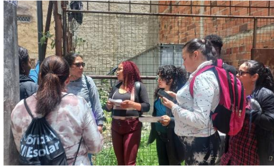
Ilustración 7 - Recorrido urbano 2