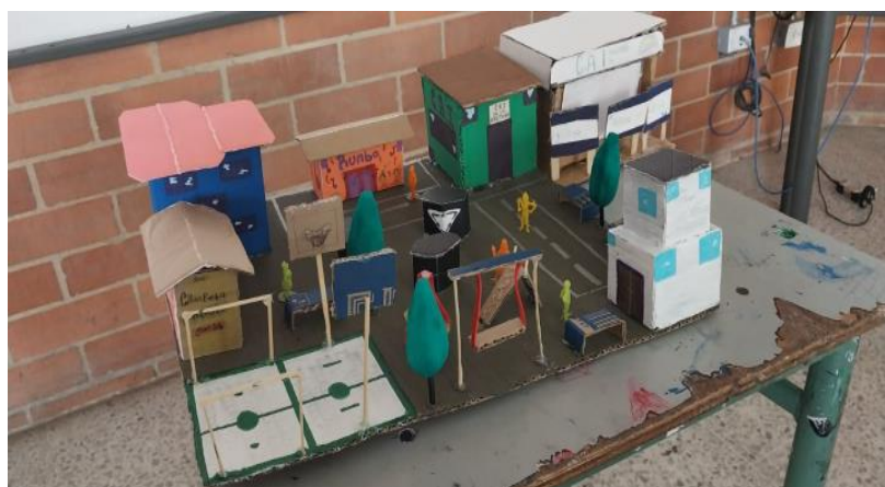
Ilustración 10 - Maqueta propuesta

Otro producto desarrollado por iniciativa de los estudiantes fue una maqueta que presentaba el barrio que recorrimos y las problemáticas que se habían identificado con el fin de presentarla a los vecinos y poder buscar soluciones, así como lo hacían los vecinos de Lilia (Diario de campo, 2025).