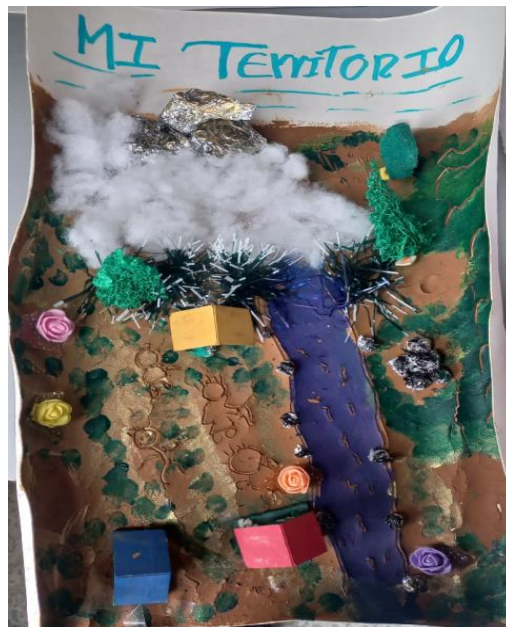
Ilustración 3 - Maqueta realizada por estudiante de ciclo 5 al abordar el concepto de Territorio.