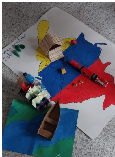
Ilustración 4 - Cartografía en relieve