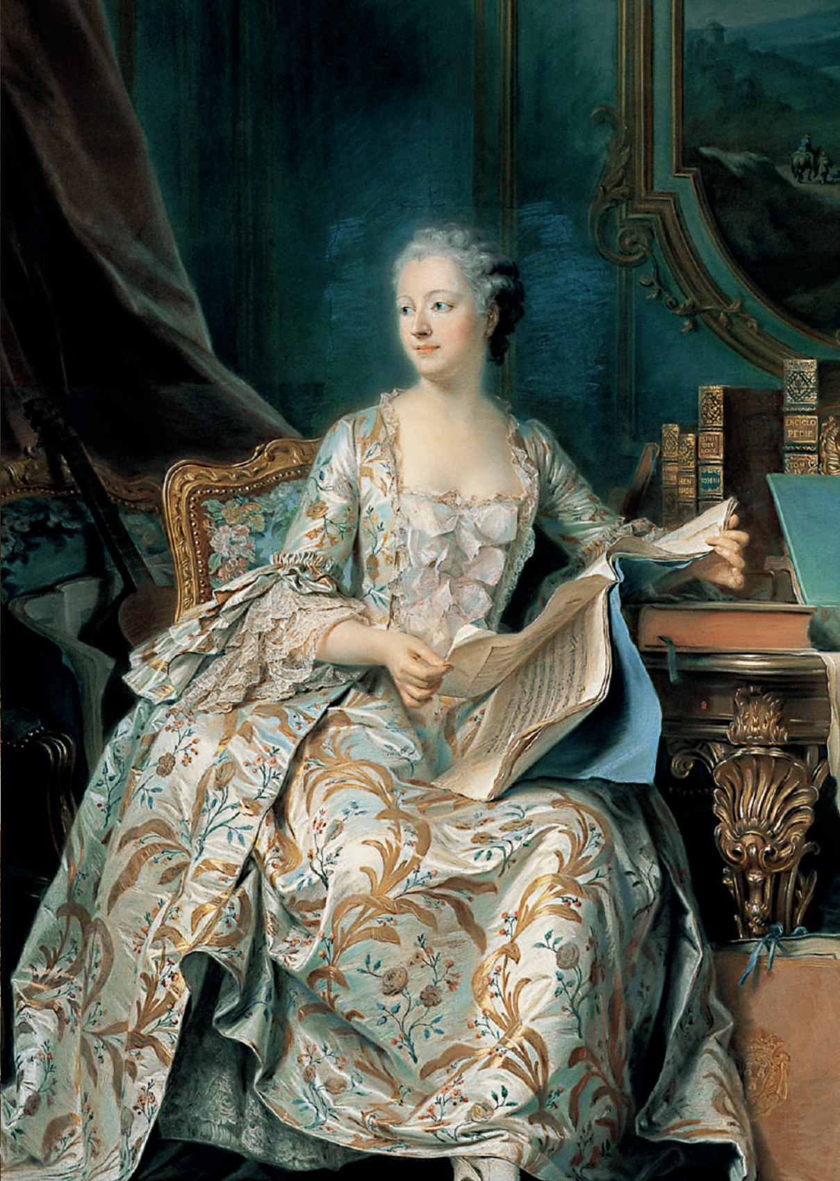
Madame de Pompadour en su estudio , de Maurice Quentin de La Tour, < 1755.