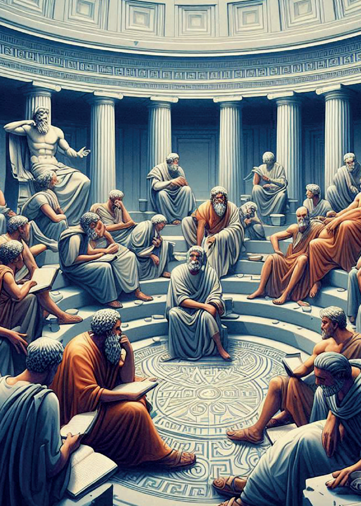
Representación de un lesche en la antigua Grecia. Imagen generada por el autor con Microsoft Copilot.