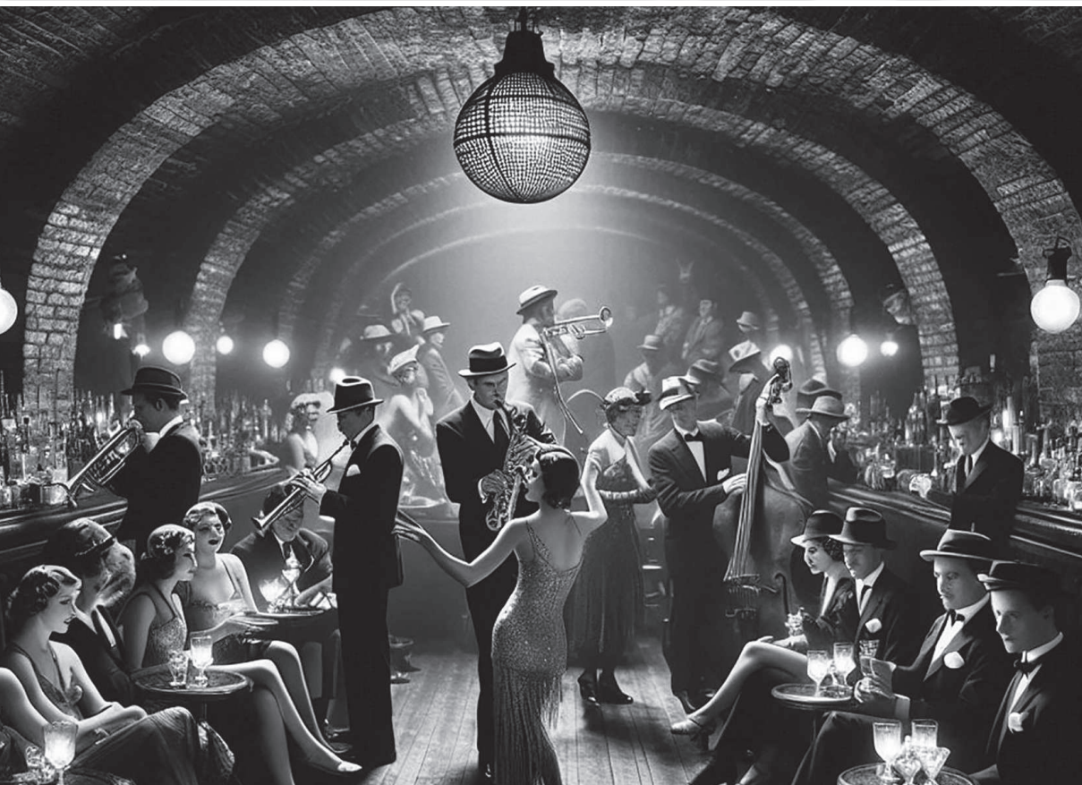
Speakeasy durante la Prohibición en los años 30 en los Estados Unidos.