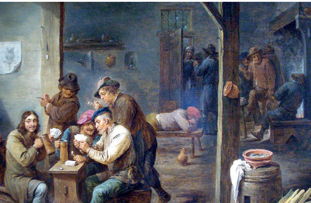
Escena de taberna del artista flamenco, de David Teniers, 1658. Tomado de Archivo: Escena de taberna-1658-David Teniers II.jpg. https://en.wikipedia.org/wiki/Tavern# . Dominio público.