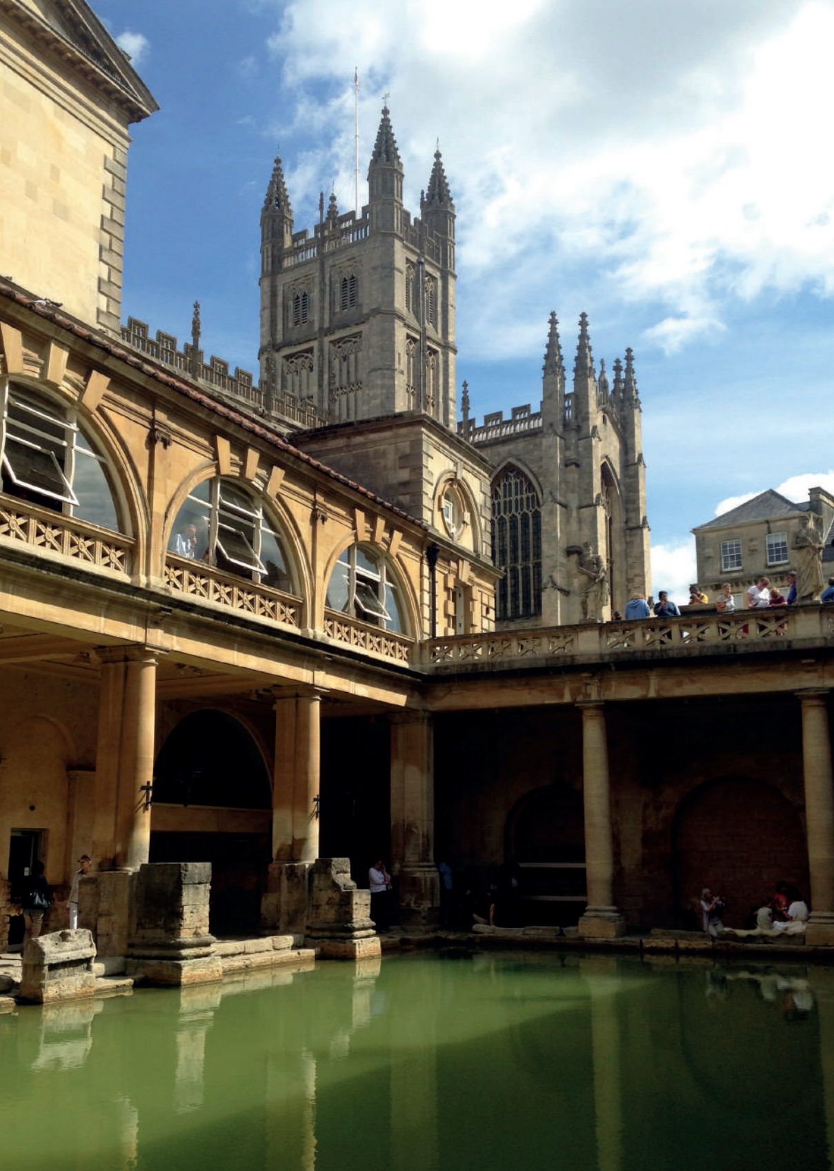
Baños romanos [fotografía] por Luis Alfonso Escudero, 2013. Tomado de Archivo: Baños Romanos de Bath (3).jpg, https://shorturl.at/ZaWPK . CC BY-SA 3.0.