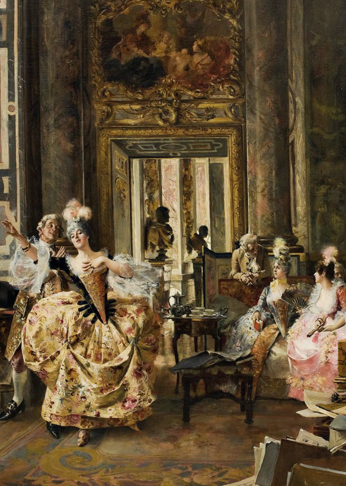
Un concierto en Versailles , de François Flameng, < 1923. Tomado de Archivo: Un-concert-a-versailles - François Flameng.jpg. https://shorturl.at/7IjF . Dominio público.