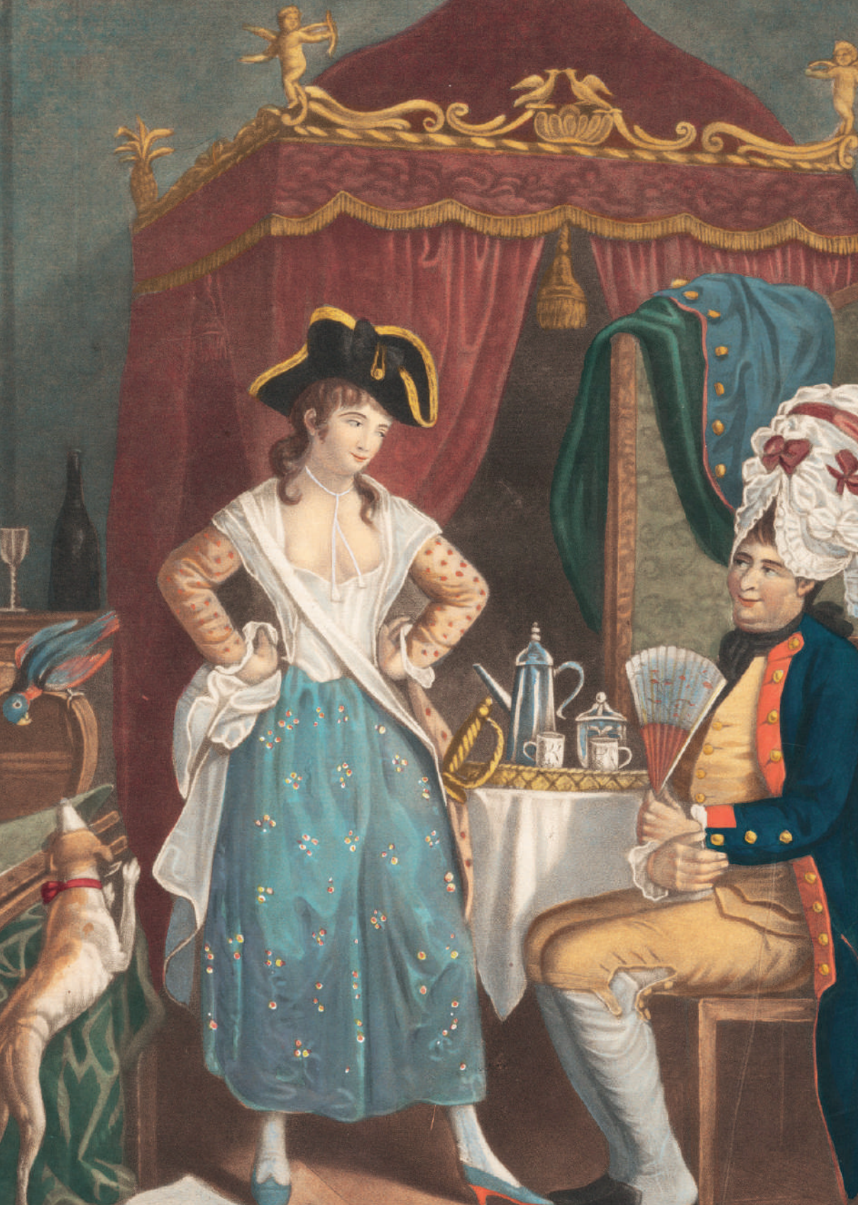
Un juego matutino o la transmutación de los sexos, de Juan Collett, < 1780.