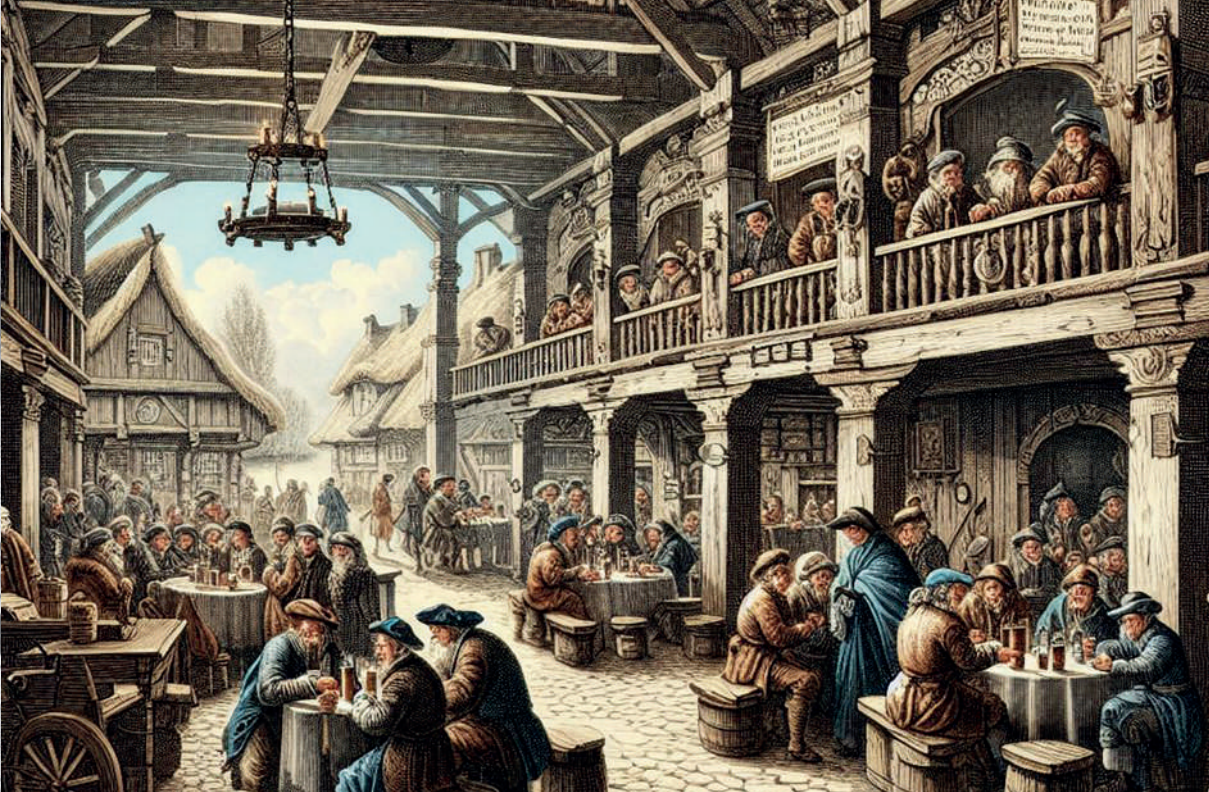
Taberna en Europa, siglo XVII. Imagen generada por el autor con Microsoft Copilot.