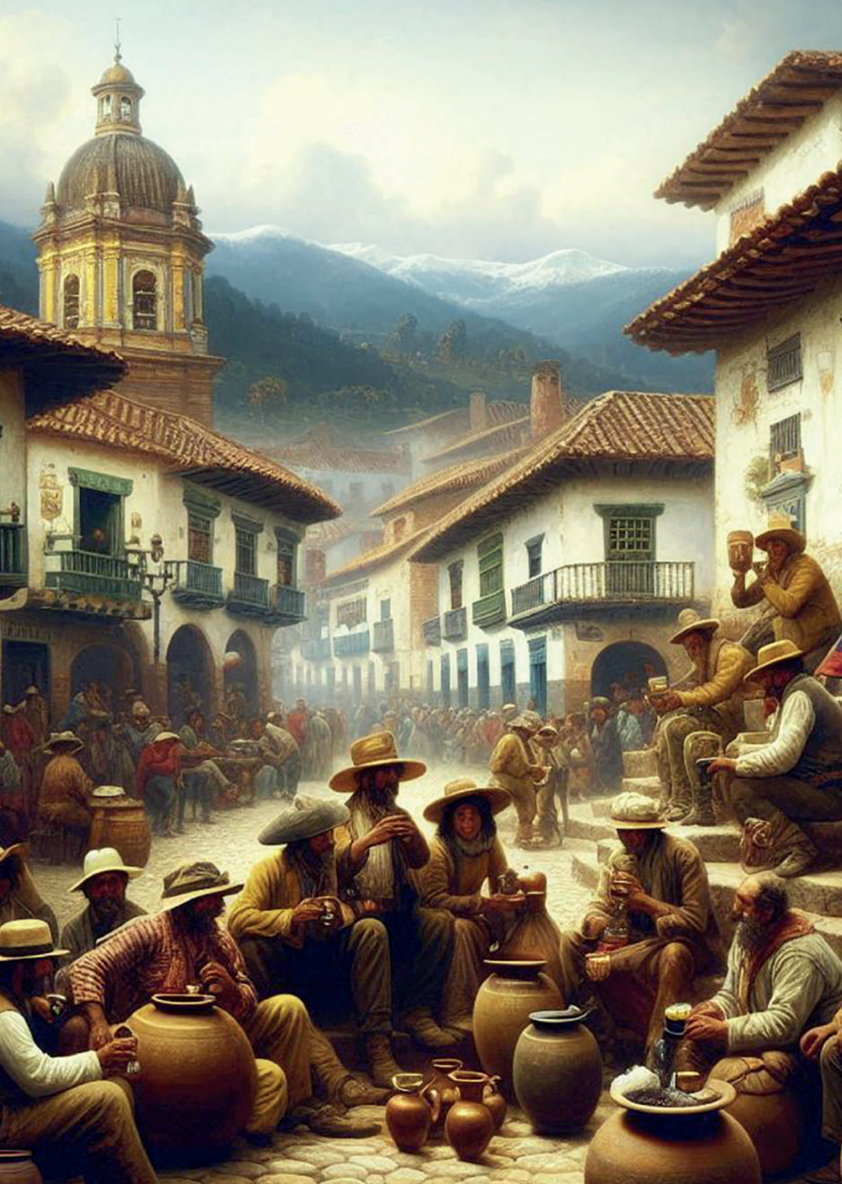
Representación de una chichería en Santafé de Bogotá. Imagen generada por el autor con Microsoft Copilot.