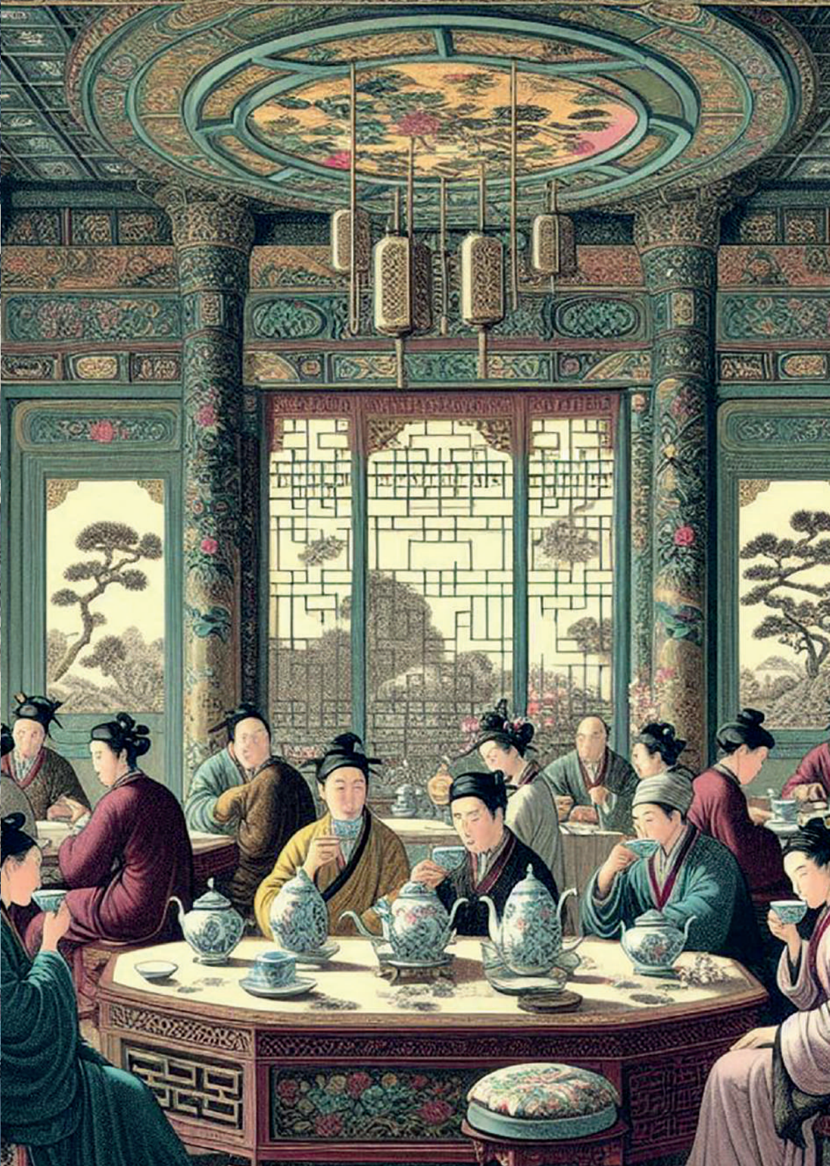
Salón de té en China, siglo XVIII. Imagen generada por el autor con Microsoft Copilot.