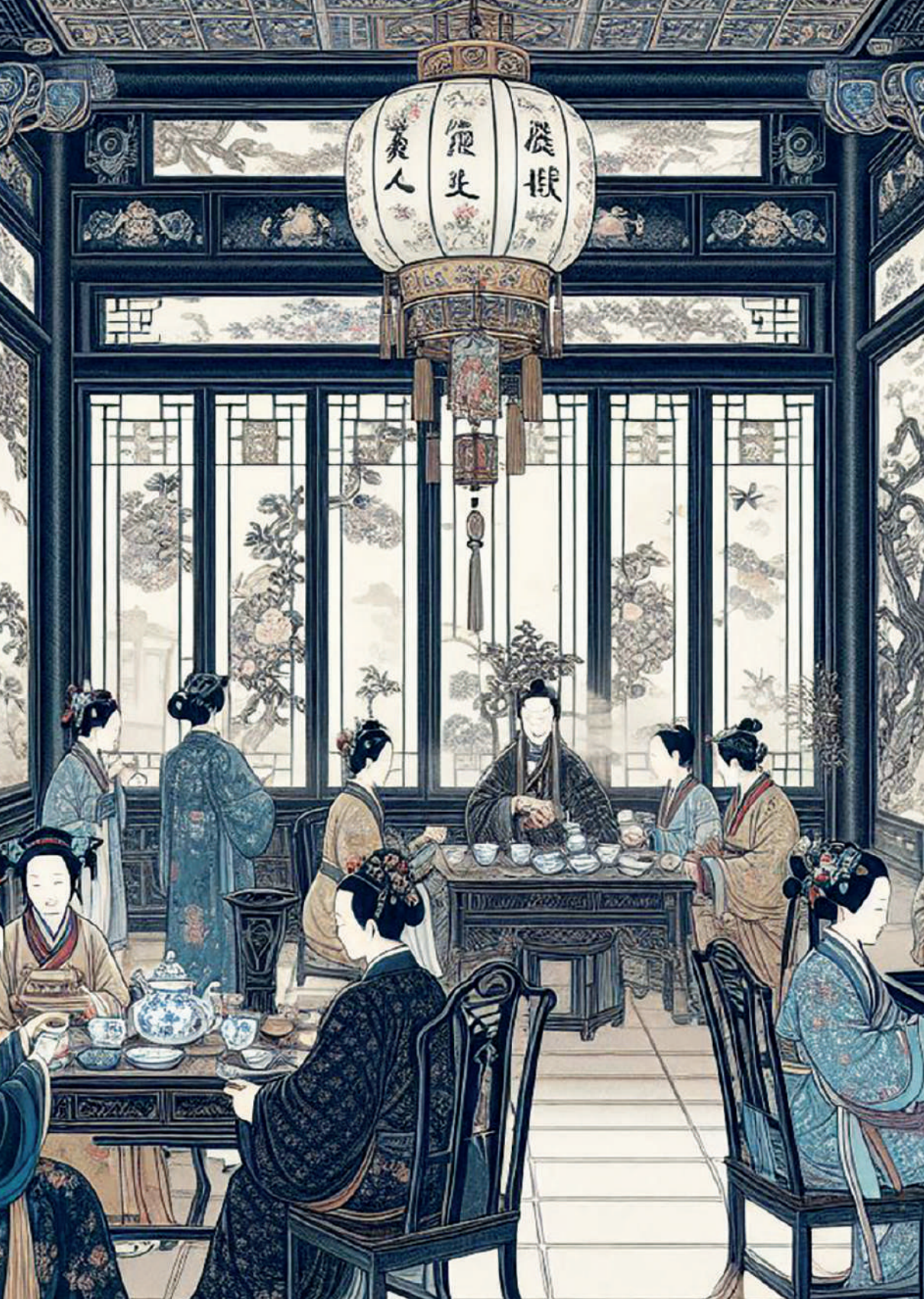
Salón de té en China, siglo XVIII. Imagen generada por el autor con Microsoft Copilot.