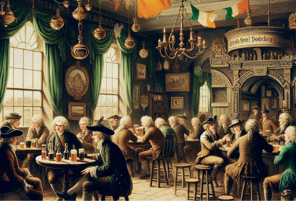
Pub irlandés del siglo XVIII. Imagen generada por el autor con Microsoft Copilot.