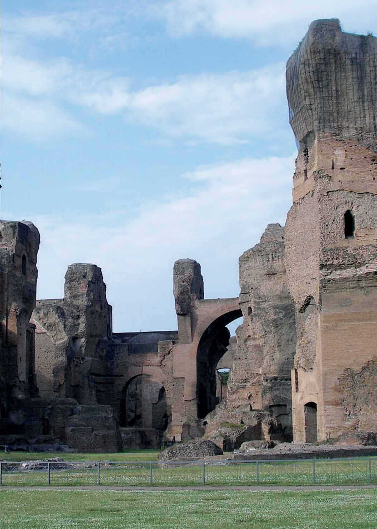
Vista parcial de las ruinas de las Termas de Caracalla en Roma [fotografía] por Viacheslav Argenberg, 2006. Tomado de Archivo: Roma, Italia, Termas de Caracalla.jpg. https://shorturl.at/RaUTc . CC BY 4.0.