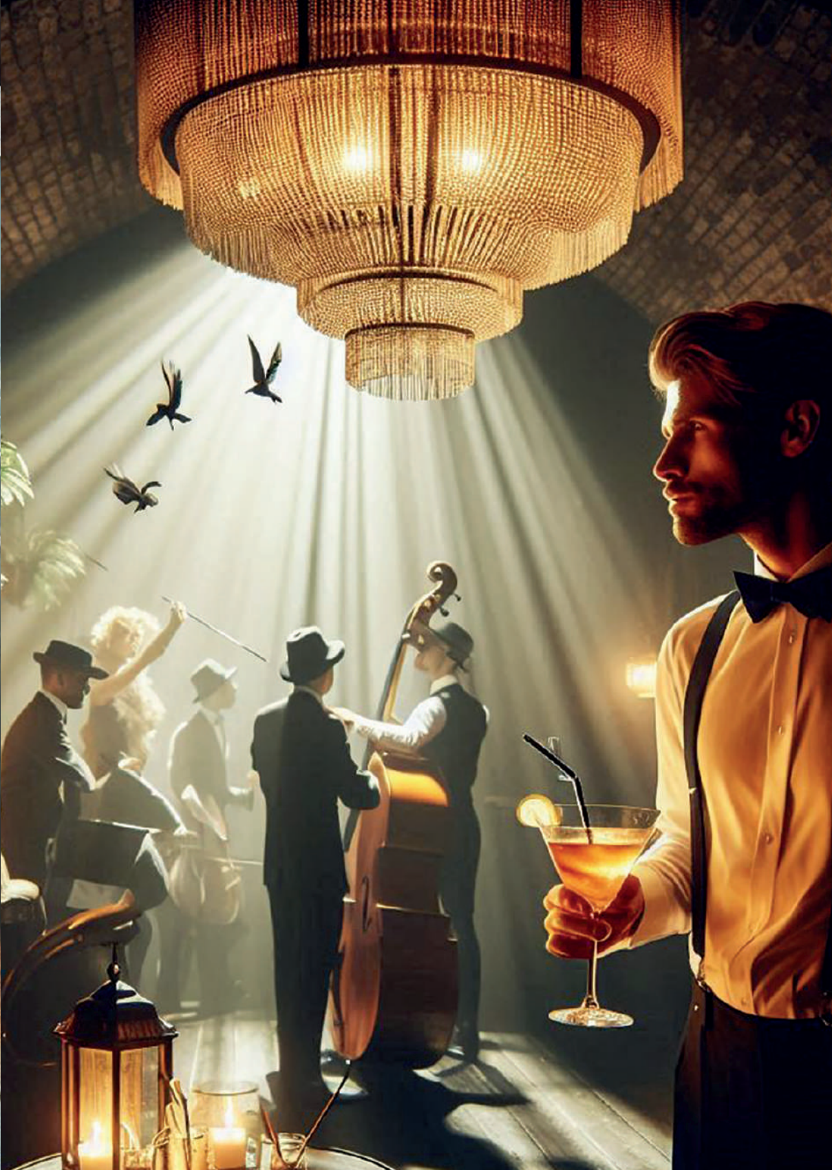
Speakeasy durante la Prohibición en los años 30 en los Estados Unidos. Imagen generada por el autor con Microsoft Copilot.