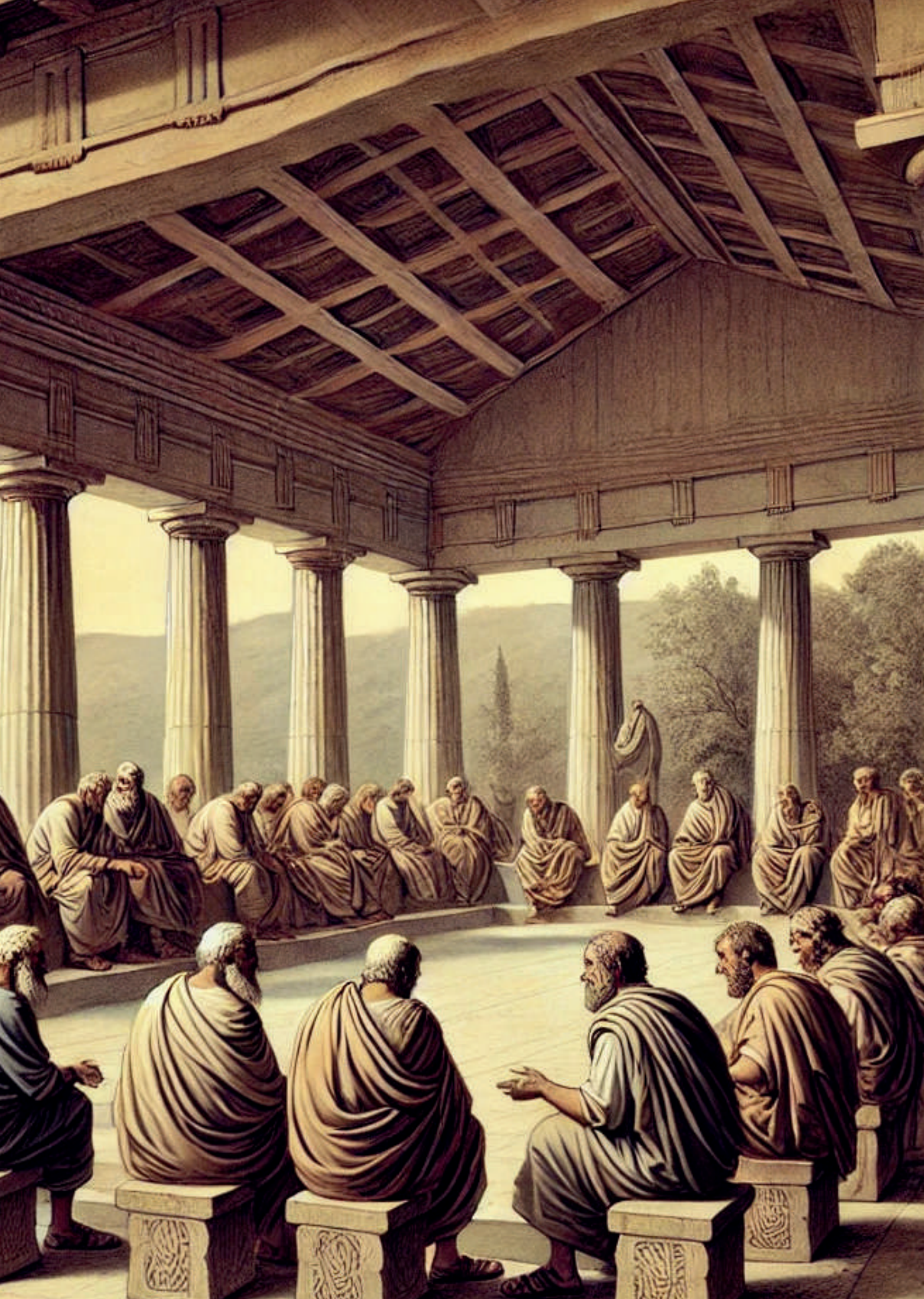
Representación de un lesche en la antigua Grecia.