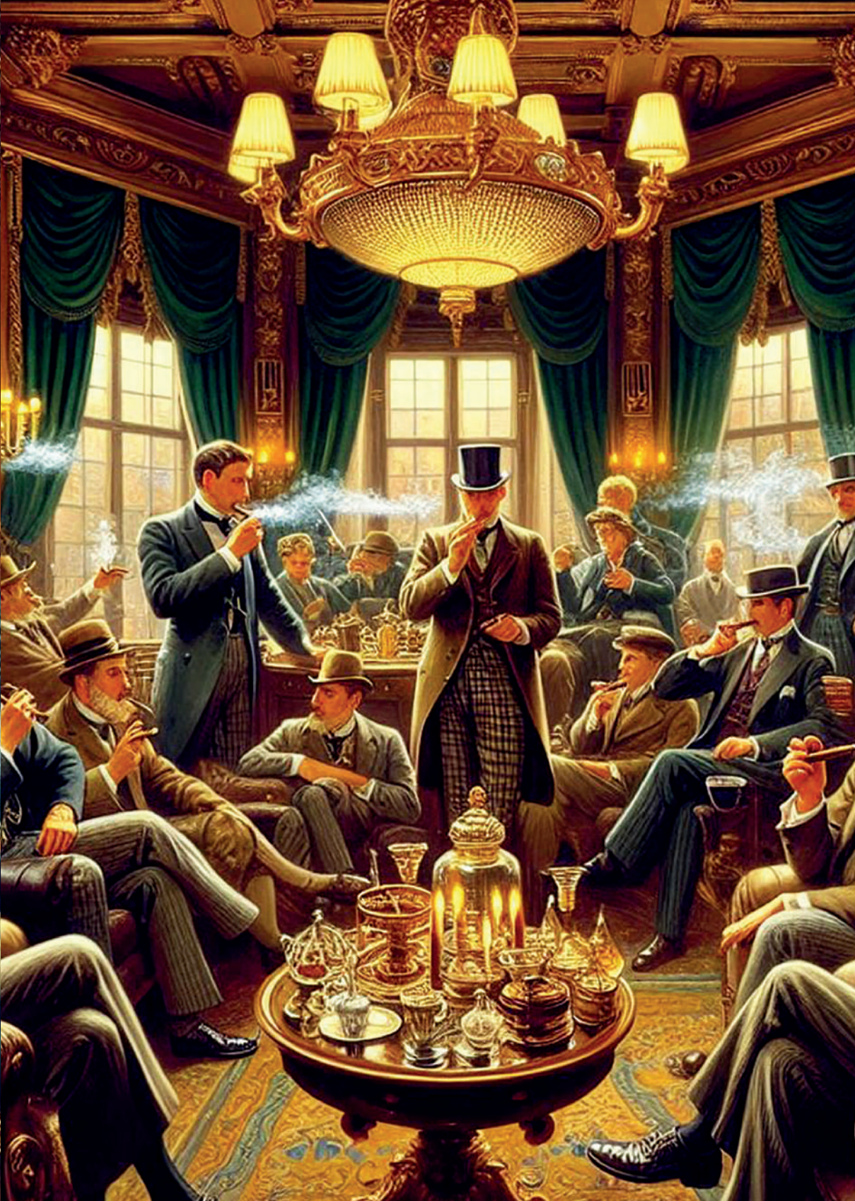
Salón de fumadores en Inglaterra, siglo XIX. Imagen generada por el autor con Microsoft Copilot.