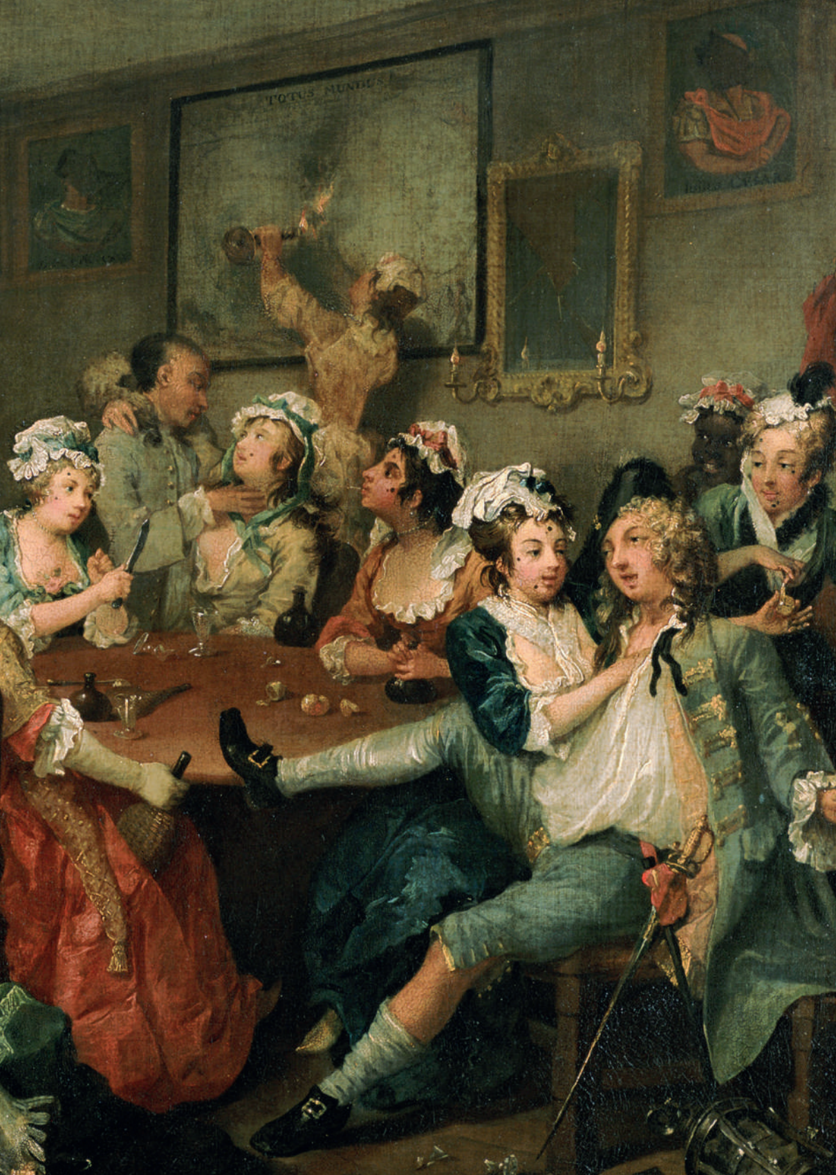
La escena del burdel de El progreso del libertino , de William Hogarth, 1735.