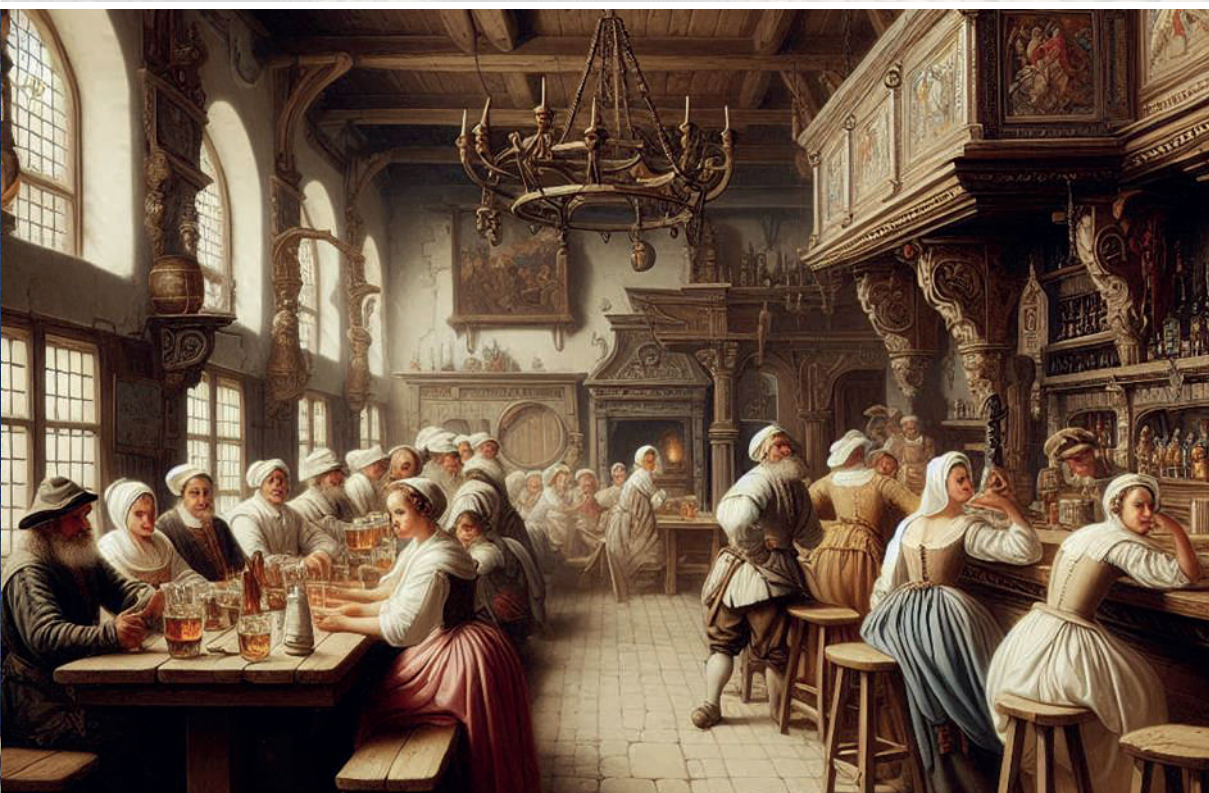
Taberna en Europa, siglo XVII. Imagen generada por el autor con Microsoft Copilot.