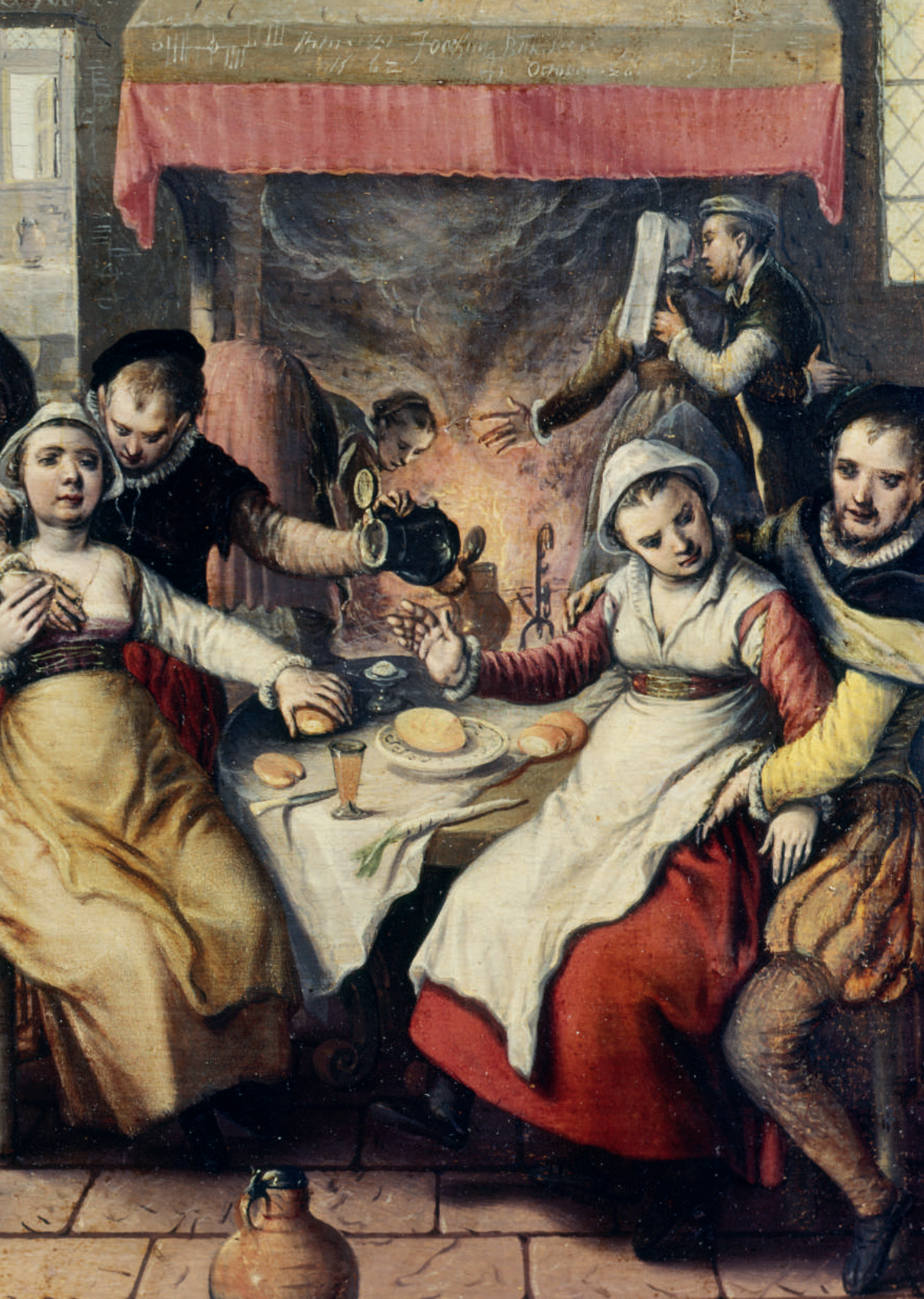
Burdel, de Joachim Beuckelaer, 1562. Tomado de Archivo: Joachim Beuckelaer - Brothel - Walters 371784.jpg. https://shorturl.at/1Pujs . Dominio público.