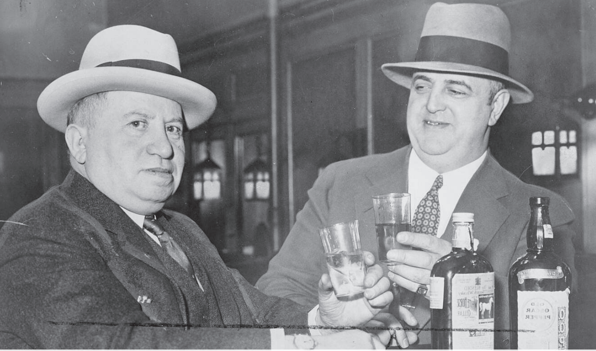
Izzy Einstein y Moe Smith , ex policías durante la Prohibición, compartiendo un brindis en un bar de Nueva York, de Fotógrafo del personal de World Telegram, 1935. Tomada de https://shorturl.at/dpwjy . Dominio público.