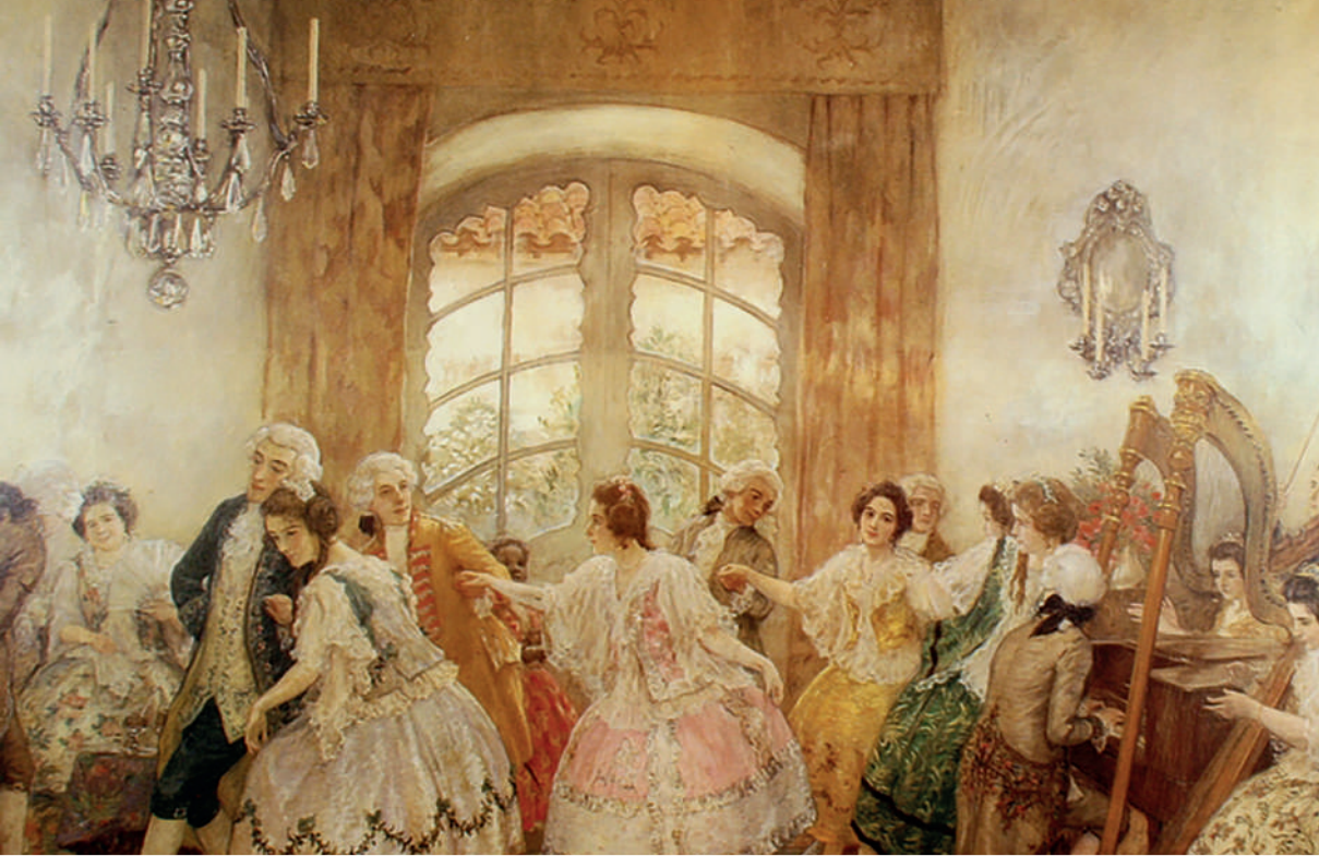
Baile de salón antiguo , de Pedro Subercaseaux, 1917. Tomado de Biblioteca Nacional de Chile. https://www.memoriachilena.gob.cl/602/w3-article-85083.html . Dominio público.