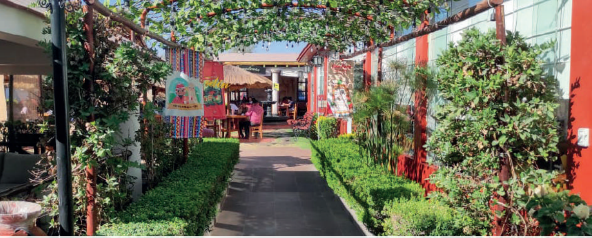
Picantería en Arequipa, Perú, [fotografía] por John Jairo Gómez (2024).