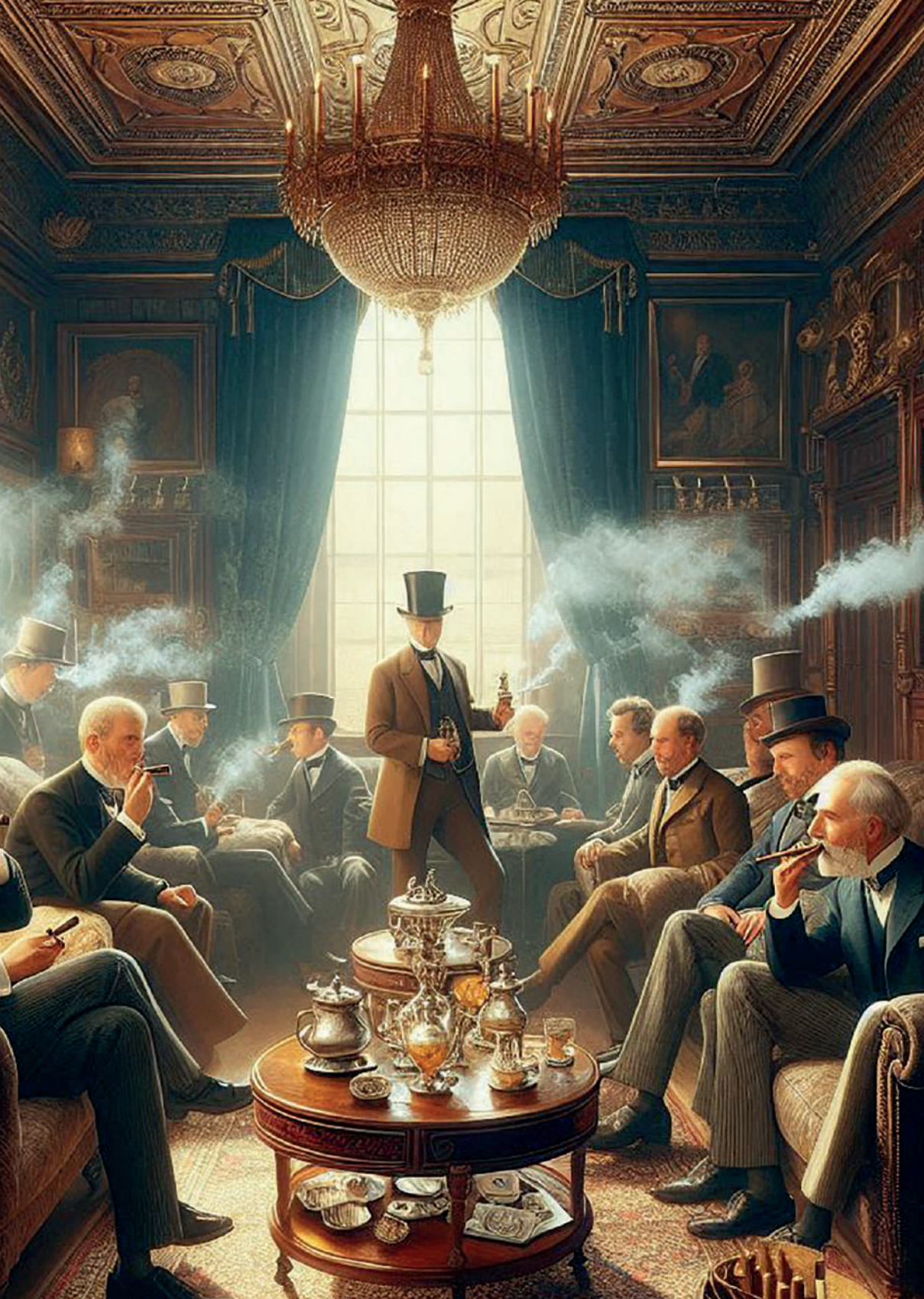
Salón de fumadores en Inglaterra, siglo XIX. Imagen generada por el autor con Microsoft Copilot.