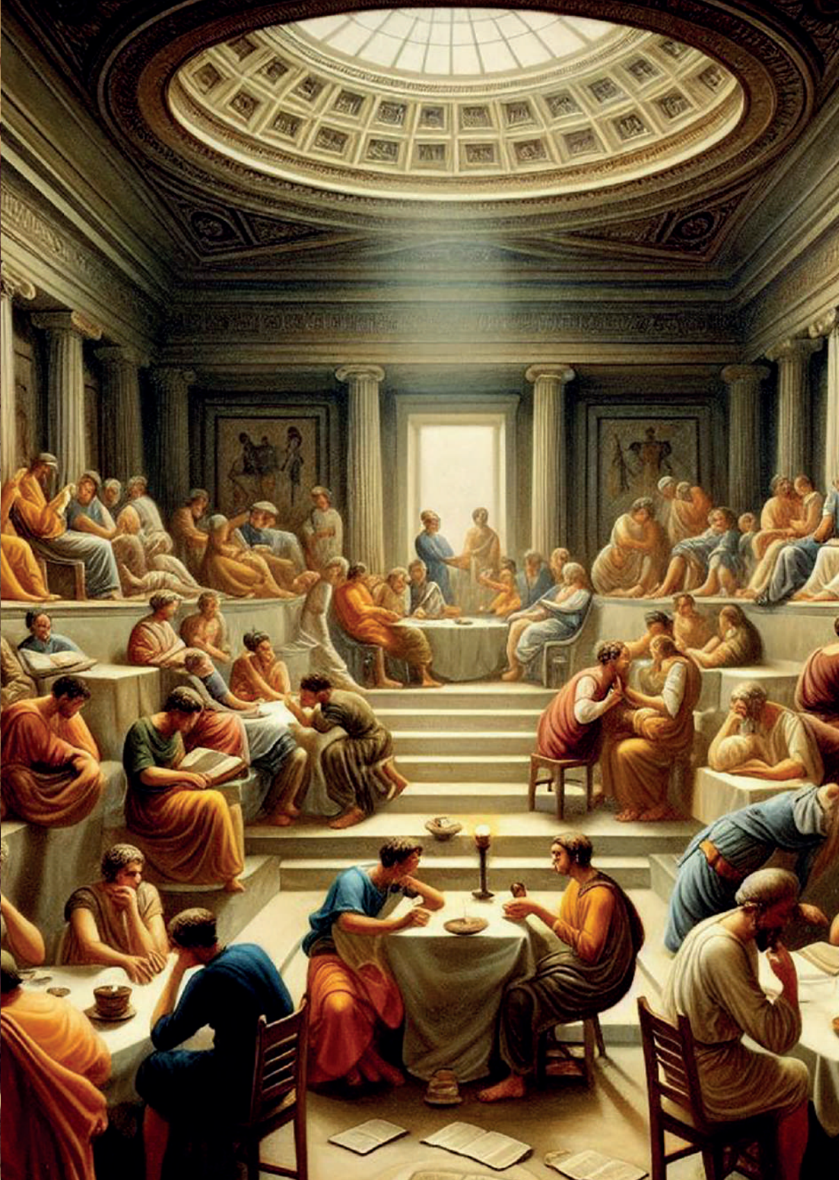
Representación de un lesche en la antigua Grecia. Imagen generada por el autor con Microsoft Copilot.