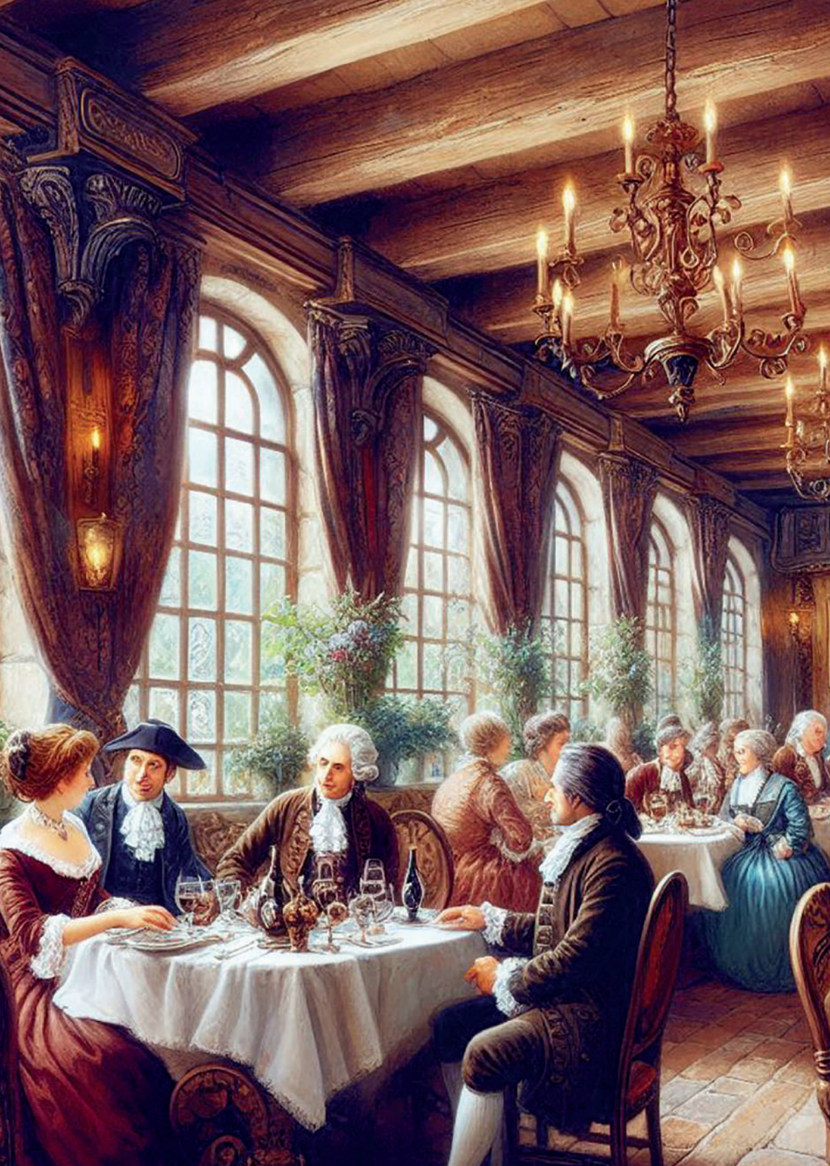
Restaurante francés del siglo XVIII. Imagen generada por el autor con Microsoft Copilot.