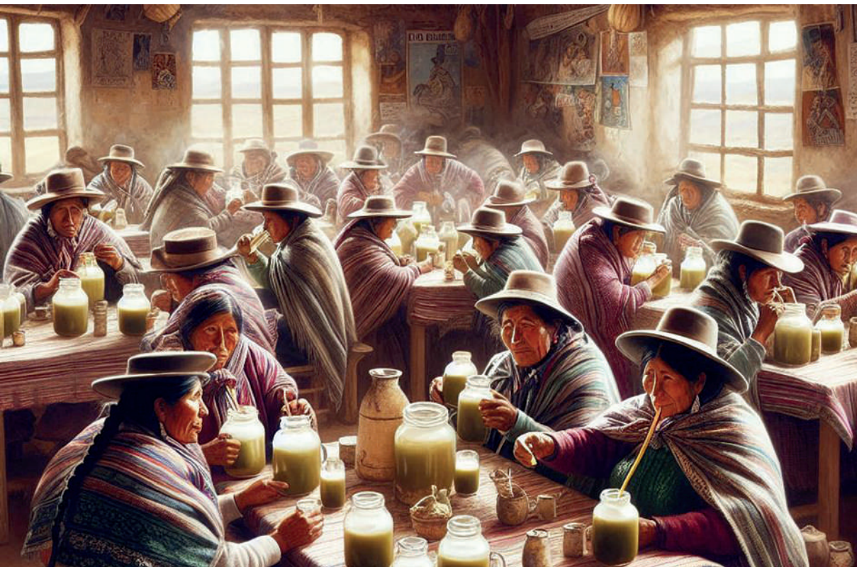
Representación de una chichería peruana. Imagen generada por el autor con Micosrosoft Copilot.