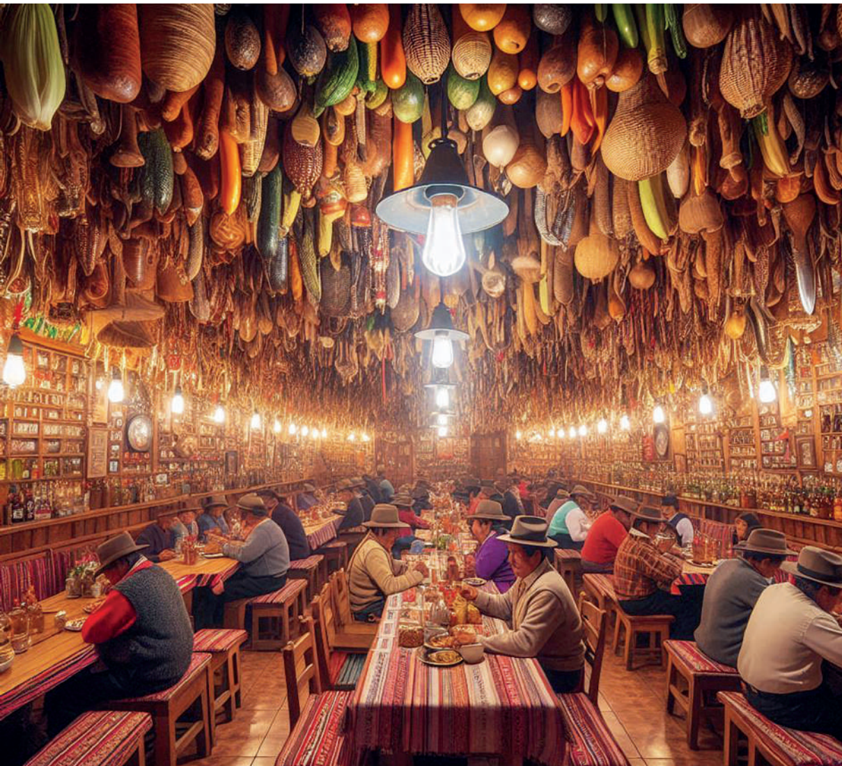
Interior de una picantería tradicional peruana.