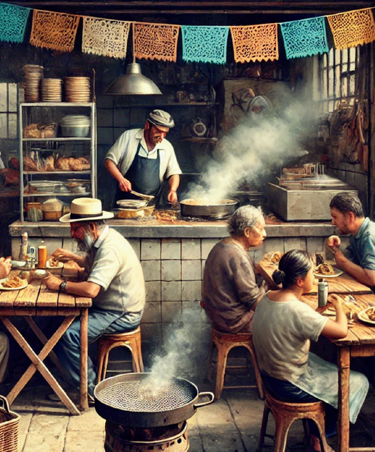
Taquería tradicional mexicana. Imagen generada por el autor con Microsoft Copilot.