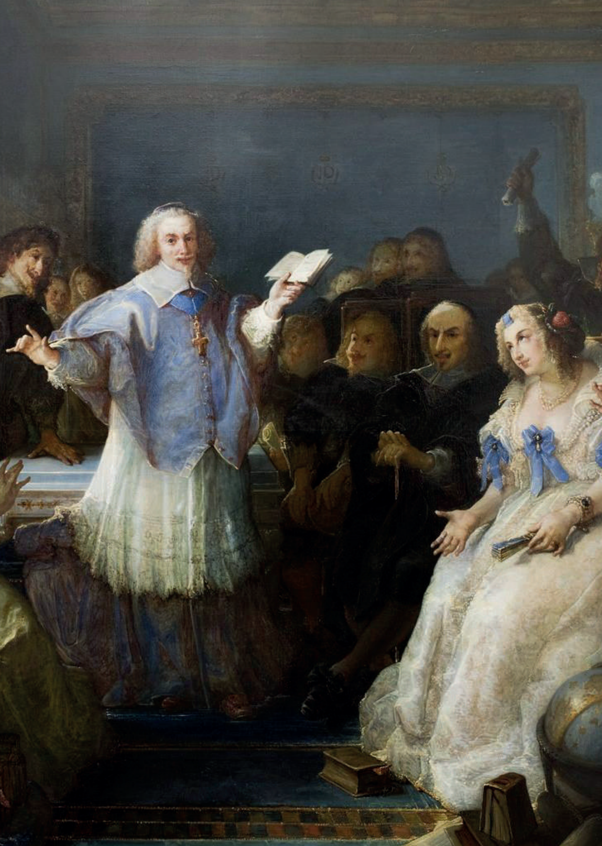
Hotel de Rambouillet , de François Hippolyte Debon, 1863. Tomado de Archivo: Hotel de Rambouillet François Hippolyte Debon.jpg. https://shorturl.at/wnS7O . CC0.