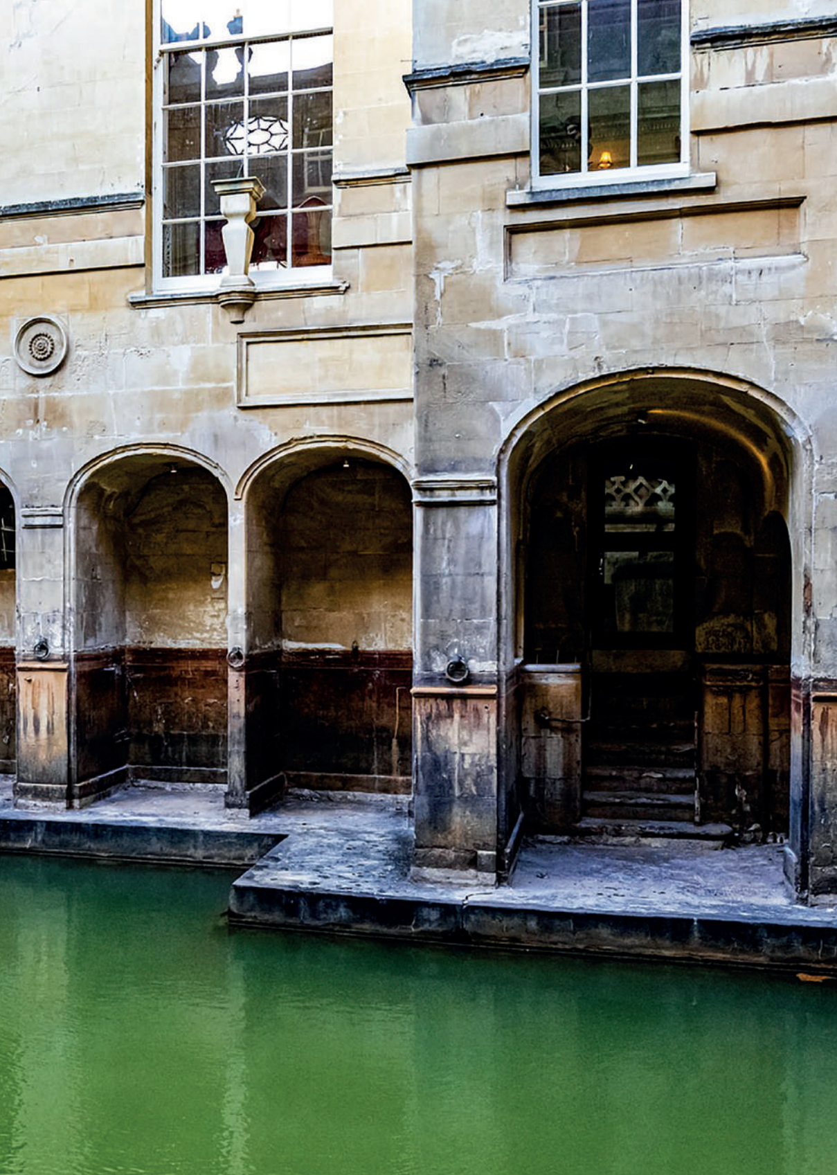
Baño romano [fotografía] por hulkiokantabak, s. f. Tomado de: https://shorturl.at/P3ffl . Imagen de uso gratuito bajo licencia de contenido de Pixabay.