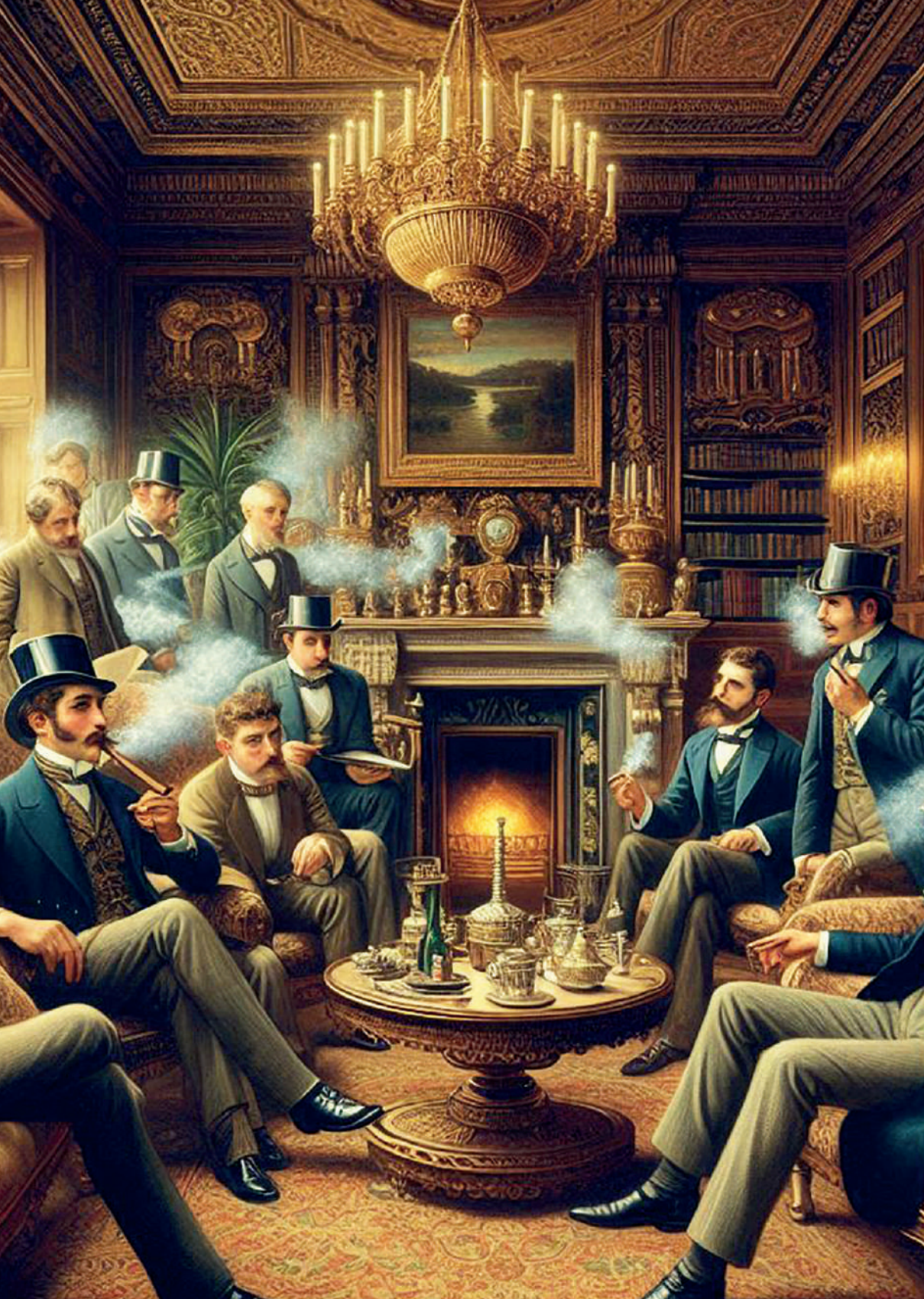
Salón de fumadores en Inglaterra, siglo XIX. Imagen generada por el autor con Microsoft Copilot.