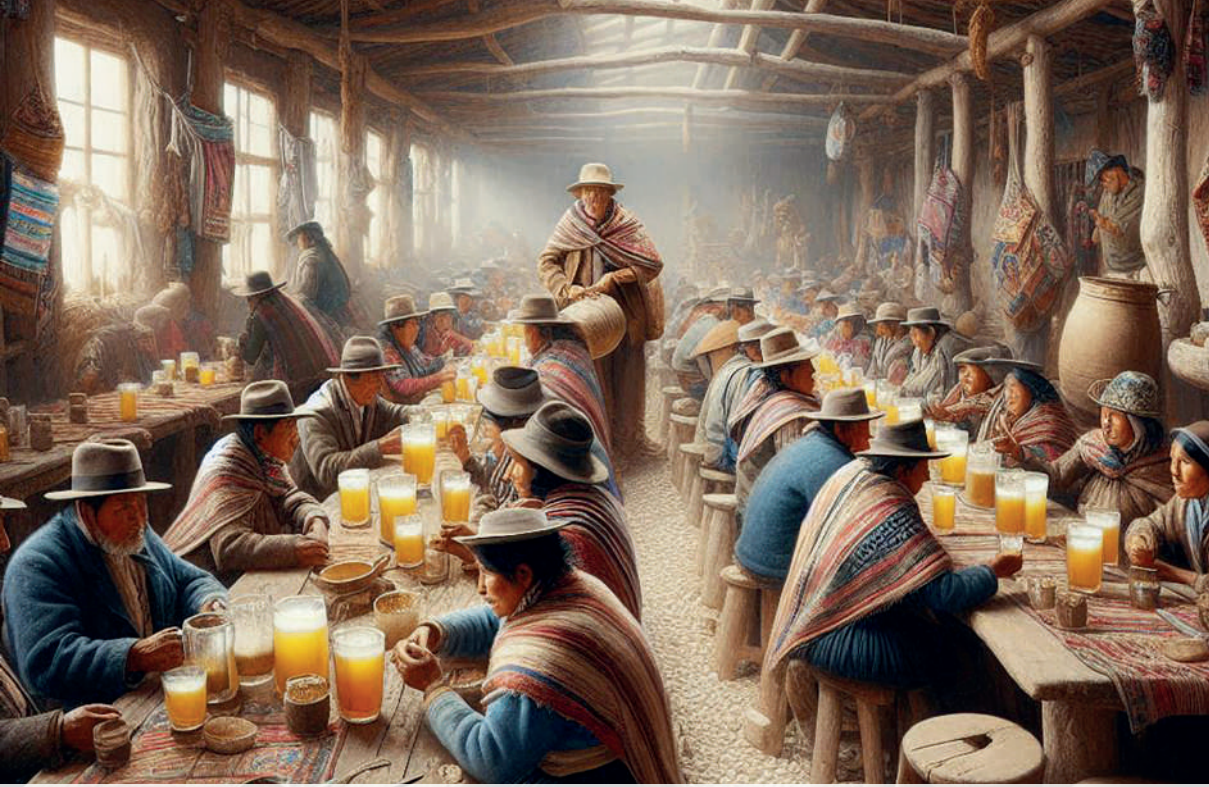
Representación de una chichería peruana. Imagen generada por el autor con Micosrosoft Copilot.