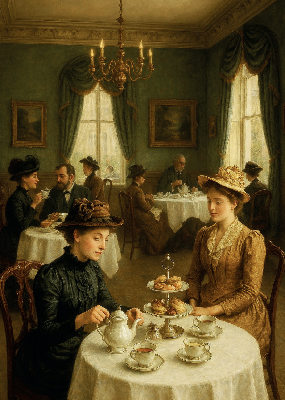
Salón de té inglés elegante del siglo XIX. Imagen generada por el autor con Microsoft Copilot.