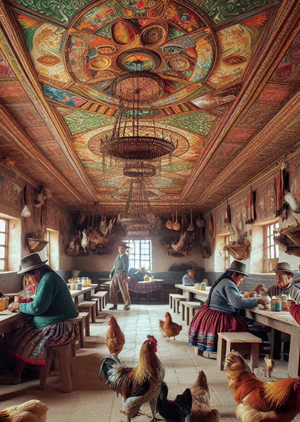
Interior de una picantería tradicional peruana. Imagen generada por el autor con Microsoft Copilot.