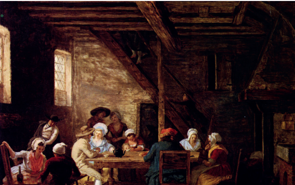
Interior del pub, de Leonardo DeFrance, > 1805. Tomado de Archivo: DeFrance, Pub interior2 (s. XVIII).jpg. https://shorturl.at/IR3H . Dominio público.