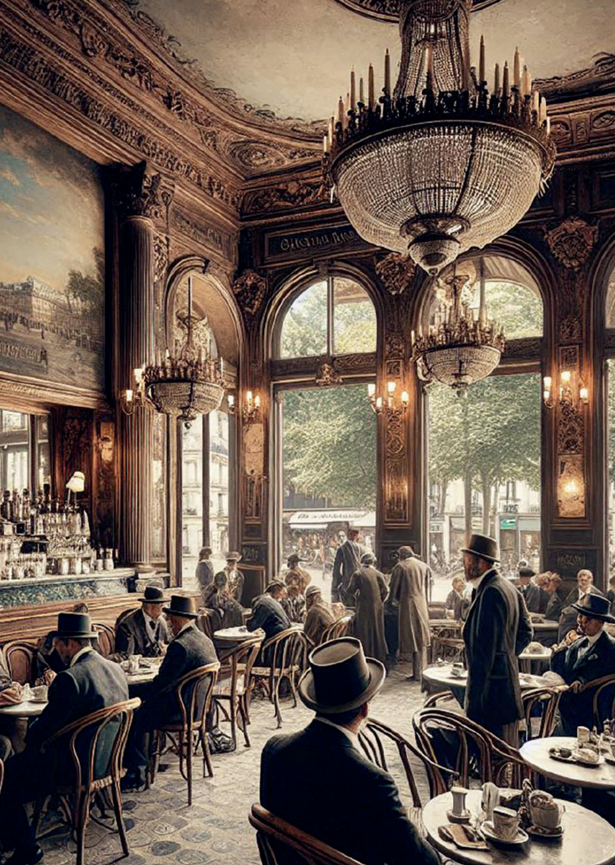
Café parisino del siglo XIX. Imagen generada por el autor con Microsoft Copilot.