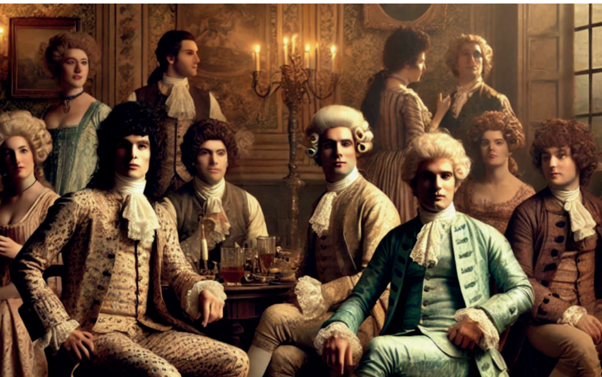
Representación de una Molly house. Imagen generada por el autor con Microsoft Copilot.