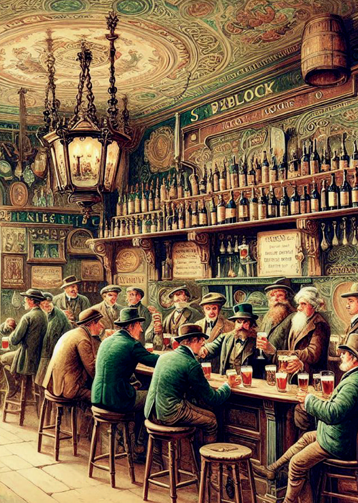
Pub tradicional en Inglaterra, siglo XIX. Imagen generada por el autor con Microsoft Copilot.