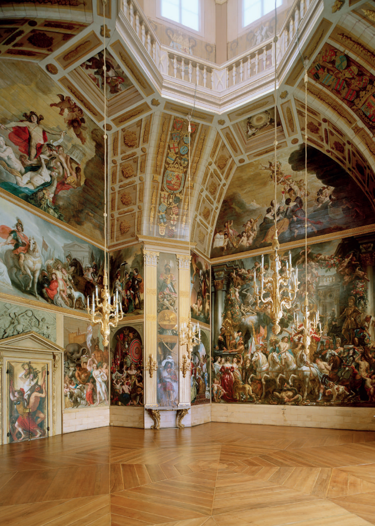
El Oranjezaal en el palacio Huis ten Bosch en La Haya, Países Bajos. [fotografía] por Rijksdienst voor het Cultureel Erfgoed. Tomada de Archivo: Oranjezaal na de restauratie- overzicht noordoosthoek, met de hele oostwand - 's-Gravenhage - 20416714 - RCE.jpg. https://en.wikipedia.org/wiki/Ballroom# . CC BY-SA 3.0.