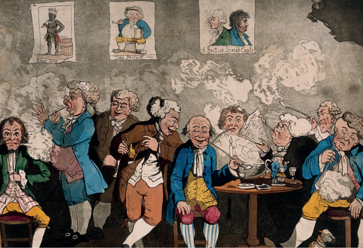
Caballeros georgianos fumando, bebiendo y leyendo periódicos en su club. John Caspar Ziegler según George Moutard Woodward, publicada por William Holland, 1798. Tomada de https://shorturl.at/Tj7jl . Dominio público.