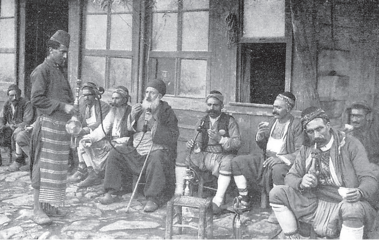
Café en Estambul , de Jean Pascal Sébah, 1905. Tomado de Archivo: View of Constantinople by Jean Pascal Sébah (1905).png. https://shorturl.at/9UQxD . Dominio público.