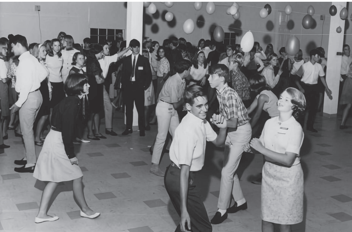
Fotografía en blanco y negro de un grupo de personas bailando, [fotografía] por Florida Memory, 2023. Unsplash ( https://acortar.link/gWLiHO ). Licencia Unsplash.