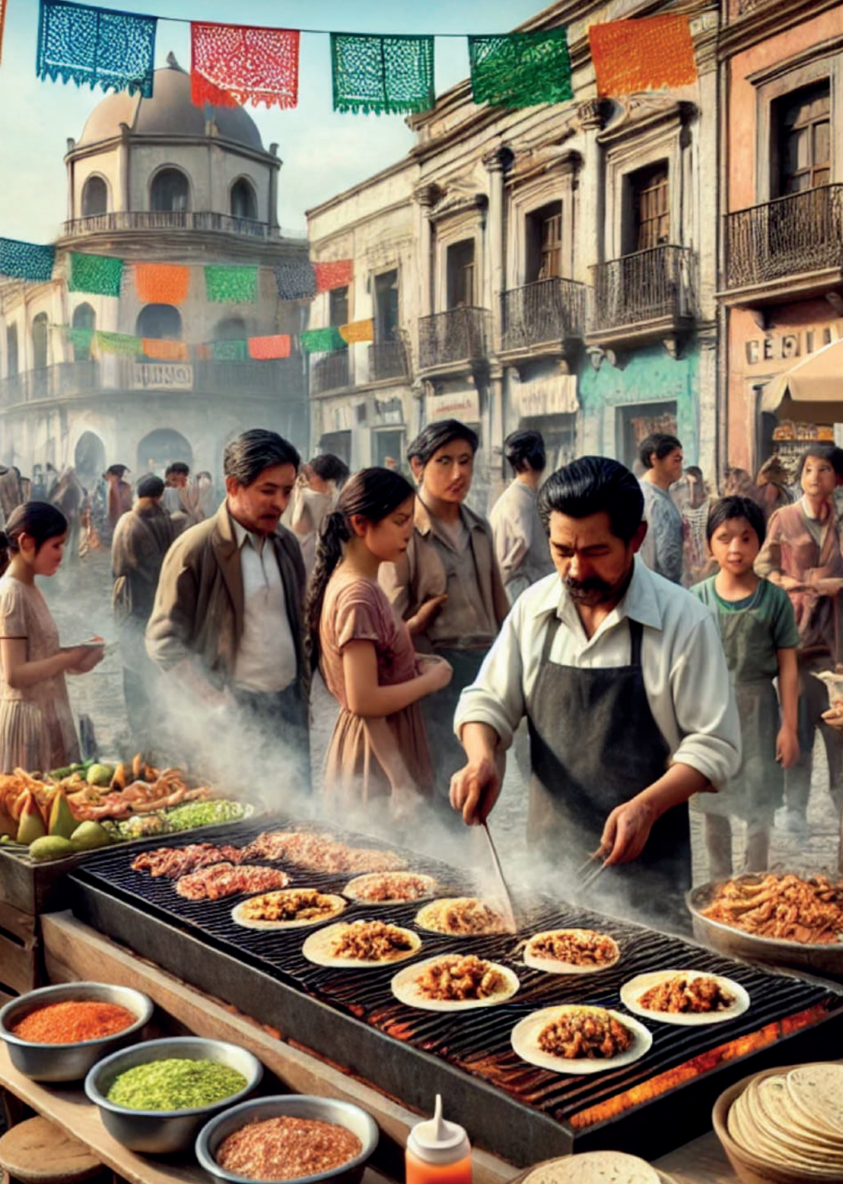
Taquería tradicional mexicana.