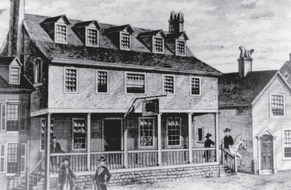
Boceto de Tun Tavern en la Guerra Revolucionaria, s. a. s. f. Tomado de Archivo: Sketch of Tun Tavern in the Revolutionary War.jpg. https://commons.wikimedia.org/w/index.php?curid=2398171 . Dominio público.