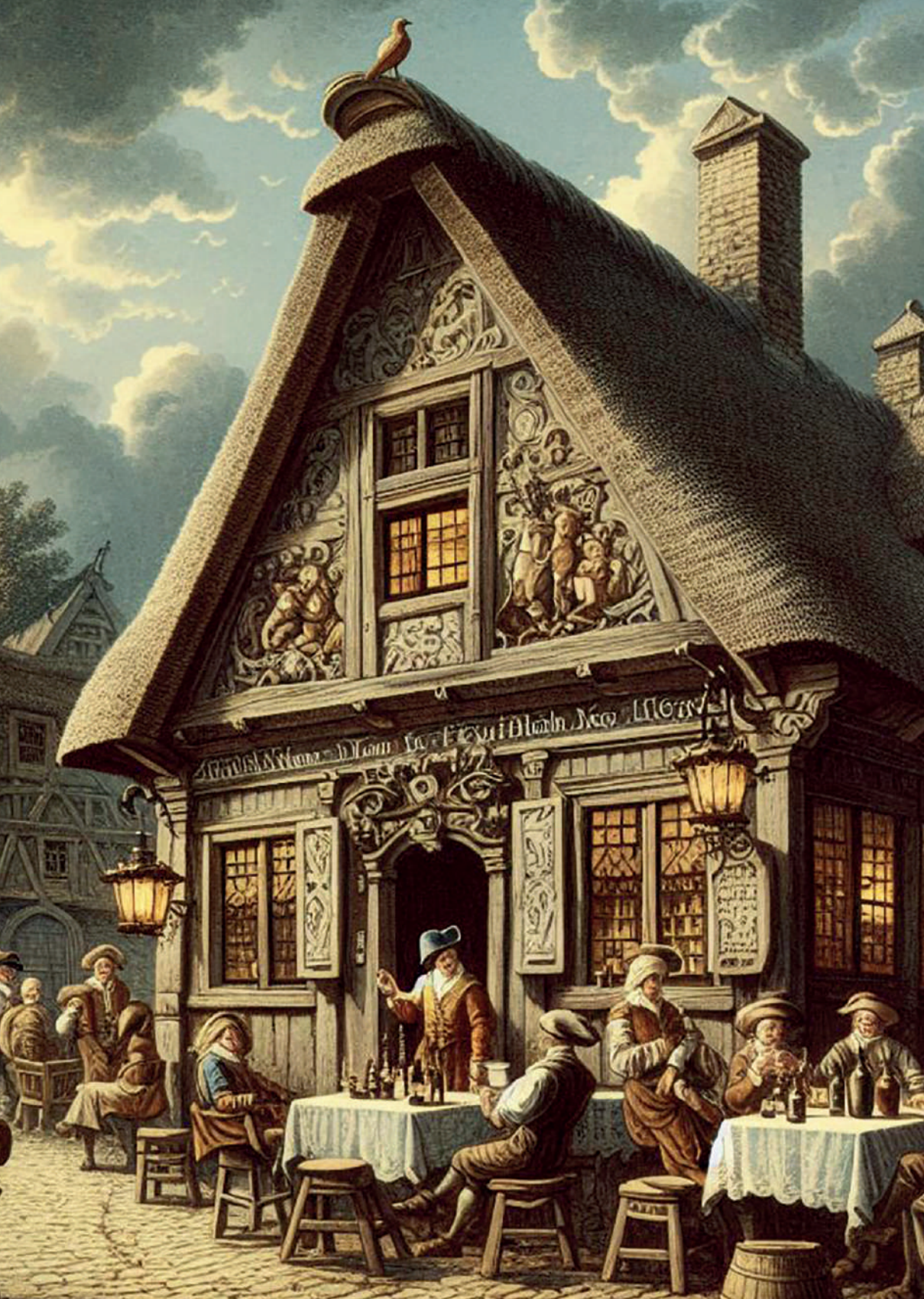
Taberna en Europa, siglo XVII. Imagen generada por el autor con Microsoft Copilot.