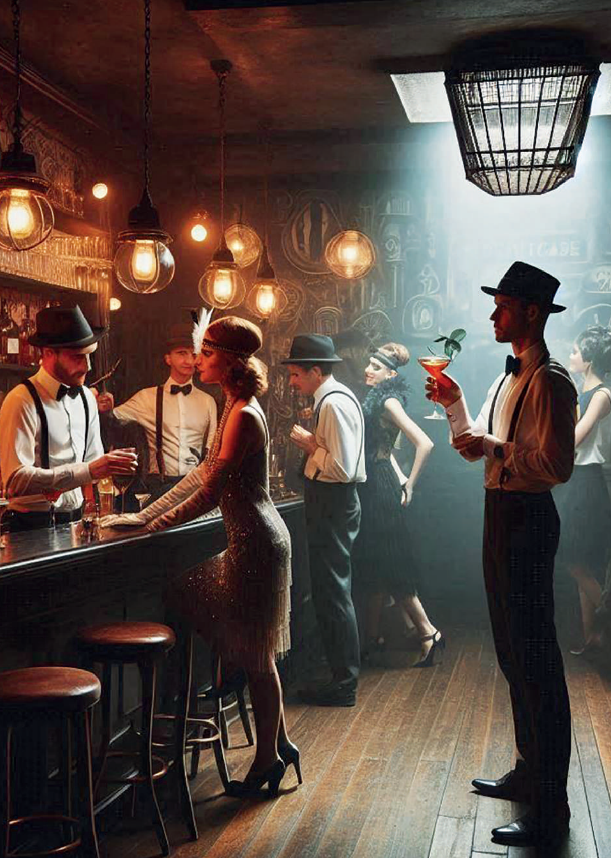
Speakeasy durante la Prohibición en los años 30 en los EU. Imagen generada por el autor con Microsoft Copilot.