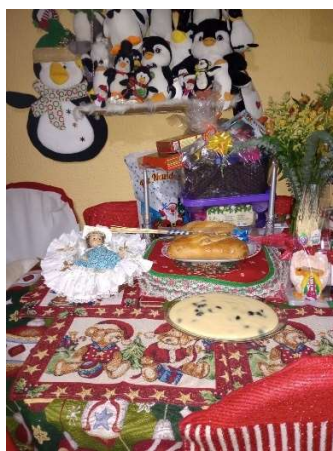
Figura 5 Mesa lista para recibir las bendiciones, del nacimiento del niño Jesús. Año 2023 Bogotá