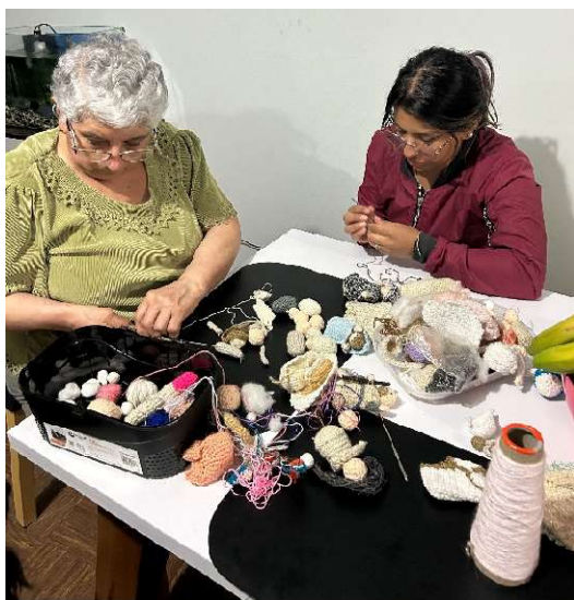
Figura 17 Sesión #3 - Aprendiendo a tejer un mini-pesebre Año 2024.

Pues no solo fue el aprendizaje para realizar elementos físicos tejidos, sino aprendizaje frente a la historia de mi familia, a nuestra crianza, nuestros pensamientos y finalmente a mi objetivo principal que era encontrar mi identidad familiar, lo que realmente nos une y nos distingue como familia, y como hacer que todos estos aprendizajes obtenidos en el proyecto me puedan ayudar en el aula beneficiando a mis estudiantes, con más que una simple clase, lograr estar en un ambiente óptimo.