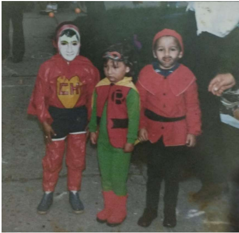
Figura 12 época de Halloween en el año 1984 Bogotá.