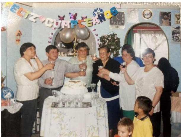
Figura 10 Celebración de cumpleaños hace 20 años. Año 2004 Bogotá.

Por ejemplo, la colección de pesebres y la participación comunitaria en festividades religiosas como lo son la asistencia a misas, participación en novenas, celebraciones de cumpleaños, siete de velitas, Navidad, Halloween, etc. reflejan un fuerte compromiso con las tradiciones familiares. Estas prácticas generan un sentido de pertinencia y contribuyen a la transmisión de identidad cultural y religiosa de generación en generación. Esta transmisión de identidades se ve reflejada en la cantidad de objetos navideños que viven en la casa de mi familia cada noviembre 9 esta práctica sigue vigente en mi vida en compañía de algunas creaciones de decoraciones manuales que se realizan para la ocasión, pues entre más adornos y celebraciones se siente mucho mejor y más cálido el espíritu navideño.