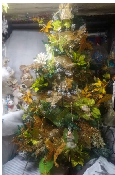
Figura 7 Arbol realizado hace pocos años, el cual vivió un proceso de transformación. Año 2021 Bogotá.

Esta categoría llamada mutaciones, ha sido fundamental para comprender la evolución de mi familia a lo largo de treinta años aproximadamente, en aspectos cruciales como la religión, las tradiciones, los roles de género y la crianza. A través de esta investigación, he evidenciado la persistencia de la creencia en Dios como un pilar central que ha influido en las decisiones y valores morales de cada generación. Además, he podido observar cómo estas tradiciones familiares han cambiado y perdurado, sobre todo modificado con el tiempo. Asimismo, entendiendo y enfrentando desafíos significativos, como la promoción de la equidad de género y la transición hacia prácticas de crianza más efectivas y menos violentas. La adaptación a los