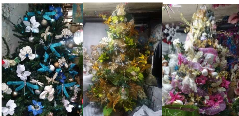
Figura 18 Comparación de tres vestidos navideños diferente años 2020-2021-2022.