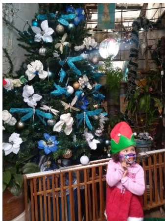
Figura 6 Árbol navideño, Año 2020, Bogotá, fotografía tomada por mí.

lo más probable desde mi perspectiva es que esta costumbre no se replique en el nuevo hogar, sino solo se realice cuando la familia vuelva a compartir de la misma forma que lo ha venido haciendo.