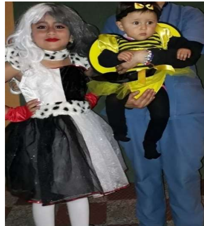
Figura 11 Época de Halloween en 2020, Bogotá

La convivencia en estos espacios nos ayuda a fortalecer nuestro amor y nuestras relaciones, que, como seres sociales, las interacciones y conexiones con los demás son esenciales para experimentar una plena satisfacción en nuestras vidas, así como lo menciona De Gregorio El ser humano, por lo tanto, es solamente cuando es en relación con los otros, y se realiza en la medida en que se entrega al otro estableciendo lazos (Gregorio, 2014, pág. 209).