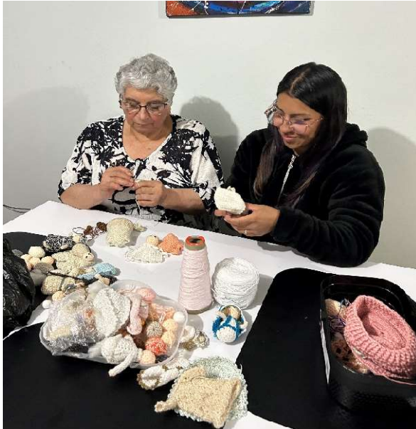
Figura 14 Mi abuela enseñándome a tejer un pesebre navideño. Esta imagen muestra la evolución que se ha tenido en cuanto a la forma de enseñar en otra etapa de nuestras vidas. (para ver los resultados revisar el anexo #1 "sesiones" Año2024 Bogotá

clases con proyecciones muy diferentes que serán muy oportunas para los procesos que estén viviendo mis estudiantes.