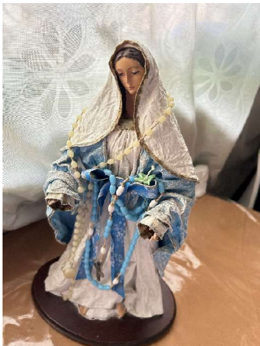
Figura 13 Virgen María realizada por Nana en técnica de encolado en el año 2000.

Fotografía tomada por mi en el año 2024, Bogotá. (Para ver algunas de las creaciones de Nana, ingresar al anexo #3)