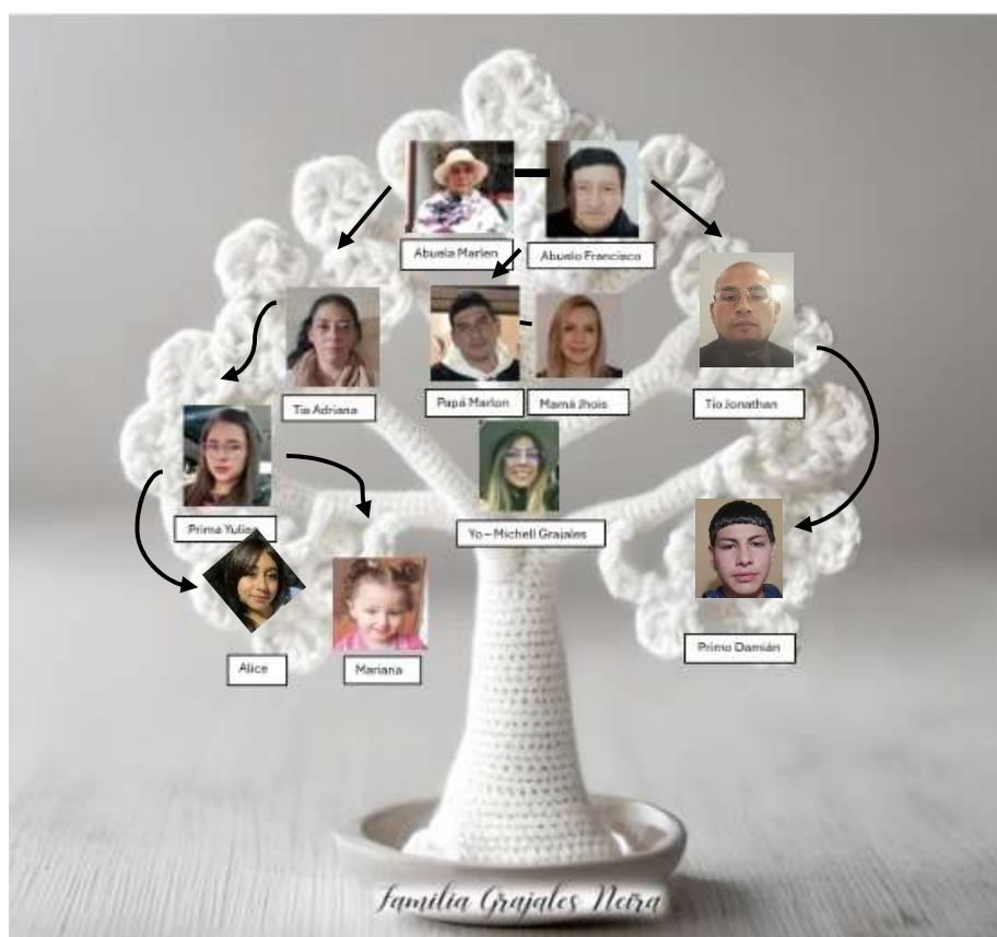
Figura 3 Mi árbol genealógico Año 2024 - Elaboración propia. Imágenes obtenidas de redes sociales.