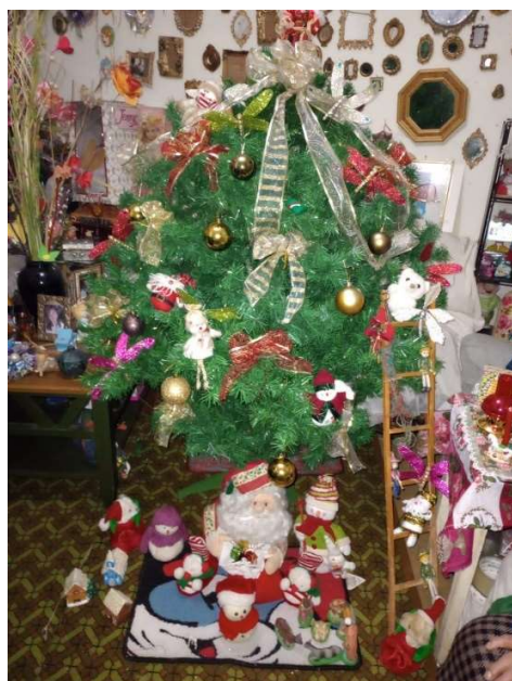
Figura 8 Arbol similar a el realizado en años pasados armado en la antigua casa de mis abuelos. Año 2019 Bogotá.

manuales, estas transformaciones derivan del desarrollo social y el consumismo, el cual brinda mayores facilidades para realizar y obtener cosas como en este caso los árboles navideños.