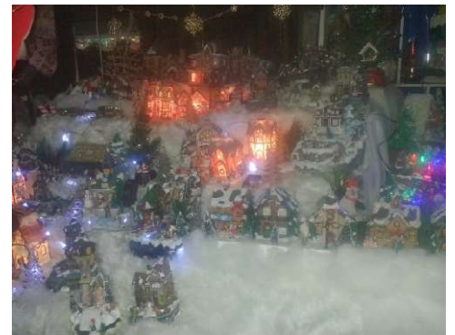
Figura 4 Pesebre realizado con Villas navideñas. Año 2018 Bogotá.

En cuanto a la evolución de las tradiciones religiosas y familiares, podemos destacar los cambios generacionales que se han transformado y mantenido durante varios años. Los eventos culturales y familiares han sido muy significativos, ya que han creado momentos que han marcado la historia familiar (Explicado mejor en el anexo 2, en la página n°2). Partiendo de esta categoría se puede explorar cómo estas dinámicas influyen y afectan la cohesión e identidad de mi familia a lo largo del tiempo.