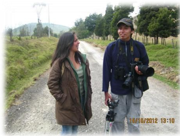
Foto 6 . Por Bernal M. El camino polvoriento que conduce que atraviesa la vereda Cascajal-Canoas y conduce al Parque Natural Chicaque.

Un camino que guarda muchas historias, ya que, entre las pendientes y escarpadas cumbres de las montañas y exuberante vegetación, se esconde un camino en piedra, del cual se cuentan historias... de indígenas guerreros, de conquistadores perdidos o de campesinos ambulantes: “en esos tiempos su merced, era un camino así empedrado yo me acuerdo, yo era pequeñita pero yo me acuerdo.... que los domingos eso sacaban en caballos y burros toda la mercancía de abajo, toda la fruta, todo eso lo llevaban a la plaza a vender” (Galindo, 2013). Además, paso un suceso muy importante “dicen los viejos, que por ese camino de por aquí, paso tres veces Simón Bolívar” (Martínez Y. , 2013). Ahora turistas extranjeros, biólogos especializados y caminantes lo recorren. Cuando en algún