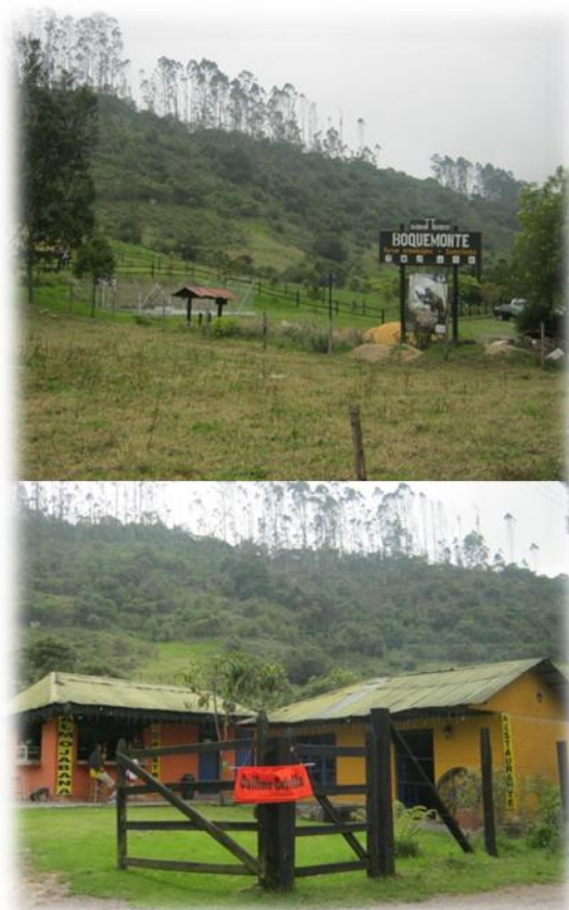
Foto 17 Fotos del Parque Ecoturístico Boquemonte. Foto A. El restaurante y la tienda. Foto B. La estación meteorológica y el aviso ubicado en la entrada del Parque.