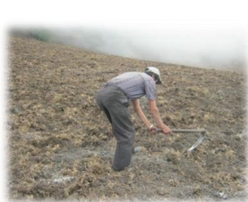
Foto 18 Algunas prácticas tradicionales en la siembra de papa. Campesino arando la tierra con el azadón de “chuzo”.

Para el cultivo de papa, se utiliza una hectárea y se siembra antes de que se presenten las lluvias. Para una correcta preparación del suelo, los campesinos realizan labores de arado de “chuzo” o “gancho” que consiste en un palo con una punta larga de acero, que