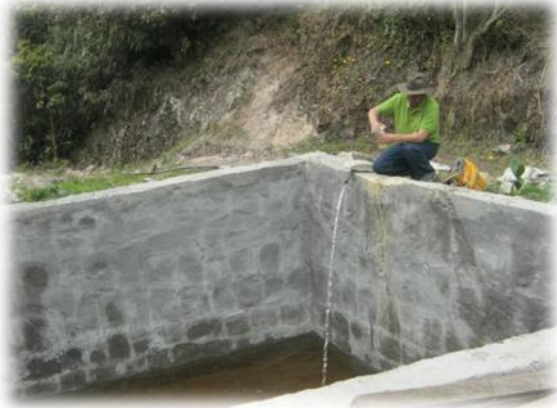
Foto 8 Pozos de agua de en una de las montañas de la vereda Cascajal-Canoas.

<Donde no hay servicio de agua potable, los habitantes de la zona aprovechan los nacederos de agua y construyen pozos, para el abastecimiento de este líquido vital: “El agua se saca de nacederos de por allá arriba, cuando se empiezan a secar, empieza a llover... Aquí se cuenta con luz, el agua la traemos de por allá arriba, cada 8 días traemos el agua para el consumo de la semana, la ropa si la lavamos por allá... en verano es que se pone berraca la cosa, la única que no se seca es la quebrada allá al lado de la entrada del parque, allá se lava la ropa” (Martínez A. , 2013).