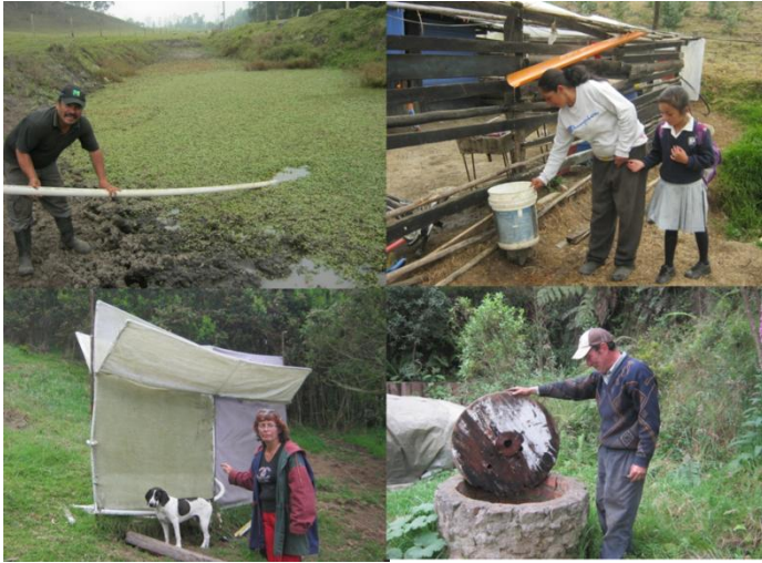
Foto 21 Por Bernal A. Los habitantes de la vereda Cascajal-Canoas cosechando agua. Foto A. Recolectando Agua lluvia. Foto B. Trampa de niebla para obtener agua. Foto C. Aljibes para recolectar agua subterránea. Foto D. Reservorios o pozos de agua para el verano

Así mismo, las gentes de la vereda Cascajal-Canoas, bloquean el paso cerca a los nacaderos “hay una cascada pequeña, que el equilibrio es tan supremamente tan delicado que la sellaron porque no conviene que la gente pase por ahí, porque dañan ese pequeño equilibrio si me entiende, es decir, eso quedo suspendido para el turista” (Triviño, 2012).