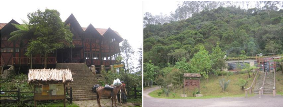
Foto 10 Por Bernal A. El Parque Natural Chicaque. Foto A. El Refugio, restaurante hotel ubicado en el centro del parque. Foto B. El nuevo restaurante Arboloco, ubicado en la entrada de la reserva

Para muchos bogotanos, especialmente estudiantes de escuelas y colegios, universidades y caminantes, el Parque Natural Chicaque es el referente más popular sobre reservas naturales, por su cercanía a la ciudad, facilidad de transporte y una trayectoria de 24 años de funcionamiento, que han hecho de Chicaque un lugar para visitar mucho más accesible que otros parques naturales.