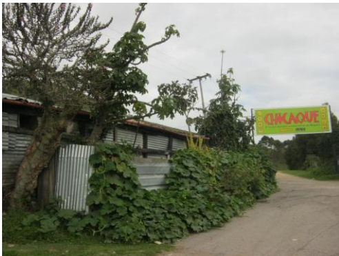
Foto 13 Casa de don Procopio Martínez, que se caracteriza por las plantas medicinales sembradas a su alrededor

Don Procopio y Doña Orosia viven al inicio del camino, es decir, a la entrada de la vereda Cascajal-Canoas o la vía que llega al Parque Natural Chicaque.