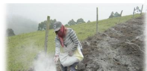
Foto 20 Campesina agregando Cal a la tierra antes de poner la semilla de papa