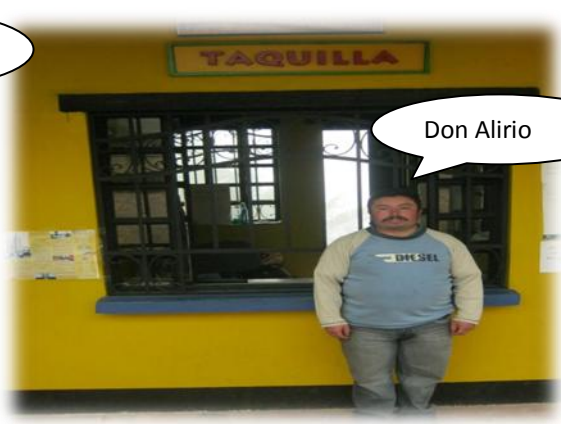
Foto 9 Por Bernal A y Bernal M. Collage de los diferentes Actores Sociales, protagonistas de esta investigación.

Recorriendo los 3 kilómetros del camino polvoriento que termina en la entrada del Parque Natural Chicaque, en ese pequeño tramo, viven las personas que compartiendo algo de sus vidas y abriendo las puertas de sus hogares, dieron un giro de 180 grados a este trabajo de investigación: