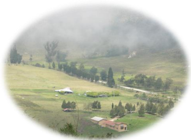
Foto 1 Uno de los paisajes de la vereda Cascajal-Canoas. El camino, el bosque, la niebla y la comunidad campesina.