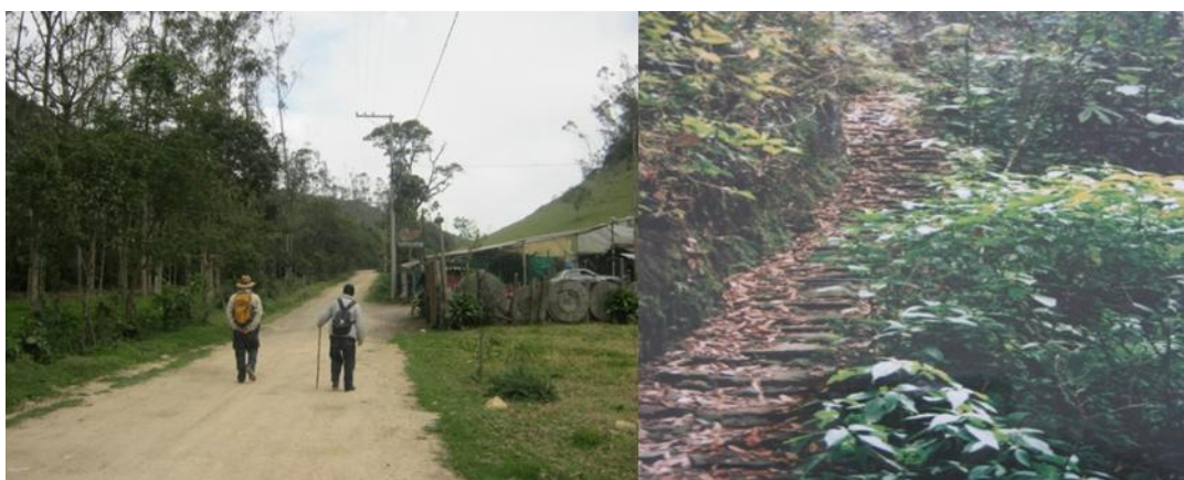
Foto 11 Por Bernal M. Los cambios que ha tenido el camino en los últimos 24 años por el establecimiento del Parque Chicaque. Foto A. El Camino empedrado conservado por la reserva. Foto B. El camino actual que cruza la vereda Cascajal-Canoas y conduce al Parque

Cómo puede apreciarse, el establecimiento del Parque Natural Chicaque, ha impactado la vida de las personas de los alrededores, que a pesar de los 24 años de funcionamiento de la reserva, todavía guardan cierta resistencia, “eso para nosotros no tiene nada de servicio, por allá ni vamos... desde que hicieron ese parque yo ni más, cuando era el camino empedrado sí... eso era muy bonito para ir uno a caminar por allá” (Galindo, 2013).