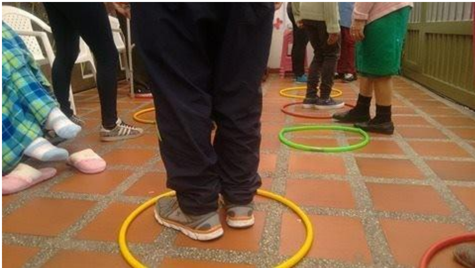
Anexo 9 El espejo