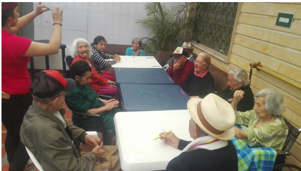
Anexo 4 Quién soy