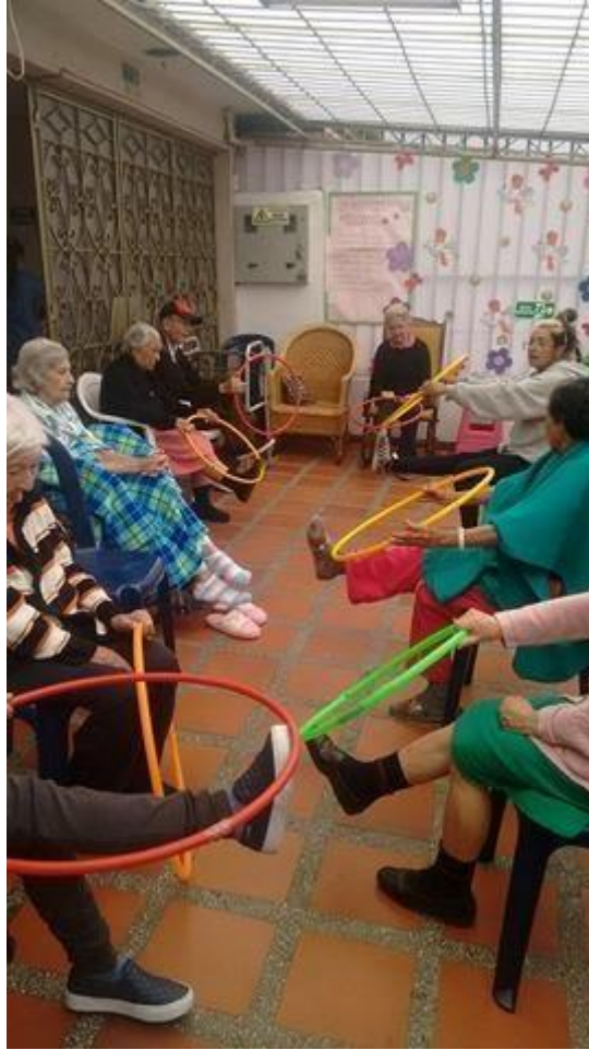
Anexo 8 El espejo