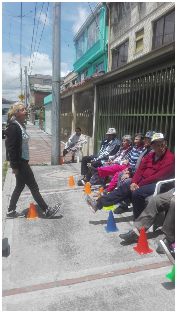
Anexo 1 movimientos básicos