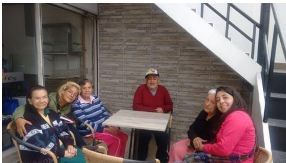
Anexo 11 Compartir