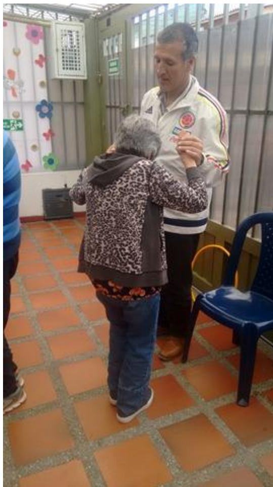
Anexo 7 Me siento con el otro