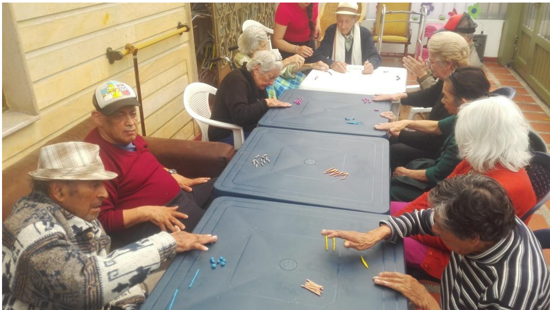
Anexo 3 Quién soy