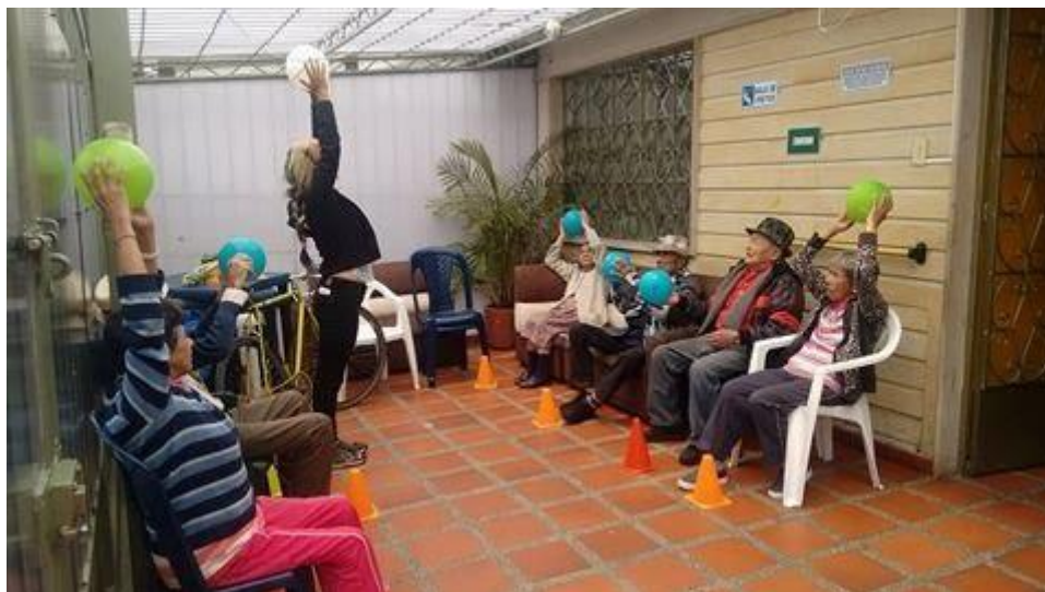
Anexo 10 Cielo y tierra