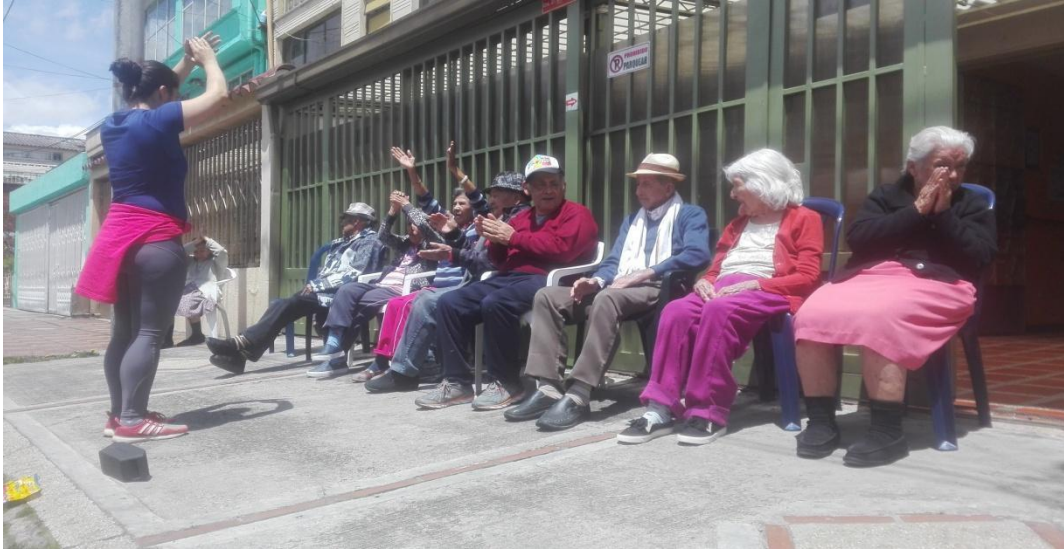
Anexo 2 movimientos básicos