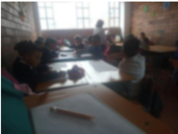
Fotografía 4: Niños y niñas de grado primero A del Jardín Infantil Sol Solecito. Esta imagen cuenta con los respectivos consentimientos informados de los padres de familia.