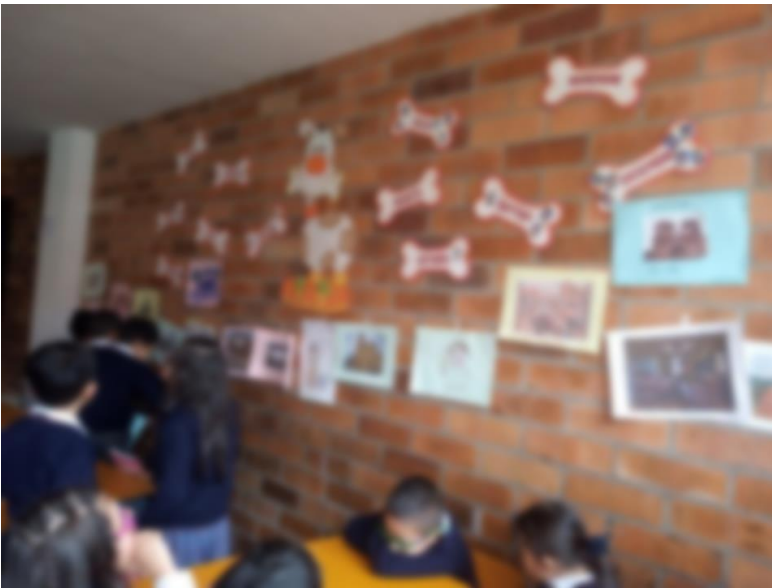
Fotografía 10: creación de la ciudad antigua (con imágenes de lugares antiguos) de los niños y niñas del grado primero A del Jardín Infantil Sol Solecito. Esta imagen cuenta con los respectivos consentimientos informados de los padres de familia.

Se debe agregar que, la última intervención antes de ir a la visita en el museo que se realizó con los grados de primero, los niños y niñas realizaron una ciudad antigua, para esto, como tarea se había pedido llevar a clase imágenes de casas, plazas de mercado, iglesias y calles según correspondiera a cada niño. Con esto al llegar a clase, los niños y niñas explicaron que imagen habían llevado y cuáles eran las principales características y si estas corresponden a la época antigua o actual. Lo anterior nos permitió demostrar que los niños y niñas ya identificaban las edificaciones que pertenecen a la época colonial y las actuales de acuerdo a sus características principales, además de que estaban muy interesados por los materiales con los cuales se construían las casas anteriormente, el hecho de que las casas se construyeran en adobe de estiércol de vaca o de caballo era bastante curioso para ellos, escuchar este tipo de cosas era muy interesante. Luego de esto, se dispuso una pared para que en ella los niños y niñas pegaran su imagen formando entre todos una ciudad antigua.