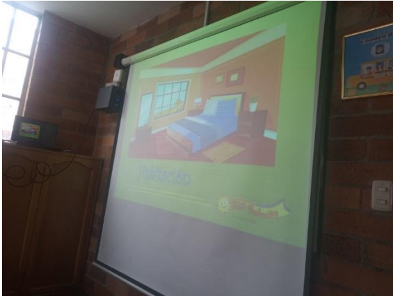
Fotografía 3: Jardín Infantil Sol solecito, exposición de casas antiguas y modernas