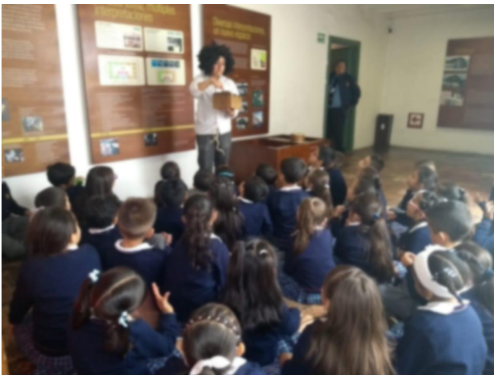
Fotografía 12: Visita al MICF de los niños y niñas del grado primero del Jardín Infantil Sol Solecito. Momento de diálogo sobre las características de la edificación del MICF. Esta imagen cuenta con los respectivos consentimientos informados de los padres de familia.