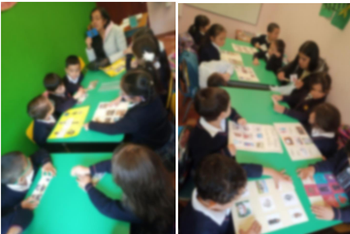
Fotografías 5 y 6: Juego de lotería con niños del grado transición A del Jardín Infantil Sol Solecito. Esta imagen cuenta con los respectivos consentimientos informados de los padres de familia.

presente. Lo anterior se confirmó mientras se jugaba; ya que, para poder ganar su ficha de lotería debían decir si el objeto que estaba en esta era del presente o pasado. Finalmente todos los niños lograron terminar su lotería, identificando los diferentes objetos.