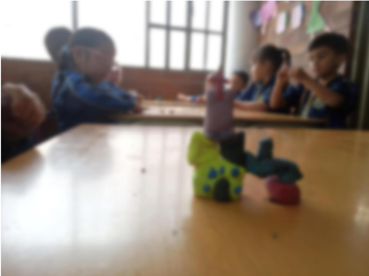
Fotografía 14: creación en plastilina de casas y edificaciones antiguas de los niños y niñas del grado primero B del Jardín Infantil Sol Solecito. Esta imagen cuenta con los respectivos consentimientos informados de los padres de familia.

en grupos de 4 y empezaron a realizar su edificación, realizaron casas con tejados antiguos, balcones, jardines grandes, realizaron una iglesia tomando como ejemplo la catedral primada como vemos en la imagen