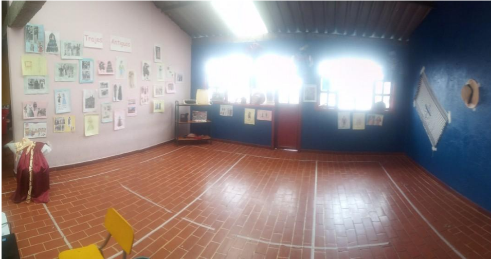
Fotografía 1: Jardín Infantil Sol Solecito

Otro rasgo que permitió el reconocimiento y la diferenciación fue que los niños y niñas dibujaron los vestuarios de hombres y mujeres actuales y antiguos, dejando ver de alguna manera como ellos entendían el pasado y el presente.