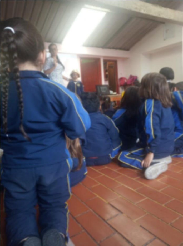
Fotografía 2: Niños y niñas de transición del Jardín Infantil Sol Solecito. Esta imagen cuenta con los respectivos consentimientos informados de los padres de familia.

Caso contrario fue lo que sucedió con los grados primero, ya que en esta situación las maestras decidieron siempre realizar sus actividades por separado, cada maestra con su grupo de trabajo, debido a que según el tema escogido por ellas (arquitectura en tiempos de colonia), se les presentaba complejo el término de arquitectura para la primera infancia y se evidenciaba su preocupación en cuanto a lo que los estudiantes podían responder o a cuáles eran los resultados finales para cada actividad planteada y desarrollada. En cuanto al haber realizado las actividades por grupos separados el punto positivo que se presencié fue porque permitió recoger un poco más individual lo que los niños y niñas se preguntaban