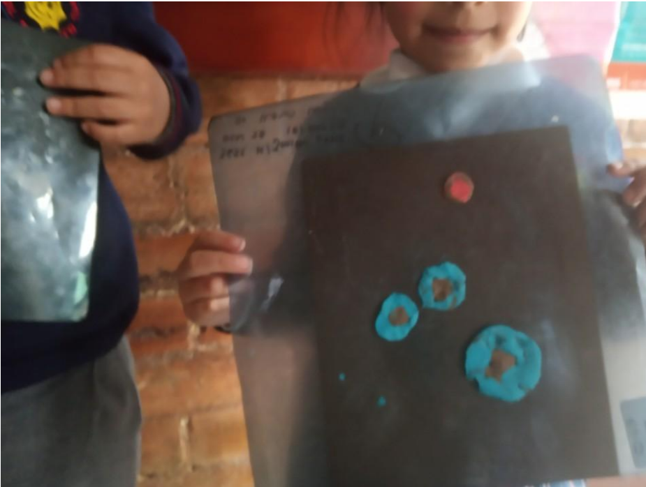
Fotografía 14: creación en plastilina de recuerdos del museo de los niños y niñas del grado transición B del Jardín Infantil Sol Solecito. Esta imagen cuenta con los respectivos consentimientos informados de los padres de familia.

Lo mismo ocurrió con transición B, se les dispuso plastilina para que ellos plasmaran lo que más les gusto en la visita al museo, de igual forma los niños hablaron de sus obras en plastilina. Entre esas estaban, escudos de la Nueva Granada, vestidos de mujer y de hombre antiguos, monedas, zapatos y diferentes objetos del museo. Algo muy interesante fue escuchar mientras explicaban sus obras, que describen el objeto que realizaron y llegaban hasta a compararlo con objetos actuales.