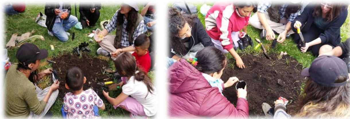
Imagen 48 y 49