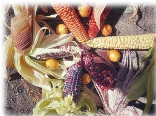
Imagen 40 y 41