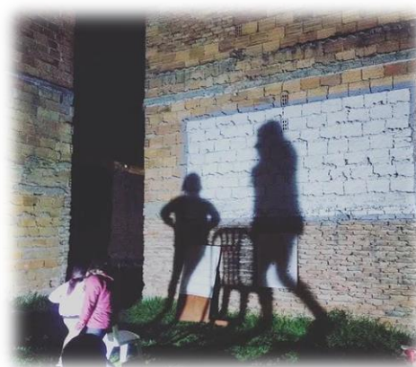
Imagen 33 y 34