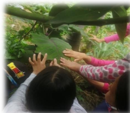
Imagen 22 y 23