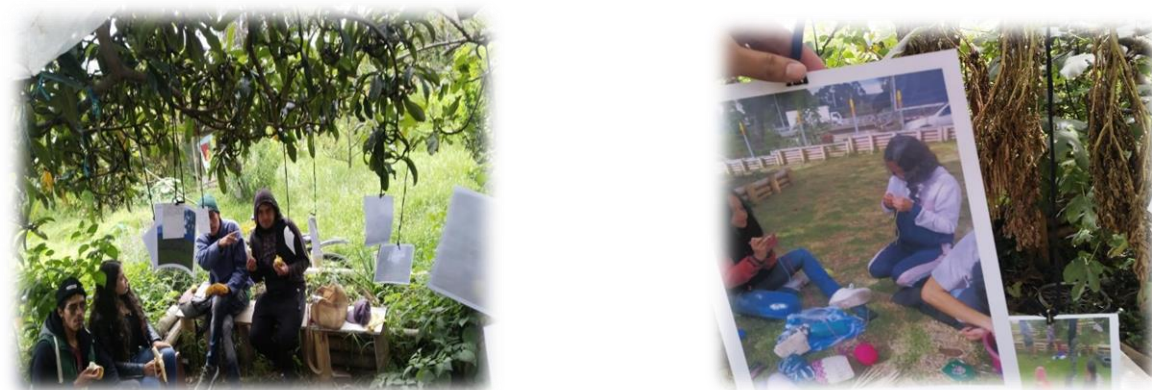
Imagen 3 y 4