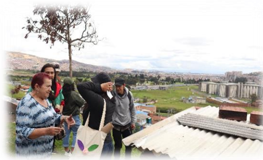
Imagen 10 y 11