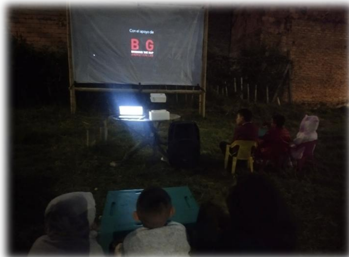
Imagen 59 y 60