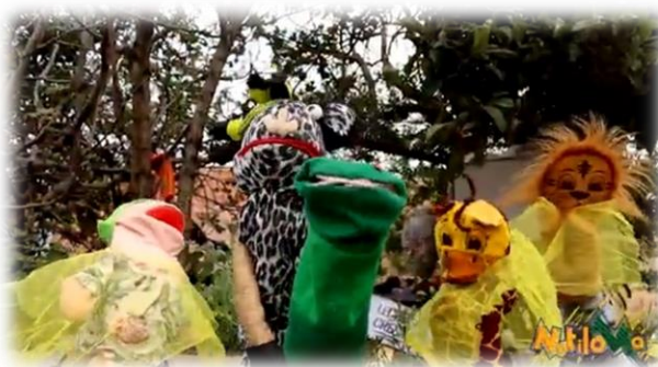
Imagen 57 y 58