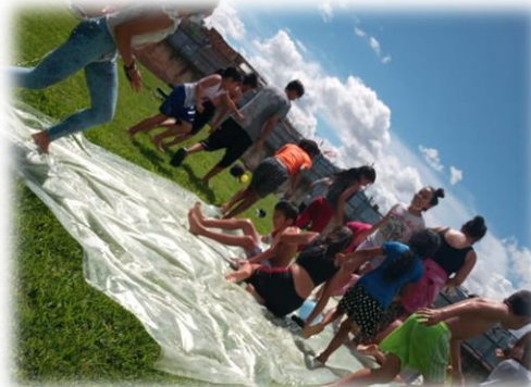
Imagen 18 y 19