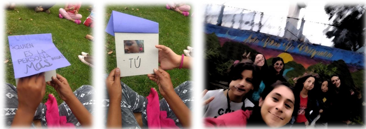
Imagen 28,29 y 30

“Recuerdo que estando compartiendo con vecinas compañeros lideresas líderes sociales en temas de agricultura urbana, me hablaban del aula libre y un día me invitaron, fui a aprender y compartir sobre la siembra de plantas medicinales alimenticias jardines polinizadores árboles frutos hablando también de la de la fauna que se beneficiada por estos espacios” (Entrevista en Diario de campo,2025).