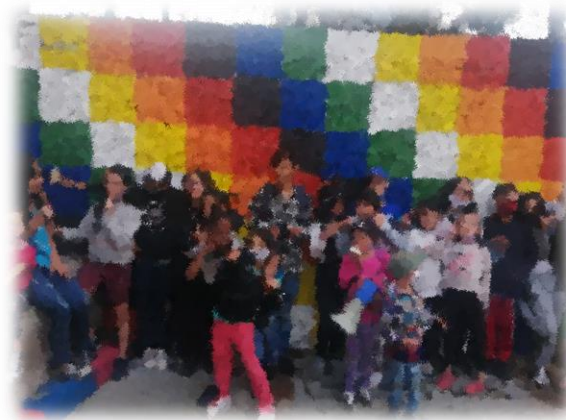
Imagen 26 y 27