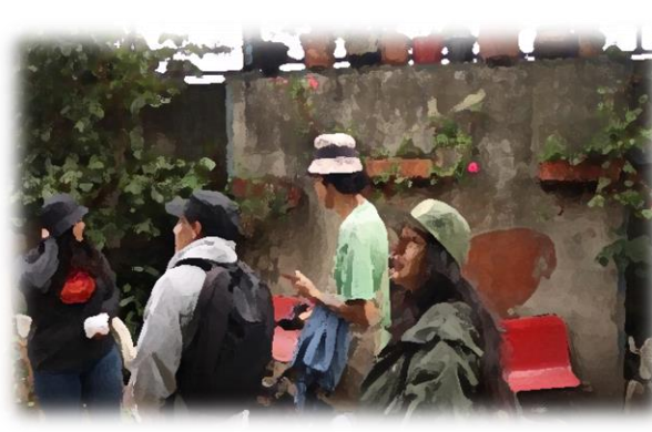
Imagen 8 y 9