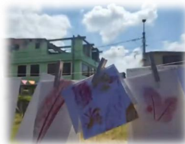
Imagen 45 y 46