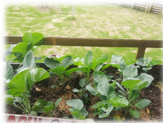
Imagen 31 y 32