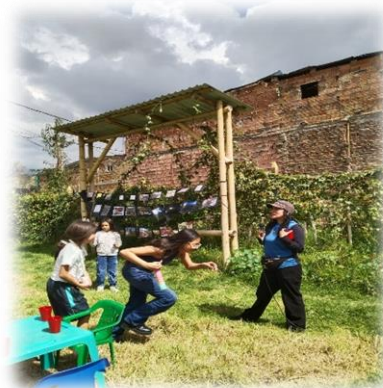
Imagen 63 y 64