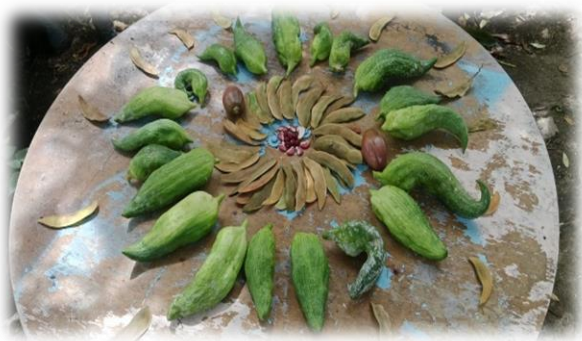
Imagen 61 y 62

Para finalizar queremos mencionar otros encuentros entorno a la más reciente cosecha de semilla libre de frijol y de maíz, traído de varias zonas del país como Boyacá, Cauca y Cundinamarca convirtiendo al Aula Libre La Chiguazá, en un espacio que guardian y comparte la semilla orgánica y nativa, apostando por una soberanía alimentaria que transforme, no solo la forma de alimentarnos si no de producir alimentos de maneras armónicas con el territorio, algo que ha invitado a pensar en la cosecha en un compartir, alejado de interés personales y/o económicos.