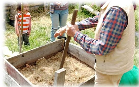
Imagen 52 y 53