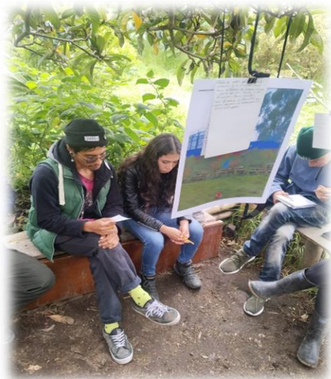
Imagen 6 y 7