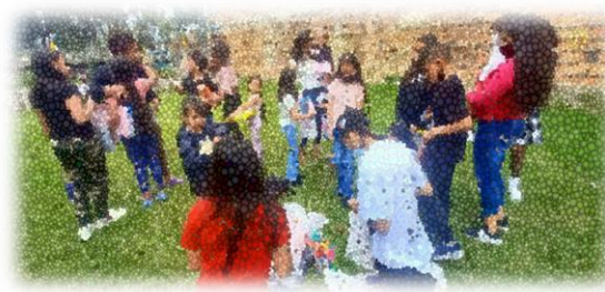
Imagen 35,36,37 y 38