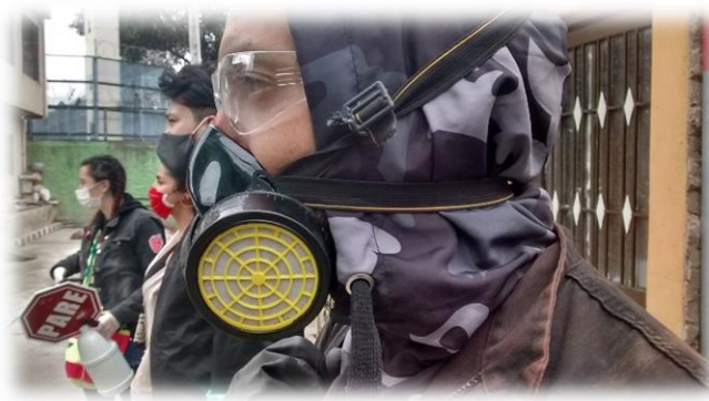
Imagen 20 y 21