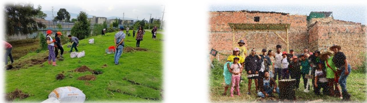
Imagen 50 y 51

Otra actividad estuvo relacionada a la siembra de más de 15 especies árboles nativos , como propuesta a la reforestación silvestre de la quebrada la Chiguazá, la cual como en varias de las actividades realizadas se dio gracias al apoyo de la comunidad y organizaciones populares y comunitarias finalizando con el compartir de la ollita comunitaria.