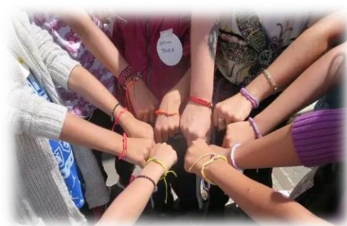
Imagen 15,16 y 17