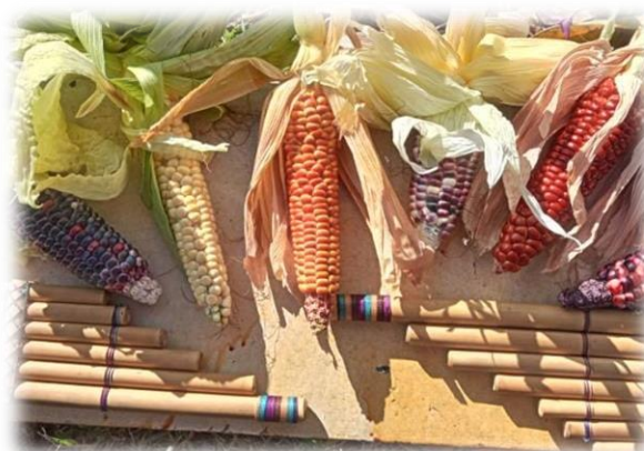
Imagen 54 y 55