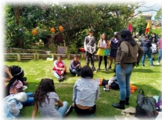
Imagen 24 y 25