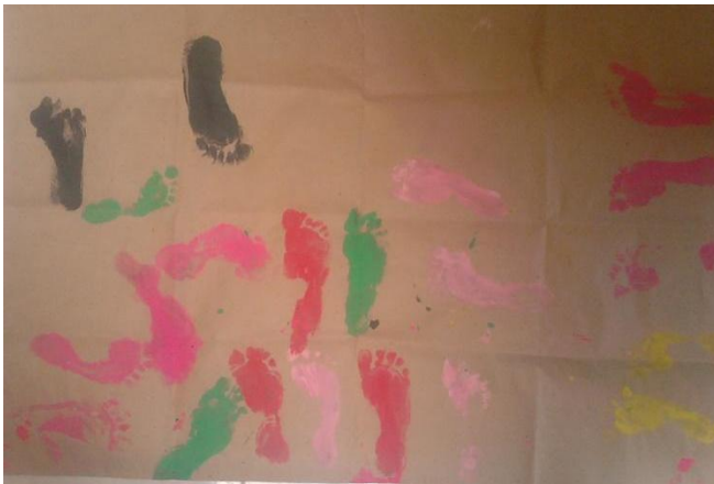
Imagen N° 3

Lo anterior, da paso a un tercer momento del taller en el cual se trabajó con pintura, por lo que se les pidió a cada uno de los niños y niñas que se quitaran las medias y recogieran los sacos o que se dejaran en el deportivo de la sudadera, dejando libre las