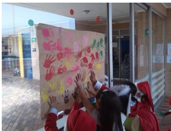
Imagen N° 39

vestidas y los muñecos autobiográficos de cada uno de los niños y niñas, tanto de jardín como de transición, allí ellos pudieron apreciar creaciones de cada uno de ellos, en las que se evidenciaron como eran tan diferentes la una de la otra, teniendo en cuenta que habían originado de las mismas orientaciones dadas por las maestras en formación. Es así que dentro del proceso de reconocimiento del cuerpo se hizo necesario no solo reconocer visualmente el cuerpo propio y el del otro, sino que también se evidenció la importancia de intervenir en aspectos tangibles, dando paso a las creaciones, por medio de diferentes materiales que permitieron la creación de diferentes escenarios que posibilitaron la exploración por medio de movimientos.