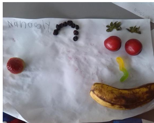
Imagen N° 35

Luego de esto se les pidió a los y las estudiantes que con esos alimentos que estaban en el centro del círculo debían realizar, una composición en la cual estuvieran plasmado sus cuerpos a partir de lo que realiza cada uno de