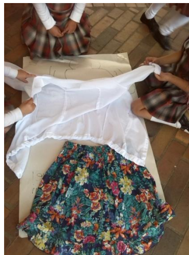
Imagen N° 13

niños le dice a las niñas que eso es una corbata y que está solo la utilizan los hombres pues según