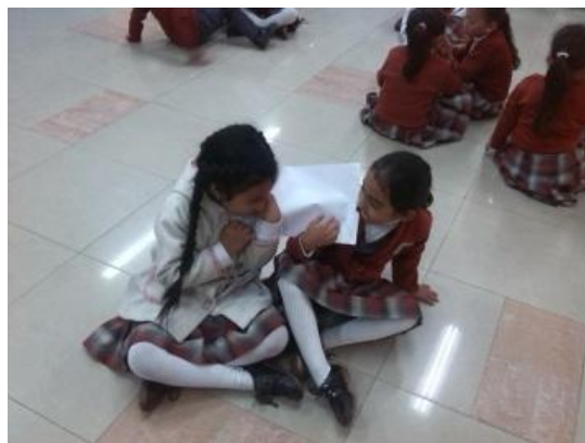
Imagen N° 29

Después se les pidió a los niños y niñas que se organizan en parejas para jugar con diferentes elementos, en donde se debían realizar movimientos de desplazamiento, así que a cada pareja se le dio primero una bomba, la cual debían sostener con diferentes partes