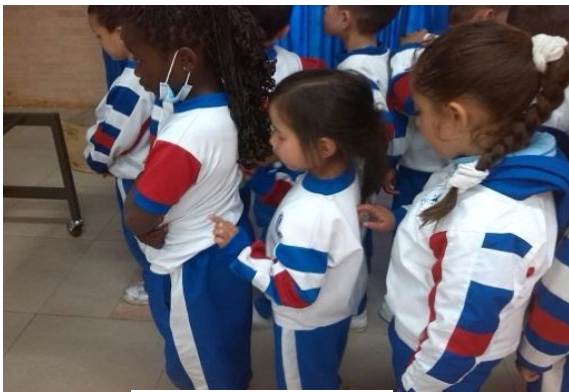
Imagen N° 28

En un tercer momento se les explica a los(as) estudiantes que se jugará al dorso mensaje, este ejercicio que trabaja la parte de la espalda en donde se reproduce un mensaje