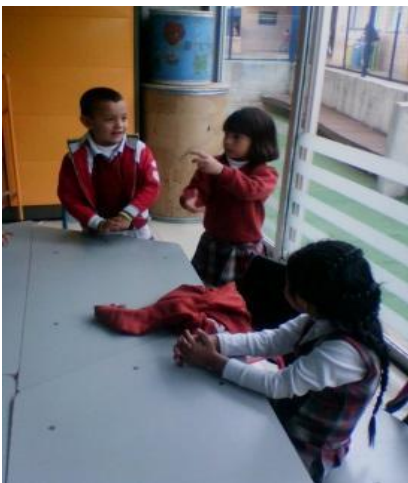
Imagen N° 22

El ejercicio anterior demuestra como con el paso del tiempo y la relación con el otro el niño y la niña son capaces de interactuar con otros cuerpos para identificar la naturalidad de los movimientos y posturas que el cuerpo puede realizar dentro de un contexto o situación determinada, el niño y la niña entonces crean relaciones emocionales con el otro que los lleva a la apropiación de su cuerpo como un espacio que se puede moldear según algunas características que se brinden en el espacio. Son procesos que a partir de la