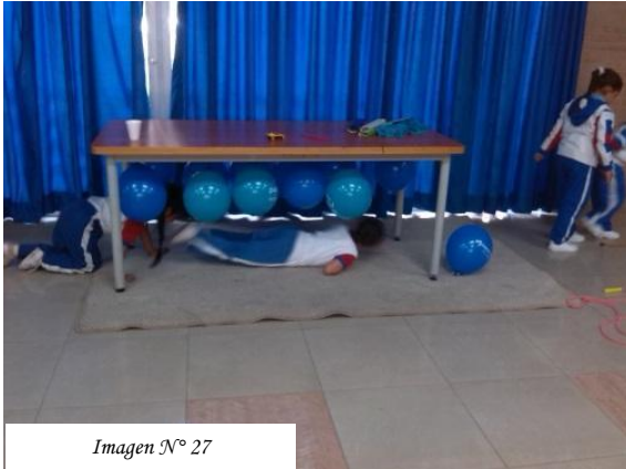
Imagen N° 27

movimientos y cuerpo según la forma como ellos quieren intervenir con el objeto, teniendo