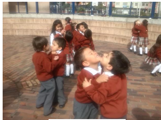
Imagen N° 9

En un segundo momento se dio el trabajo de identificación de las partes del cuerpo y las diferentes articulaciones que se tiene como las rodillas, las muñecas, los codos, etc. Los ejercicios se realizaron en parejas, en la que se hacía contacto con las partes del