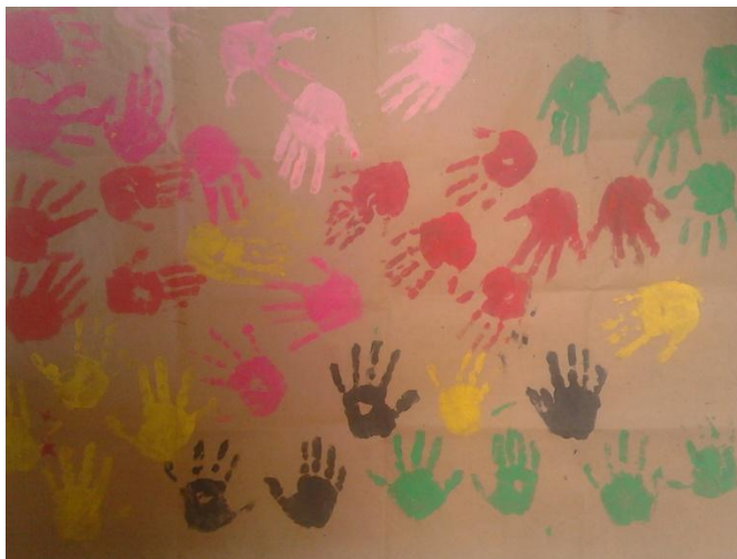
Imagen N° 2

Por otra parte, en un segundo momento del taller se les pidió a los niños y niñas quitarse los zapatos e intercambiarlos con su pareja, una vez realizado el intercambio a muchos de los niños y niñas no les quedaba exacto el zapato del otro (a unos muy grande y a otros muy pequeños) ellos con emoción expresaban a las maestras lo incómodo que era tener un zapato muy pequeño o muy grande a la hora de caminar y a su vez que no importaba la altura del compañero, ya que este era alto pero con un pie bastante pequeño y que aunque él no era igual de alto, su pie era más grande, esto se evidencia en relatos como “ el zapato de Matías no