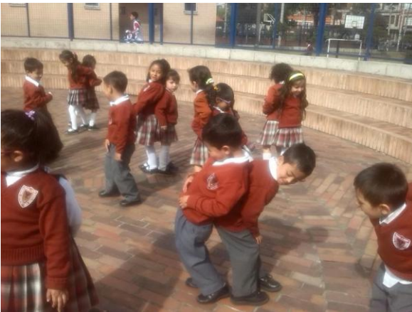
Imagen N° 1

En el primer momento se abordó un ejercicio de comparación, en el que los niños y