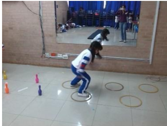
Imagen N° 26

En un segundo encuentro se realizó el ejercicio de una pista de obstáculos, utilizando herramientas como bombas, sillas, lazos y mesas, por allí los niños y niñas tendrían que cruzar, utilizando diferentes posturas con el cuerpo, además de la realización de múltiples movimientos que permitieran desplazamientos como arrastrarse, agacharse, pasar por encima, saltar y pasar rodando un espacio; el circuito comenzó pasando por medio de unos aros colgantes, dando espacio entre los estudiantes por medio de una fila, luego debían arrastrarse y saltar por encima de una silla, en este último algunos niños y niñas pasaron también por debajo.