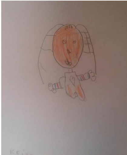
Imagen N° 6

cual podían observar todo su esquema corporal, allí se les pidió a cada uno de los estudiantes observar las diferentes partes de su cuerpo, para que se dieran cuenta de las pequeñas particularidades y características, como lunares, peinados, formas de vestir, entre otras con el fin de que plasmarán su autorretrato en una hoja blanca. en muchos de los dibujos de manera aún muy abstracta dibujan su cuerpo con las características más precisas que ellos encontraban dentro de su cuerpo, pues cada uno de ellos establece que su cuerpo es su herramienta de comunicación con el mundo, pues es el cuerpo adquiere posturas y gestos por medio de las vivencias que se tengan. En este ejercicio cabe resaltar el proceso de Keily de 5 años, una niña de transición que es afrocolombiana, que en la creación del autorretrato, ella se pinta de un color claro lo que muestra que de una manera u otra no hay un auto reconocimiento de su esquema corporal. Al