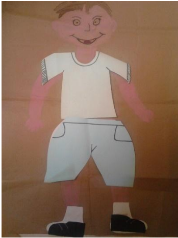
Imagen N° 15

cuanto a las maneras que tienen para relacionarse, lo que lleva a cada uno de ellos a estar en contacto dentro de una integración corporal.