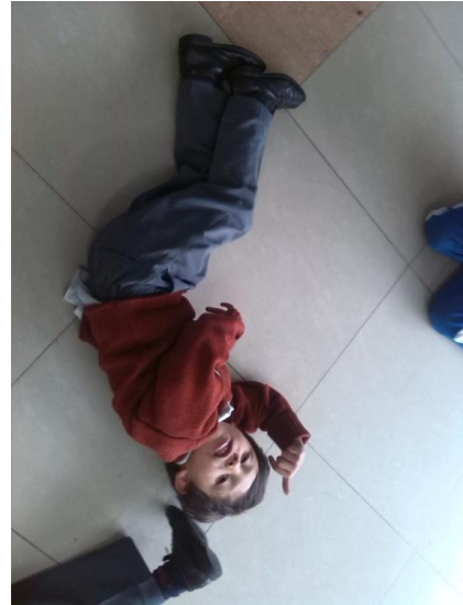
Imagen N° 21

El segundo momento consistió en hacer una escultura con el cuerpo del compañero, teniendo precauciones para no lastimar al otro con los diferentes movimientos y posturas realizadas, para esto quien hacía de la escultura debía estar quieto y flexible, es decir que su cuerpo debía estar relajado y libre de tensión para poder realizar el trabajo, al inicio del juego el niño y la niña tocaba el cuerpo del otro tímidamente pues una acción de contacto le generaba sensaciones extrañas las