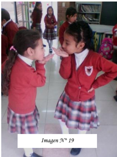
Imagen N° 19

expresivas que poseen, esto además permitan crear gozo y disfrute en el ejercicio, algo importante en la realización de esta propuesta, ya que de lo contrario perdería intencionalidad. Para que el trabajo fuera equitativo se le pide a los niños y niñas que cambien de roles lo que demuestra que en muchas ocasiones es más fácil imitar al otro o ser