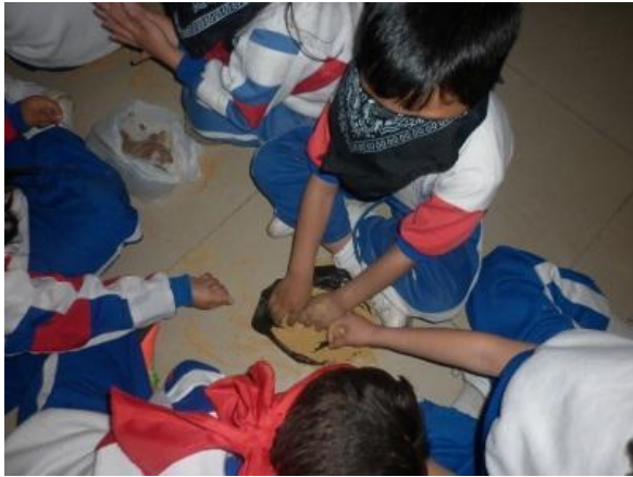
Imagen N° 24

oscuro en el cual se ubicaron los diferentes rincones pertenecientes a cada sentido, los niños y las niñas se organizaron en una fila para colocar en sus ojos una venda la cual no les permitiría ver nada, con el fin de poder desarrollar cabalmente el ejercicio, una vez todos