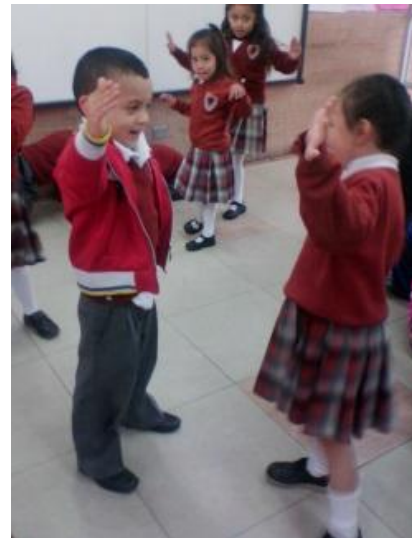
Imagen N° 18

En un primer momento del ejercicio se realiza un trabajo en parejas, el cual va direccionado a la construcción de una serie de movimientos por parte de uno de los niños, que de manera simultánea el otro niño tendrá que seguir, es decir que se da una trabajo corporal frente a la imitación, en el cual se ve reflejada toda acción creada y originada por el otro compañero, en este sentido los niños y las niñas reconocieron su cuerpo y se hicieron conscientes de los diferentes movimientos que se pueden realizar de manera individual y colectiva, aunque a algunos de los niños y las niñas se les dificultó el ejercicio, poco a poco se integraron sabiendo que para realizarlo tendrían que prestar mucha atención al movimiento del otro y poder así seguirlo, un trabajo que permitió el desarrollo de los sentidos, pues el contacto visual era constante y necesario para realizar los diferentes movimientos. Por