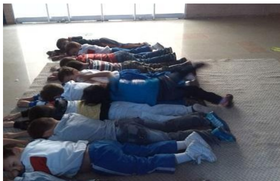
Imagen N° 31

Por otra parte, en otro momento se realizó un encuentro en donde las maestras dispusieron un tapete en el suelo en el que los niños y las niñas se tuvieron que acostar boca abajo, se le explica que uno de sus compañeros pasará rodando por encima de ellos hasta llegar al final de la fila y ubicarse en la misma posición que los demás, en un