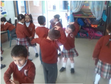
Imagen N° 17

En un primer momento del ejercicio se realiza un trabajo en parejas, el cual va direccionado a la construcción de una serie de movimientos por parte de uno de los niños, que de manera simultánea el otro niño tendrá que seguir, es decir que se da una trabajo corporal frente a la imitación, en el cual se ve reflejada toda acción creada y originada por el otro compañero, en este sentido los niños y las niñas reconocieron su cuerpo y se hicieron conscientes de los diferentes movimientos que se pueden realizar de manera individual y colectiva, aunque a algunos de los niños y las niñas se les dificultó el ejercicio, poco a poco se integraron sabiendo que para realizarlo tendrían que prestar mucha atención al movimiento del otro y poder así seguirlo, un trabajo que permitió el desarrollo de los sentidos, pues el contacto visual era constante y necesario para realizar los diferentes movimientos. Por