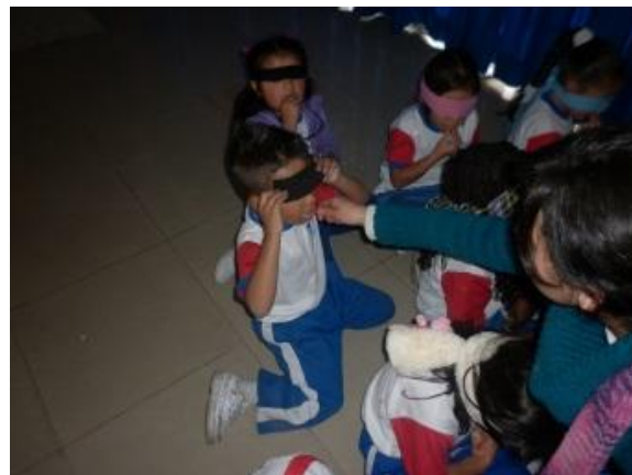
Imagen N° 25

los niños y niñas tenían su venda ingresaban al salón, en total se organizaron cinco rincones, el primero del tacto estaba organizado en media luna con unas bolsas en las que cada una de ellas se encontraba arena, algodón, gelatina preparada, tierra aserrín y pastas de sopa; en el rincón de sabores había una bandeja con sustancias, vinagre, ají, azúcar, miel, sal, gomitas y revolcones; en el rincón de olores se encontraban diferentes recipientes que contenían suavizante de ropa, hipoclorito de sodio, perfumes, alcohol y tinta de marcador; en el rincón de la visión se ubicaron imágenes con ilusiones ópticas y finalmente en el rincón de la escucha se encontraba un tapete en el cual los niños y niñas se sentaban o recostaban y escuchaban la música (había canciones de diferentes géneros, especialmente alusivos a