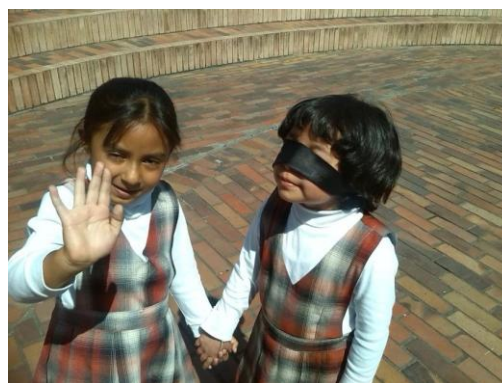
Imagen N° 33

El cuerpo entonces no es el objeto por el cual ellos se hacen presentes en un espacio, dentro del proceso llevado con ellos en cada una de las sesiones realizadas en donde el niño reconoció su cuerpo como forma de