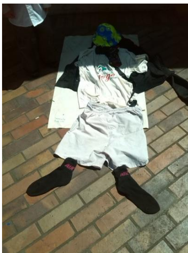
Imagen N° 14

con los niños y niñas de jardín se pudieron evidenciar diferentes aspectos sobre la concepción de género que cada uno de ellos tiene, pues a la hora de vestir la silueta los niños y las niñas encuentran una bufanda la cual genera diferentes reacciones entre ellos pues el grupo de