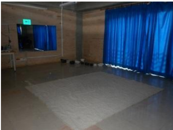
Imagen N° 23

Este taller gira en torno a la exploración sensible del cuerpo por medio de los sentidos como el tacto, el olfato, el gusto, la visión y el oído, para esto previamente al ejercicio se dispuso un espacio amplio y