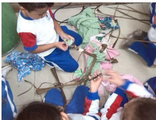
Imagen N° 37

En un cuarto encuentro se da paso a la creación un muñeco autobiográfico por parte de cada uno de los niños y niñas, para esto las maestras llevaron diferentes materiales como retazos de tela, lana de diferentes colores y hojas de palma (que les sirvieron para formar el cuerpo del muñeco), primero