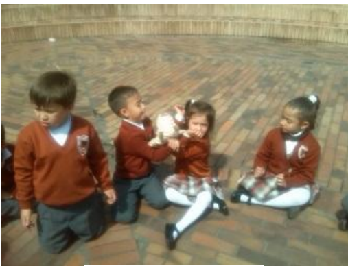
Imagen N° 10

cuerpo según como indican las maestras en formación, por ejemplo rodilla con rodilla, codo con codo, mentón con mentón, entre otros, adicionalmente se iba jugando con los ritmos y