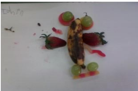
Imagen N° 36

herramientas que les brindan los elementos, como las hojas de las fresas para crear las pestañas de un rostro, el partir las gomas para dar trazos más cortos, cada uno(a) busca similitudes entre los elementos brindados y lo que querían realizar, encontrando las relaciones que hacían los niños y niñas como la que una uva pasa se parece a una hormiga, una manzana tiene forma de sol, un banano se parece a una boca sonriendo y si junto muchas uvas puedo hacer una lombriz o serpiente, todas estas expresiones demuestran que el significado que cada niño y niña da a estos objetos se encuentra estrechamente relacionando con partes de su cuerpo y con otros objetos de su entorno.