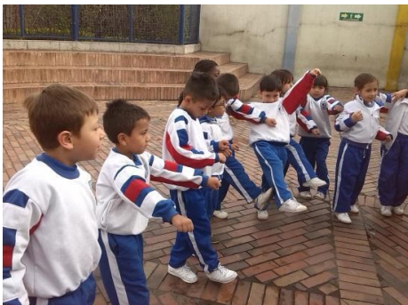
Imagen N° 8

El taller comenzó con la ronda infantil el chuchuguá, en donde se abordaba el movimiento con diferentes partes del cuerpo, utilizando varias posturas. Esta canción que dirigía movimientos como manos arriba, cabeza hacia atrás, etc. ubica al niño y