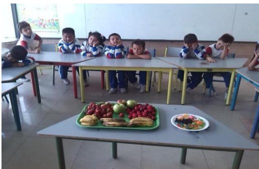
Imagen N° 34

más rápido. Es así que desde el desarrollo de esta actividad se pretendió, encontrar otras formas de exploración, creación y comunicación dentro de un espacio teniendo en cuenta que el cuerpo tiene una serie de sentidos, de los cuales usualmente se utiliza la visión, de tal forma que la mayoría de información que se tiene es recibida por este sentido.