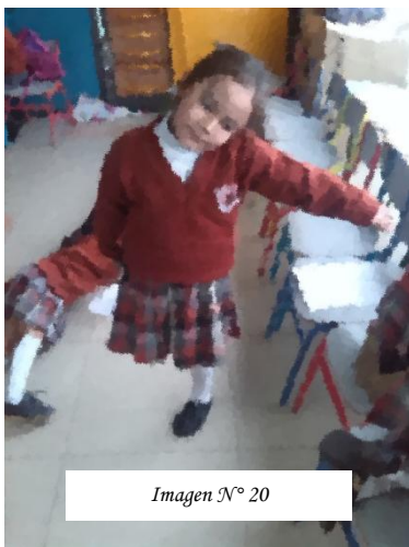
Imagen N° 20

Se establece una relación con el mundo y otros cuerpo en el que los niños vinculan y perciben formas de de relacionarse con otros pues según Porstein (2005) conocerse y conocer posibilita acciones de exploración con las partes del propio cuerpo y el de los