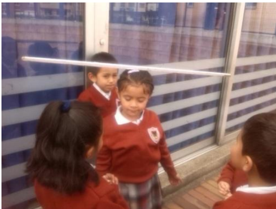
Imagen N° 11

En un tercer momento las maestras proponen utilizar algunos instrumentos hallados en el salón como un palo de escoba, un muñeco, una taza y un balón, para que según la instrucción dada los niños y las niñas tomaran y agarraran con los codos, las rodillas, la