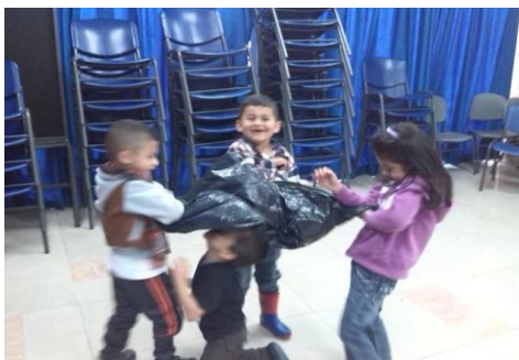
Imagen N° 30

comprender así por medio de la exploración del cuerpo movimientos mediados por la relación que se establece con diferentes objetos, pues el cuerpo se transforma según el objeto con el que esté interviniendo es decir que la manera como se involucra el cuerpo con el otro permite a los niños y niñas ubicar movimientos y explorar con ellos formas de comunicación y desplazamiento. En este sentido se les dio una hoja otro instrumento con el cual debían realizar movimientos orientados por las maestras como el arrastrarse por el espacio, sentados o caminar en círculos, esto se realizó teniendo en cuenta que no debían romper la hoja, ni tampoco dejarla caer al suelo, este ejercicio también se realizó con bolsas plásticas.