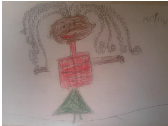
Imagen N° 7

cual podían observar todo su esquema corporal, allí se les pidió a cada uno de los estudiantes observar las diferentes partes de su cuerpo, para que se dieran cuenta de las pequeñas particularidades y características, como lunares, peinados, formas de vestir, entre otras con el fin de que plasmarán su autorretrato en una hoja blanca. en muchos de los dibujos de manera aún muy abstracta dibujan su cuerpo con las características más precisas que ellos encontraban dentro de su cuerpo, pues cada uno de ellos establece que su cuerpo es su herramienta de comunicación con el mundo, pues es el cuerpo adquiere posturas y gestos por medio de las vivencias que se tengan. En este ejercicio cabe resaltar el proceso de Keily de 5 años, una niña de transición que es afrocolombiana, que en la creación del autorretrato, ella se pinta de un color claro lo que muestra que de una manera u otra no hay un auto reconocimiento de su esquema corporal. Al