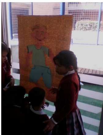
Imagen N° 12

Para comenzar este taller se reúnen a los niños y niñas en dos grupos (jardín y