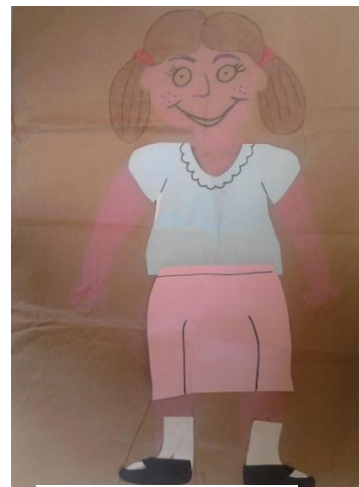
Imagen N° 16

Para finalizar este taller primero se les pidió a los niños y niñas que observaran a las figuras vestidas y que los grupos