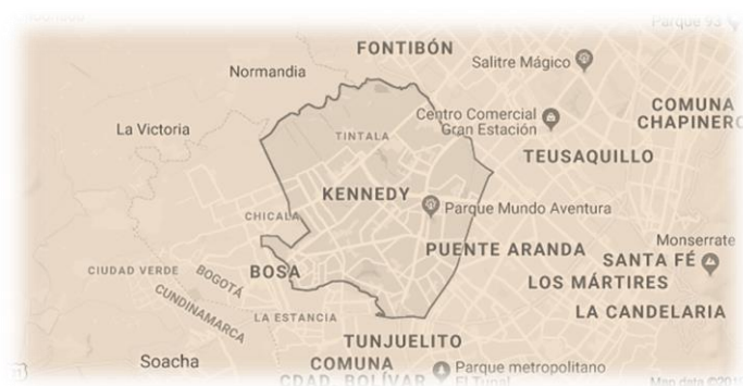
Imagen Gráfica 1 – Mapa de la localidad Kennedy.

La escuela Tribunewen queda ubicada en la ciudad de Bogotá, en la localidad número 8, denominada Kennedy. Esta localidad limita con “Fontibón al norte, Bosa al sur, Puente Aranda al oriente y un pequeño sector colinda con las localidades de Tunjuelito y Ciudad Bolívar, por los lados de la Autopista Sur con Avenida Boyacá, hasta el río Tunjuelito”. (Ver Imagen Gráfica 1)