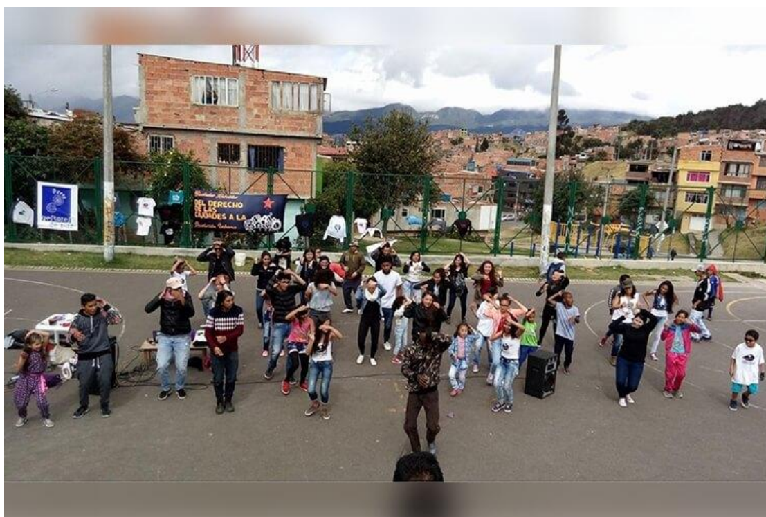
Figura 11 Con arte y memoria crece el liderazgo juvenil en Ciudad Bolívar.

Según el Centro Nacional de Memoria Histórica (2019), Youth Lead hace parte del programa mundial Changing The Story, una iniciativa que promueve el arte, la herencia cultural y los Derechos Humanos como elementos esenciales para tejer puentes en sociedades que atraviesan etapas de posconflicto. A nivel local, este proyecto es desarrollado por la Fundación Universitaria Konrad Lorenz en colaboración con la Universidad de Queen's en Belfast de Irlanda del Norte y es acompañado por la Dirección del Museo de Memoria Histórica de Colombia.