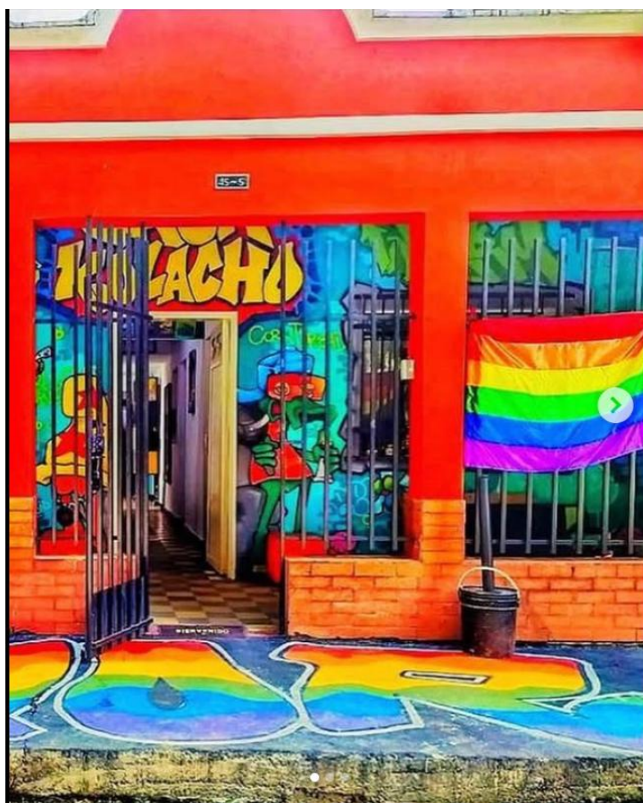
Figura 8 Imagen tomada de perfil de Graffitour Casa Kolacho en Instagram, disponible en https://www.instagram.com/p/CuDdax8RrHn/?hl=es&img_index=1

En Medellín, el Graffitour de Casa Kolacho en la Comuna 13 se ha convertido en una experiencia artística y pedagógica que transforma los muros en lienzos de memoria y resistencia. Este proyecto nació como respuesta al conflicto armado y las operaciones militares que marcaron a la zona. A través del graffiti, los jóvenes han resignificado el territorio, contando historias desde su propia voz, no desde la mirada externa. Lo que comenzó como una forma de expresión callejera, hoy es un proceso comunitario que le apuesta a la paz desde el arte. Además, se ha convertido en un referente turístico, pero sin perder su sentido crítico y barrial (Casa Kolacho, 2023).