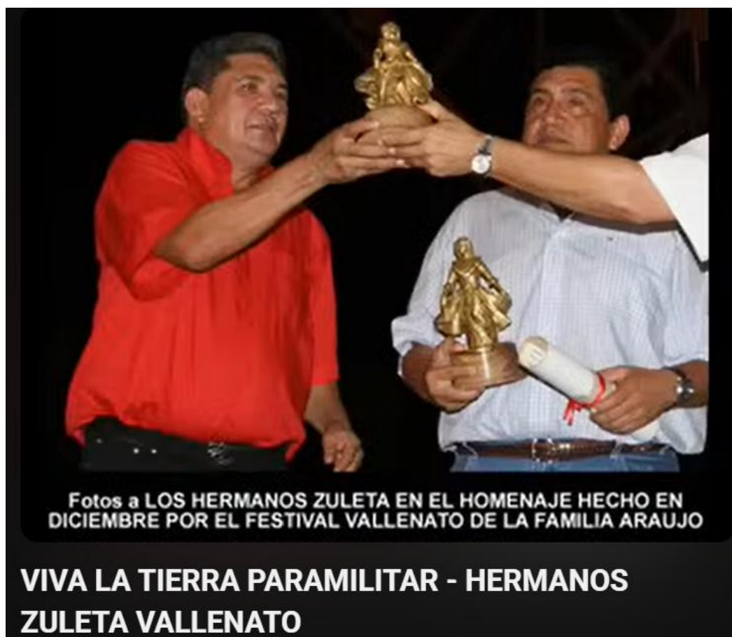
Figura 1 Imagen tomada de video de la canción “Viva la tierra paramilitar” creada presuntamente por los hermanos Zuleta, disponible en https://www.youtube.com/watch?v=00o_B9X0gZo

Al hablar de la danza, el ballet ha sido históricamente asociado a las élites. Originado en las cortes europeas, este arte ha mantenido estándares que excluyen a quienes no se ajustan a ciertos perfiles físicos o socioeconómicos. Aunque en los últimos años ha habido esfuerzos por diversificarlo, todavía existen barreras que dificultan el acceso y la representación de grupos marginados, especialmente por razones de clase, raza o corporalidad (The Boar, 2020).