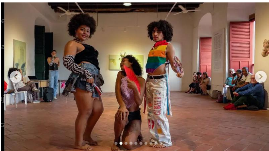
Figura 10

danza de origen afro y queer, con los ritmos urbanos del Caribe colombiano. Esta mezcla no solo rompe con lo tradicional, sino que también da lugar a nuevas formas de resistencia desde lo estético y lo corporal. En sus presentaciones, además de mostrar movimientos con mucha técnica y energía, también hacen una declaración política sobre las identidades disidentes y racializadas. En una ciudad donde todavía hay mucha discriminación, este tipo de expresiones se vuelven necesarias para reclamar espacio y voz (Voguea Aleteo, 2023).