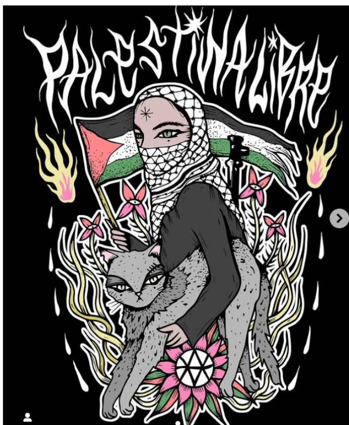
Figura 5

En Chile también hay colectivos que mezclan el arte con la crítica social. Uno de ellos es Muérdago Taller, un grupo que hace serigrafía, grabado y murales con mensajes que invitan a pensar diferente. Sus ilustraciones no son solo decorativas, sino que transmiten ideas sobre la naturaleza, el caos, lo político y lo espiritual. Ellos trabajan de forma autogestionada, alejados del arte comercial, lo que les permite tener una postura más libre y crítica frente al sistema (Sour Magazine, 2019). Su estilo tiene algo de rebelde, pero también de poético y es una forma de mostrar que el arte puede ser una herramienta para expresar lo que muchos sienten y no siempre pueden decir.