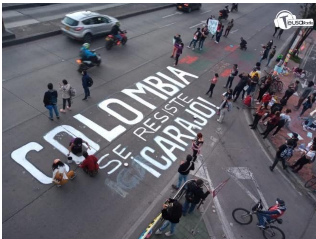
Figura 14 Grafiti en Colombia, Paro Nacional.

Otra expresión contracultural es el grafiti. En el Paro Nacional en Colombia iniciado en el 2019 se han generado distintas muestras de este arte a lo largo del territorio nacional y es que su mensaje puede llegar a ser tan diciente que es un referente importante dentro de las movilizaciones generadas en dicha coyuntura. Muchos “parches”, colectivos e individuos toman el grafiti como una vía, como una oportunidad de mostrar y sentar una posición frente a diversas situaciones. En el Paro Nacional, no solo se vieron las paredes rayadas con distintos mensajes sino también muestras más grandes, llenas de esfuerzo y mucho talento.