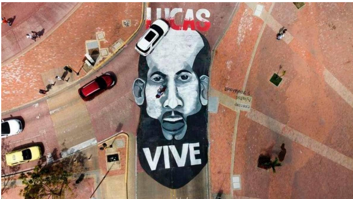
Figura 15 Paro nacional: el arte también se tomó el pavimento de Cartagena.

Así mismo, el punk y el rock nos sirven como ejemplo para ver cómo la contracultura puede funcionar en dos niveles distintos: en primera medida como un discurso que critica la cultura hegemónica y plantea otro tipo de representaciones culturales, desde el punto de vista de la religión, la política, lo social y; en segunda medida como alternativa frente a las formas de consumo cultural. Un claro ejemplo de ello es la posición antirreligiosa que ejerce la agrupación Revolver con su canción “Cielo o Infierno” (2016) en la cual dicen: