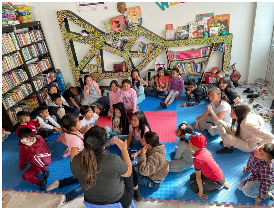
Figura 12 Fotografía de la página de Facebook de la Biblioteca comunitaria Violetta, 2023, disponible en https://www.facebook.com/photo/?fbid=934952494615576&set=a.833020681475425

Ahora bien, Violetta se enmarca también de manera fuerte en un componente cultural debido a que, según los autores: