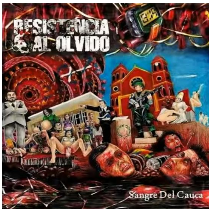
Figura 9 Imagen tomada de video lyric de la canción Acribillar de Resistencia al Olvido, disponible en https://www.youtube.com/watch?v=0MCUY9KEyb0&ab_channel=Psychophonyrecords

Por otro lado, en el Valle del Cauca, el metal también ha sido una vía para expresar inconformidad. La banda Resistencia, agrupación de death metal, utiliza letras que cuestionan el sistema y visibilizan realidades sociales que muchas veces no se mencionan en los discursos oficiales. Su sonido es crudo y directo y eso conecta con jóvenes que sienten frustración o rabia frente a lo que pasa en sus territorios. No se trata solo de música fuerte, sino de una forma de posicionarse frente a lo que se vive. En su canción “Fragmentos de Muerte”, por ejemplo, se pueden percibir referencias al dolor colectivo, a la muerte y a la represión estatal, mostrando cómo el metal también puede ser político (Psychophony Records, 2023).