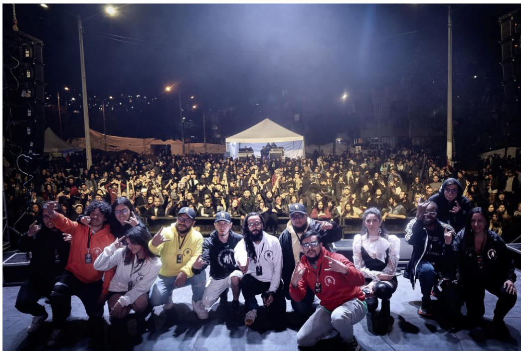
Figura 13 Fotografía de la página de Facebook del Movimiento Rock, 2023, disponible en https://www.facebook.com/photo.php?fbid=252255420857992&set=pb.100082206079076