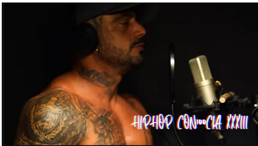
Figura 3 Imagen tomada de video de la canción HIPHOP CON100CIA - Al2 El Aldeano (#33) , disponible en https://www.youtube.com/watch?v=tjm8JM7P5rY&ab_channel=AL2%22ElAldeano%22

En Cuba, el rapero Al2 "El Aldeano" ha sido una voz crítica del sistema político. A través de sus canciones, aborda temas como la censura, la pobreza y la falta de libertades, desafiando el discurso oficial y dando voz a quienes no la tienen. Su música se ha convertido en un símbolo de resistencia para muchos jóvenes cubanos que buscan un cambio en su realidad.