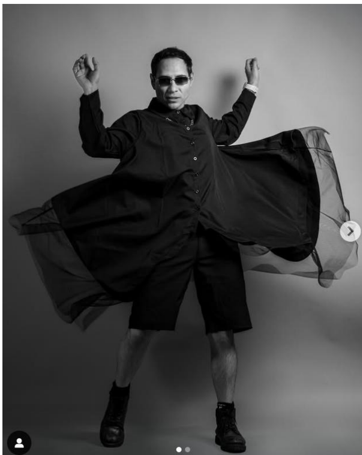
Figura 7 Imagen tomada de perfil oficial del grupo The House of Machos en Instagram, disponible en https://www.instagram.com/p/DJ-m-BxULSm/?hl=es&img_index=1

En conjunto, estas manifestaciones artísticas en América Latina demuestran cómo las juventudes utilizan el arte como una herramienta poderosa para cuestionar, resistir y transformar su realidad. A través de la música, el arte urbano y el performance, construyen espacios de expresión y lucha que desafían las estructuras de poder y promueven una cultura más inclusiva y diversa.