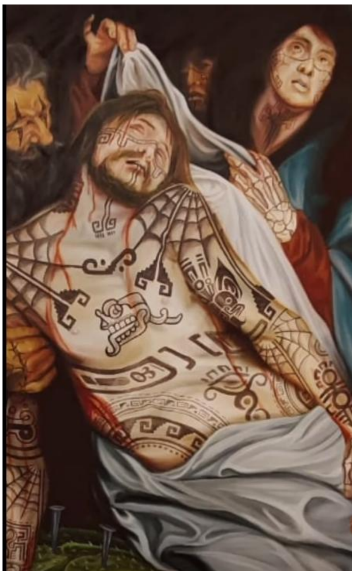
Figura 4

El colectivo Tlacolulokos, originario de Oaxaca, México, utiliza el arte urbano para rescatar y revalorar la identidad mexicana. Sus murales, que combinan elementos tradicionales con la estética más actual, buscan romper con los estereotipos y mostrar la cultura indígena en un contexto urbano. A través de su trabajo, transforman los muros en lienzos que cuentan historias de resistencia y orgullo cultural.