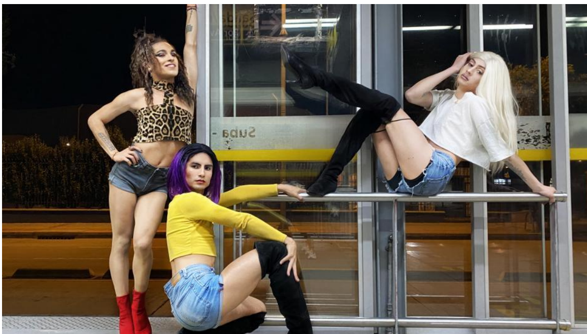
Figura 16 Grupo Vogue, Fotografía por el periódico El Tiempo, 2021, disponible en https://www.eltiempo.com/bogota/vogue-la-cultura-detras-del-baile-en-transmilenio-que-se-hizo-viral-582783

importancia que subyace de entender que hay muchas personas que tienen mucho que decir y que logran a través de muestras particulares expresar sus opiniones, sentires y hasta ideologías políticas.