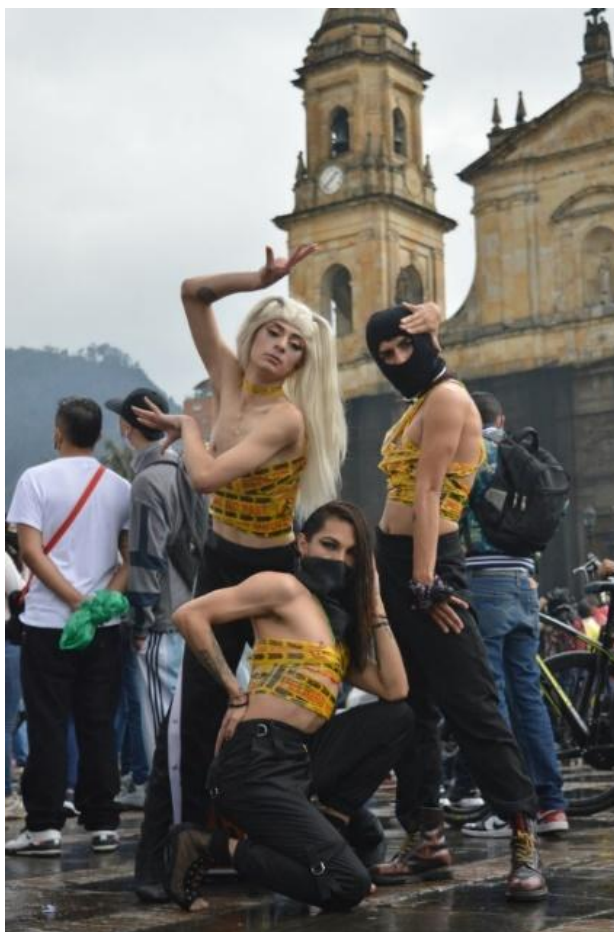
Figura 17 Grupo Vogue, Fotografía por el periódico New York Times, 2021. Disponible en https://www.nytimes.com/es/2021/05/31/espanol/vogue-colombia-protestas.html

Estos colectivos bailan no para entretener, sino para existir plenamente en un mundo que muchas veces prefiere negarles su lugar.