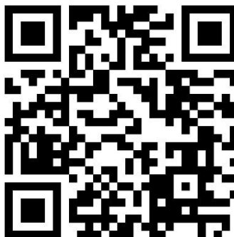
Figura 18 QR Aula virtual de Aprendizaje

Enfoque crítico: Consolidar la conciencia crítica y reconocer que la cultura, el arte y la educación son herramientas para imaginar futuros más justos.