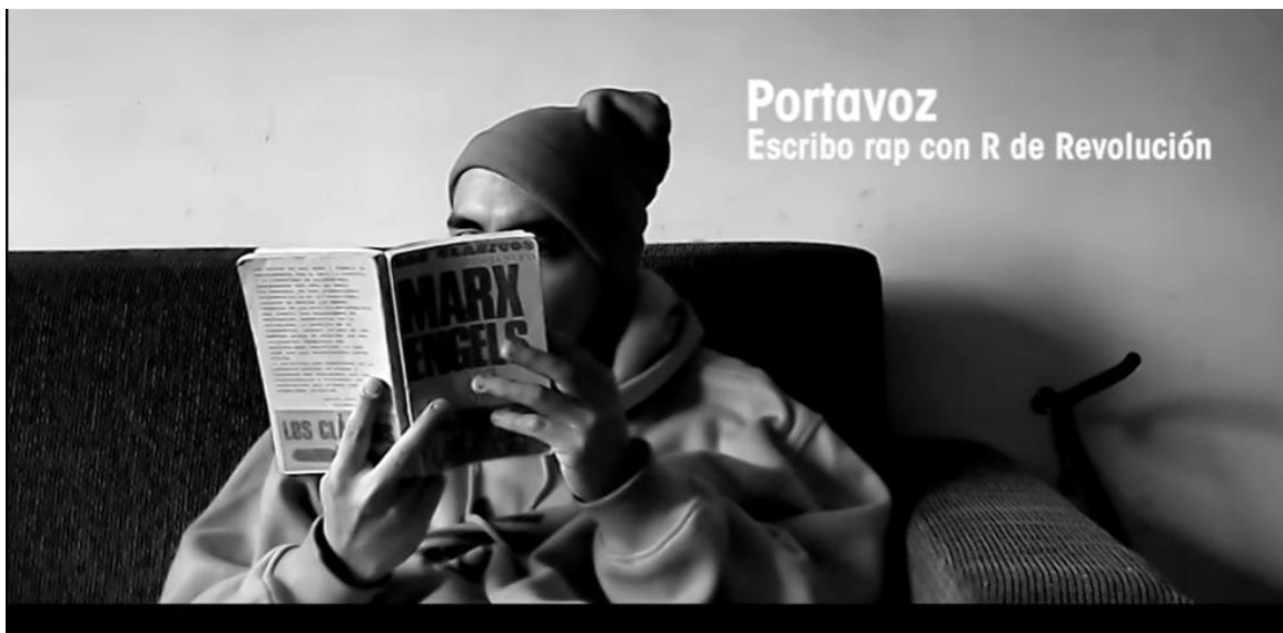
Figura 2 Imagen tomada de video de la canción Escribo Rap con R de Revolución de Portavoz, disponible en https://www.youtube.com/watch?v=HX4U6Umv99g&ab_channel=el poc

En Cuba, el rapero Al2 "El Aldeano" ha sido una voz crítica del sistema político. A través de sus canciones, aborda temas como la censura, la pobreza y la falta de libertades, desafiando el discurso oficial y dando voz a quienes no la tienen. Su música se ha convertido en un símbolo de resistencia para muchos jóvenes cubanos que buscan un cambio en su realidad.