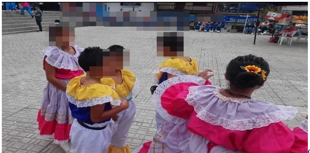
Baile semana recreativa Tamborcito Chocoano.