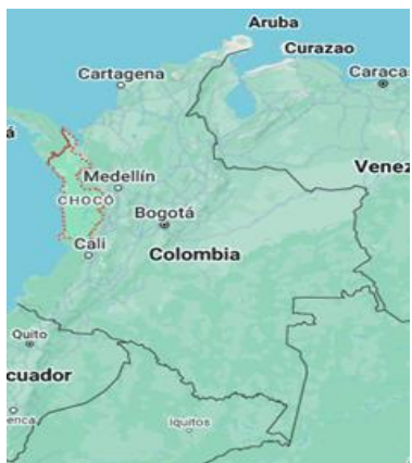
Ubicación del departamento de Chocó en el territorio colombiano