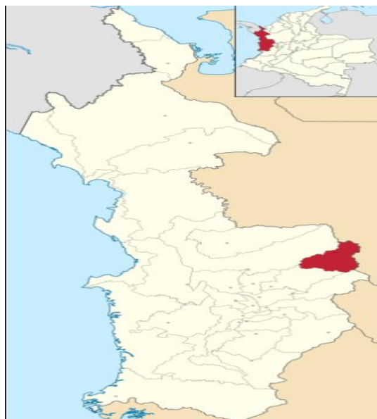
Departamento del Chocó