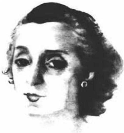
Ilustración 5: Mercedes Rodrigo

A continuación se pueden apreciar dos de las fotos más reconocidas de la Psicóloga y directora del Departamento de Psicotecnia de la Universidad Nacional de Colombia, la primera corresponde al año de 1952 es de pertenencia del psicólogo colombiano Rubén Ardila y la segunda fue tomada en 1949, (Ilustración 5 166 e Ilustración 6 167 ).