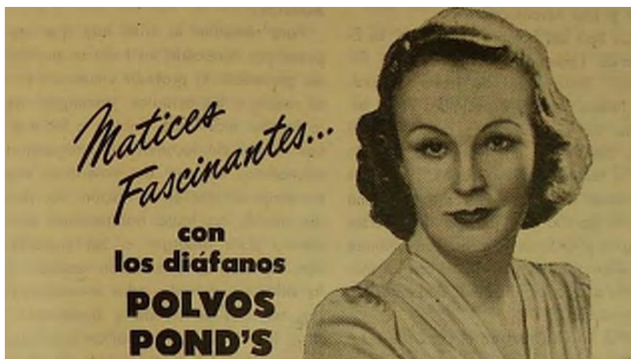
Ilustración 1: Publicidad marca POND'S

Y es que estos anuncios vienen de la industria de cosméticos que intentan responder a una de las nociones más importantes de la época “la felicidad de la mujer” 38 ; esta era una estrategia para configurarla como un sujeto bello, agradable e íntegro a la vista de los demás pues para sentirse plena era fundamental que no tuviera reparos en asumir las diferentes condiciones que tal discurso proponía mientras hacía uso de los múltiples productos para alcanzar tan anhelada meta.