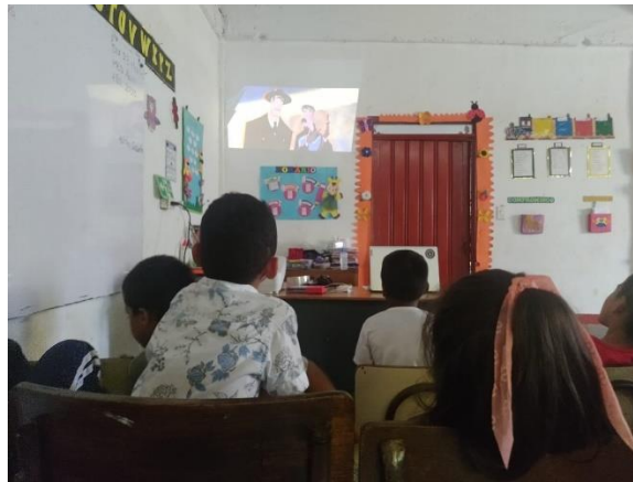
figura 3 Desarrollo de grupos interactivos

las interacciones y apoyar a los estudiantes en ejercicios y actividades orientadas al desarrollo de habilidades y competencias. Los Grupos Interactivos se centran en abordar las desigualdades educativas para mejorar el aprendizaje de los estudiantes involucrados, se ha comprobado que los Grupos Interactivos son una de las acciones más exitosas implementadas en dichas instituciones (CREA, 2019).