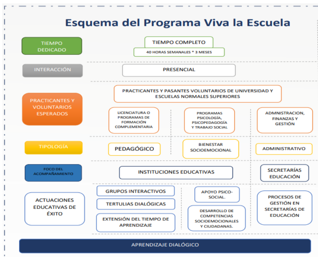
figura 1 Esquema del programa Viva la Escuela

Comunidades de aprendizaje, tertulias dialógicas literarias, grupos interactivos, proyecto de comunidades de aprendizaje y la sociedad de información, transformación de la escuela. Aprendizaje dialógico y concepción comunicativa del aprendizaje.