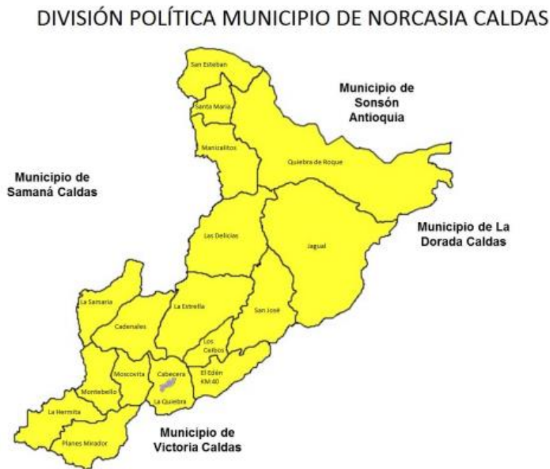
figura 6 División política de las veredas del municipio de Norcasia

aunque no está completamente tecnificada hoy. Hay extensas áreas de pastoreo disponibles para llevar a cabo esta actividad. Por otro lado, el sector industrial en el municipio es limitado, mayormente constituido por la ebanistería y la mecánica automotriz.