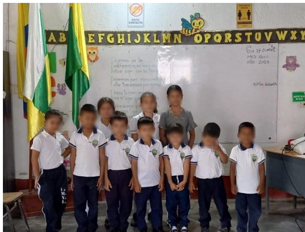
figura 2 Desarrollo de las actuaciones educativas de éxito

escolar y fomentar la convivencia pacífica y actitudes solidarias en las escuelas evaluadas. En línea con las teorías científicas internacionales, concuerdan en que existen dos factores fundamentales para el aprendizaje en la sociedad actual: las interacciones y la participación de la comunidad. Las AEE han demostrado su efectividad en diversos contextos educativos y sociales, y recientes investigaciones respaldadas por la comunidad científica internacional han reafirmado esta afirmación. Por consiguiente, en numerosos países europeos y latinoamericanos se han incorporado en las directrices de política educativa como medida para combatir la disparidad en la educación.