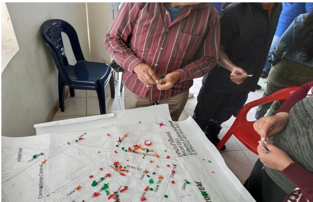
Fotografía 2. Mapa Barrio Santa fe. Fuente Fundación Procrear. 2023

Se tiene en cuenta también que los patrullajes de la policía recaen especialmente a gente del común, transeúntes, vendedores ambulantes y recicladores, lugares o sectores en donde se percibe una mayor población habitante de calle, más no en los puntos donde los jibaros hacen de su esquina un control territorial, cooptado por el miedo y la violencia, ejerciendo todo mecanismo como la presión, persecución, la intimidación y sobre todo la amenaza que transita en todo el sector. Del mismo modo, si observamos que no solo hay un tipo de violencia ejercida en el habitante de calle, sino que, como consecuencia de ello, se generan muchas más violencias incorporadas y que según como lo expresa el autor Johan Galtung (2009): “(...) violencia directa, física y / o verbal es visible en forma de conductas)” (p.15), en este caso se pone en evidencia la reacción por parte de los sujetos de la olla 10 o del roto 11 , quienes controlan las calles y el expendio de droga. Estos sujetos agreden a quienes no