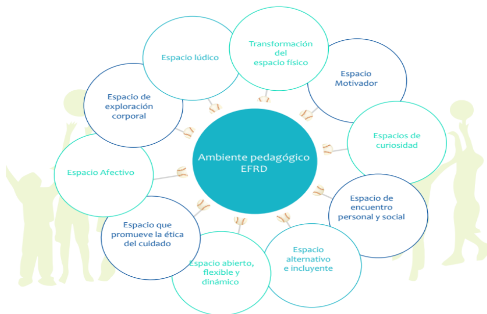
Figura 1. Componentes de un ambiente pedagógico en Educación física, Recreación y Deporte (EFRD)

Cuando se habla de ambientes pedagógicos en la educación física, hay diversos factores que componen estos ambientes, componentes que determinan y le dan forma a las intenciones pedagógicas presentes dentro del espacio de encuentro académico. A continuación, se expone una gráfica (figura1) perteneciente al documento de orientaciones curriculares para la educación física que, a la fecha, son las orientaciones vigentes dentro de nuestro territorio nacional.