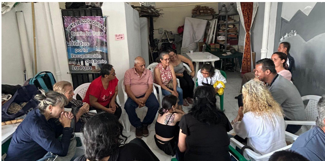
Ilustración 8 . Participantes en el primer convite, diálogos entre personas con discapacidad visual (PcD) y cuidadoras frente a lo que el territorio les comunica.

aprovecharon el espacio para ofrecerlos. Fue un éxito, no solo por las ventas, sino por la solidaridad que se tejía. Se supo que lo hacían para poder costear el pasaje de vuelta a casa y quizá el de volver al próximo encuentro. Y esa red de apoyo mutuo tan poderosamente orgánica lo decía todo.