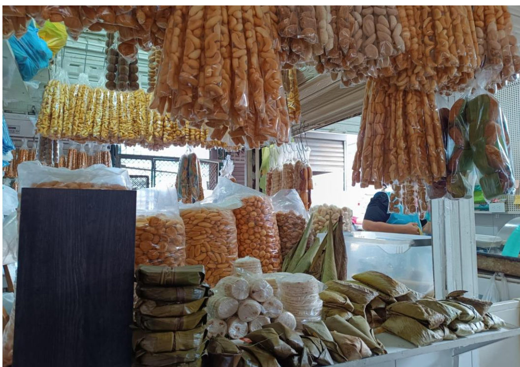
Ilustración 7 Mercado de la plaza de la 21. Cata de los diferentes bizcochos que realizan y venden en los municipios del Tolima