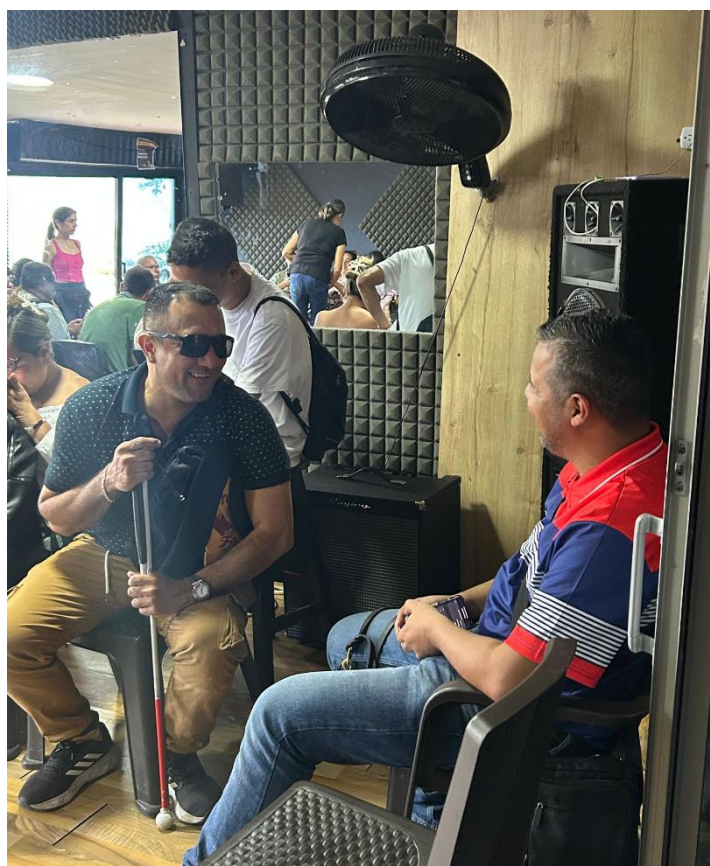
Ilustración 20 . Participantes dialogando, intercambiando chistes, risas e ideas.

Así, el insumo que emerge de esta investigación se configura como un aporte significativo para la construcción de futuras políticas públicas en el territorio de Ibagué, orientadas al reconocimiento y la inclusión de las personas con discapacidad visual.