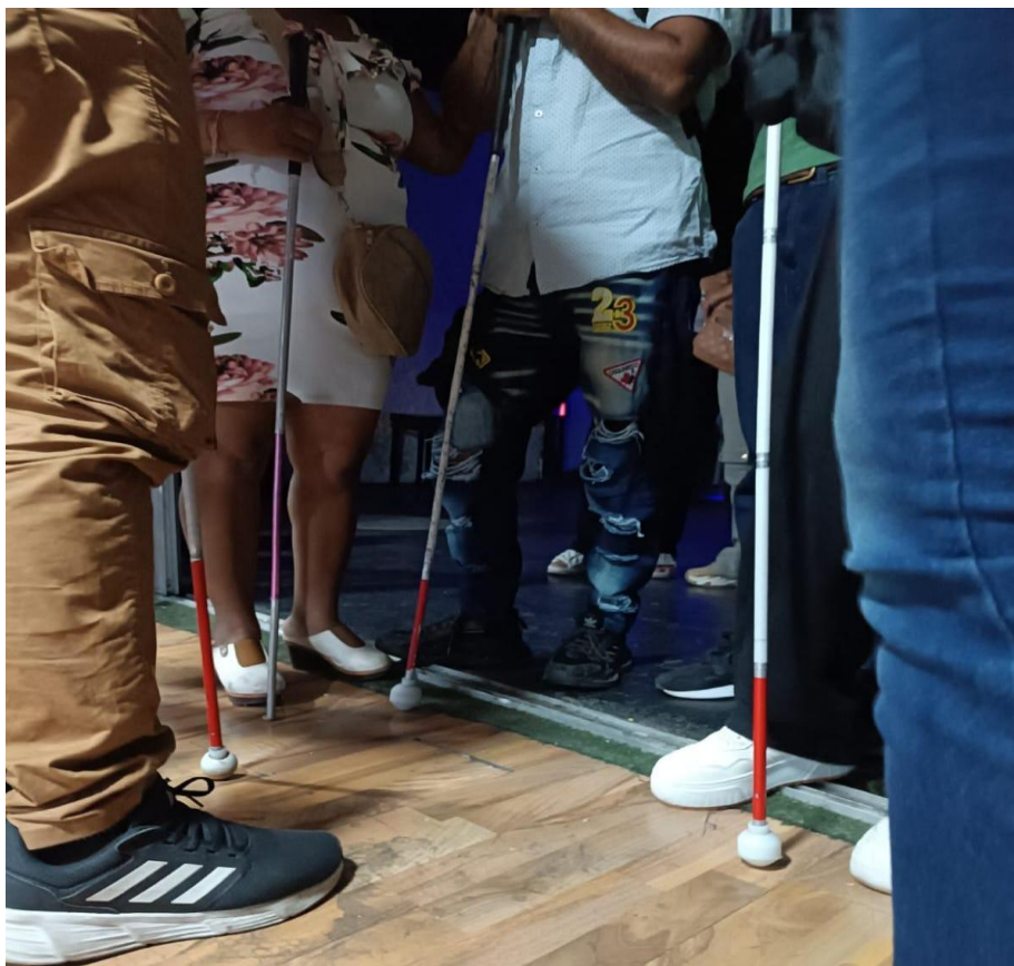
Ilustración 2 Zapatos y bastones de participantes del proceso de investigación. Segundo convite

Nota. Registro fotográfico del equipo investigador (2025)