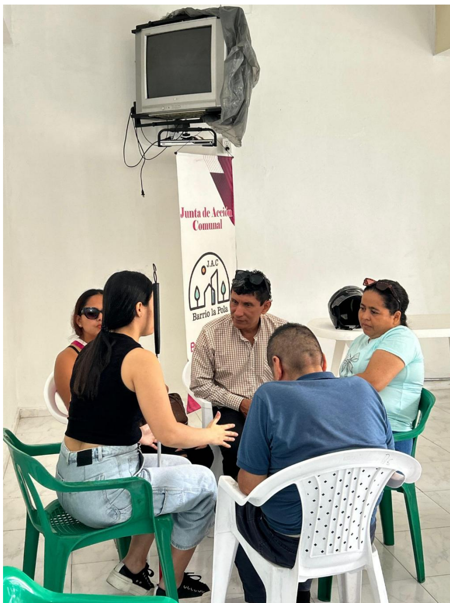
Ilustración 19 Círculo de personas compartiendo ideas que fortalezcan el vínculo