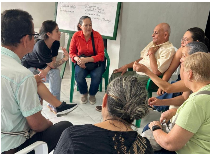
Ilustración 16 Tercer convite, diálogo dado entre una de las investigadoras y uno de los comités que surgieron.

Nota. Registro fotográfico del equipo de investigación. (2025)