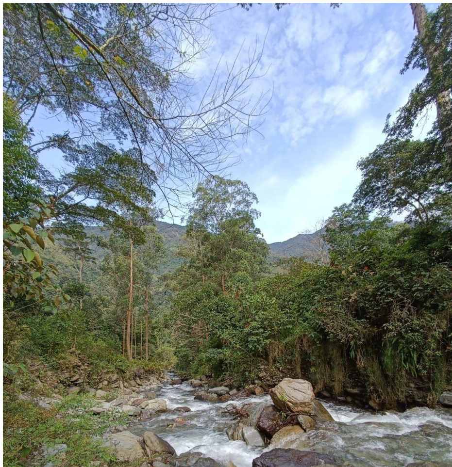
Ilustración 4 Cañón del río Combeima. Corregimiento juntas de Ibagué, Tolima.

Nota. Registro fotográfico del equipo investigador (2025)