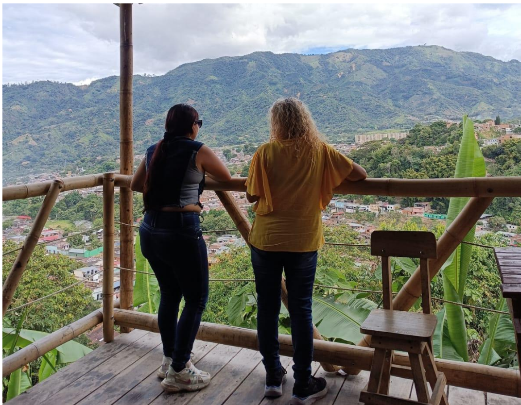
Ilustración 5 Participantes del proceso de investigación. Balcón posterior de House Music Nota.