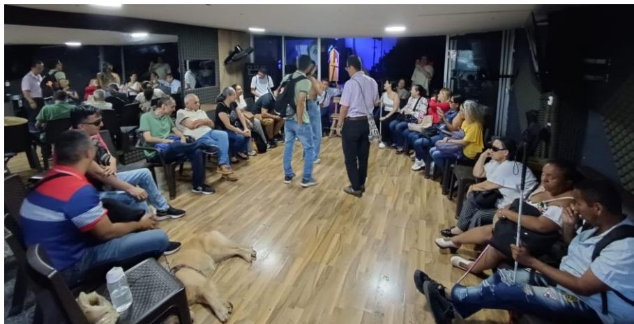
Ilustración 13 Segundo convite en Hosue Music compartiendo ideas y alimentos.

conociéndose y compartiendo, se dirigieron a un café cercano para prolongar ese momento de cercanía y curiosidad.