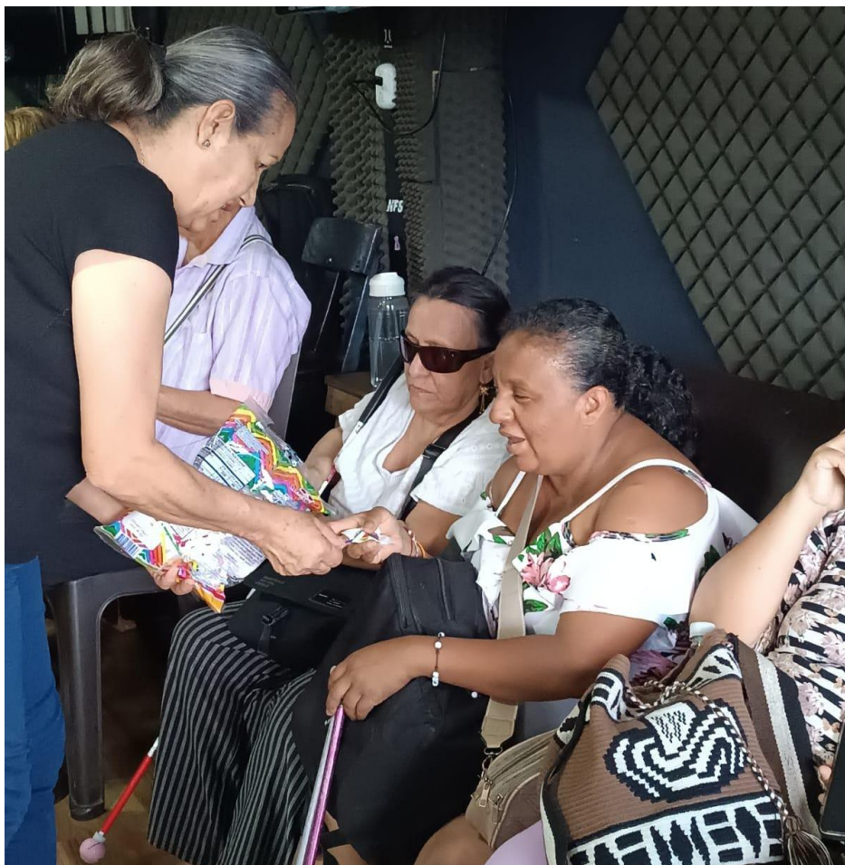
Ilustración 11 Cuidadora compartiendo dulces con participantes del segundo convite

Nota. Registro fotográfico del equipo de investigación. (2025)