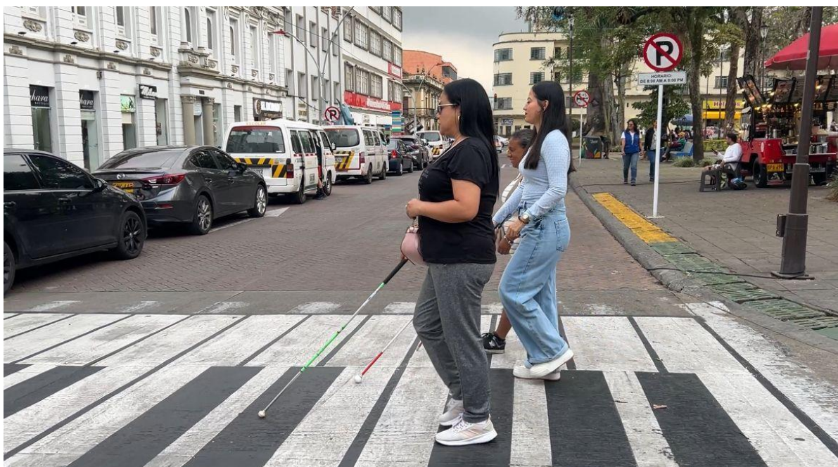
Ilustración 3 Mujeres participantes cruzando la calle para llegar al convite

En ese sentido, resultó fundamental comprender, desde una perspectiva histórica, cuál ha sido la trayectoria de las personas con discapacidad visual y cómo están situadas en la actualidad. Por un lado, es necesario reconocer que la discapacidad no es un asunto que concierne únicamente a quienes la viven, sino que exige un ejercicio colectivo de sensibilidad histórica y ética por parte de toda la sociedad. Por otro lado, es importante entender que, a lo largo del tiempo, las civilizaciones han construido significados sobre la discapacidad que hablan más de las estructuras sociales, culturales y políticas que los generan, que de las personas que lo viven.