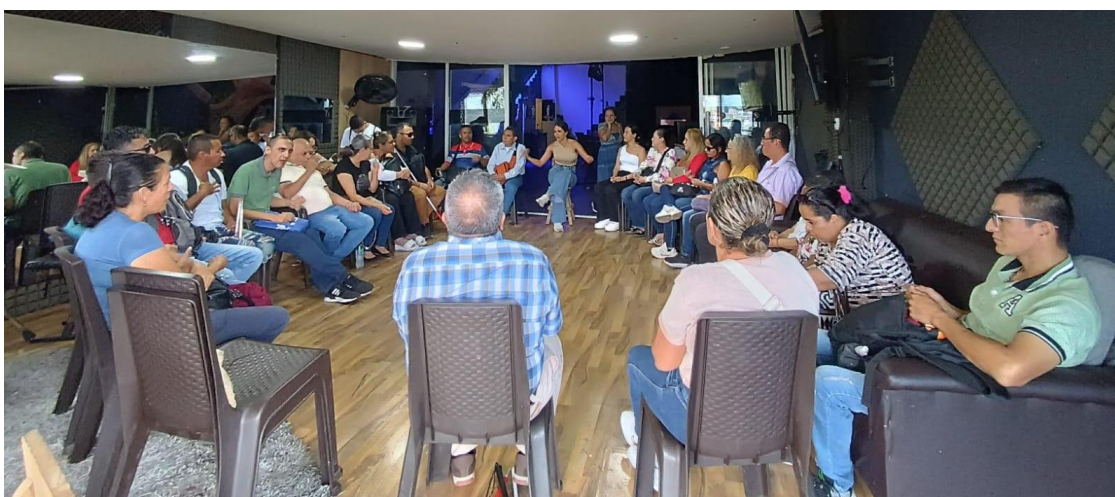
Ilustración 21 Convite tres, ideas y reflexiones

La proyección de este proceso abre un “continuará” inevitable. Los convites, resignificados como práctica cultural y política, no se agotan en el marco de la investigación: pueden sostenerse en el tiempo como espacios de encuentro, de formación crítica y de resistencia frente al individualismo y la exclusión. El vínculo que emergió en estos espacios se proyecta como semilla de futuro: invita a consolidar propuestas colectivas, fortalecer redes de apoyo, exigir derechos, imaginar territorios más accesibles y participar activamente en la vida política de la ciudad.