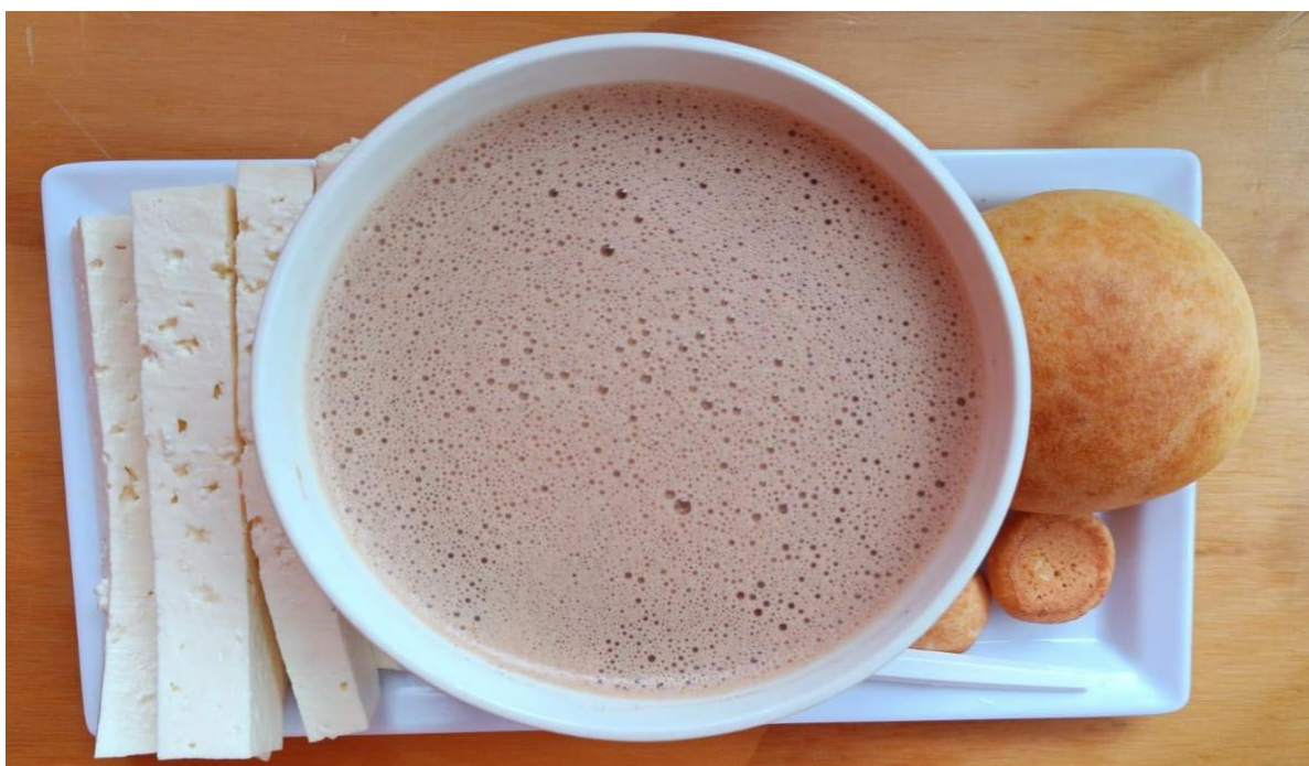
Ilustración 9 . Desayuno compartido por las investigadoras. Migao, plato tradicional y con fuerte arraigo campesino.

Uno de los investigadores se despidió ese mismo día para regresar a Bogotá, ya que, debía cumplir unos compromisos; otra de las investigadoras que había madrugado ese día para llegar a Ibagué decidió quedarse un poco más, conocer el territorio que pisaba por primera vez y dejarse tocar por la historia de estas tierras, ya que, esas tierras cálidas con olor húmedo empezaban a habitar también su corazón. Al día siguiente todo empezó muy temprano, fueron a remojarse al cañón del Río Combeima para disfrutar de los primeros rayos