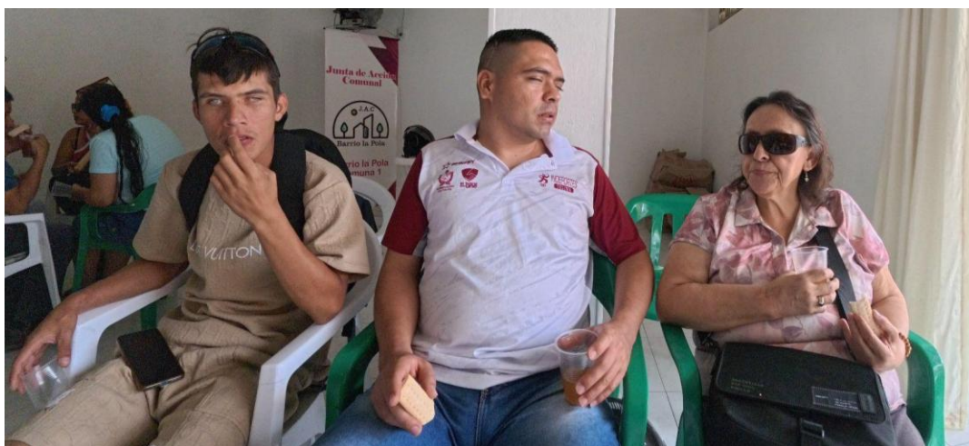
Ilustración 1 Participantes del proceso investigativo, tercer convite

describe el convite como "la reunión de varias personas donde se hace algún alimento, se prepara una comida, reparten y todos participan de ese convite" (comunicación personal 1, 5 mayo 2025).