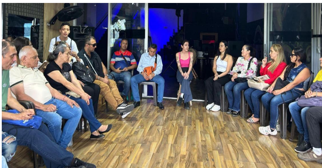
Ilustración 10 Círculo de la palabra en el segundo convite con los participantes del proceso investigativo

A pesar de todo, lo que emergió de ese momento fue una reflexión poderosa: el camino debía seguir con quienes realmente quisieran andar, con personas que estuvieran dispuestas a seguir tejiendo desde el compromiso y la presencia. Esa certeza, lejos de debilitar, fortaleció al colectivo, porque lo que se estaba construyendo no dependía de una sola persona, sino de la voluntad compartida de avanzar en juntanza.