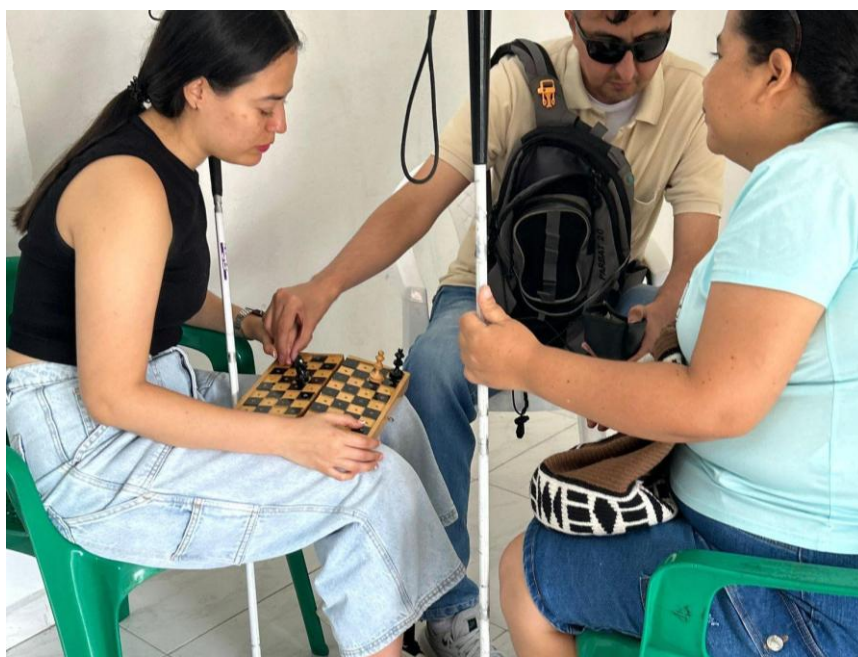
Ilustración 17 Tres participantes del convite, están aprendiendo y jugando ajedrez adaptado.

La escena era casi poética: se explicaba con calma la función de cada pieza, mientras las otras personas escuchaban con atención, reconociendo en el movimiento del alfil o en la fuerza del peón, una nueva forma de descubrir el mundo.