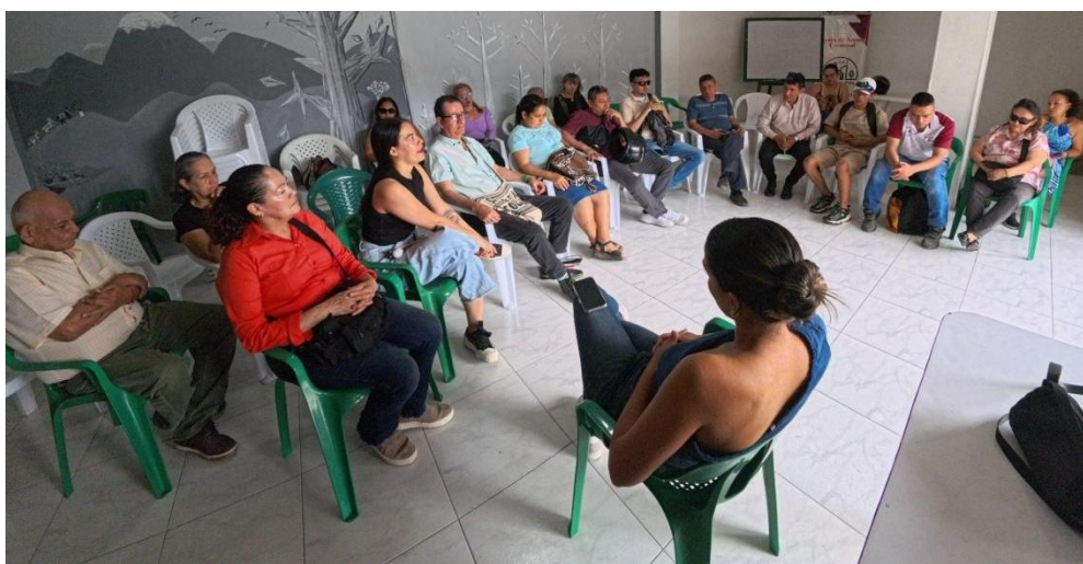
Ilustración 14 Tercer convite, Investigadora realizando grabación de voces

Este convite fue distinto. Por primera vez, el reloj nos convocaba en la mañana porque era el espacio en el que el salón comunal estaba disponible. Cambiar el horario fue un salto hacia lo inesperado. Esto ocasionó que algunas personas no pudieran asistir, ya que, tenían compromisos laborales o personales que atender, pero otras llegaron, rostros nuevos atraídos por el rumor de algo que se estaba gestando con amor y constancia.