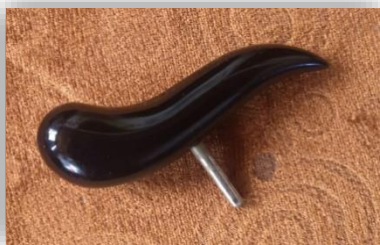
Ilustración 55: Caballote.

Ayuda al fagotista a estabilizar la mano derecha mientras toca, parecida a una comilla, el tornillo de pulgar permite fijarlo a la culata.