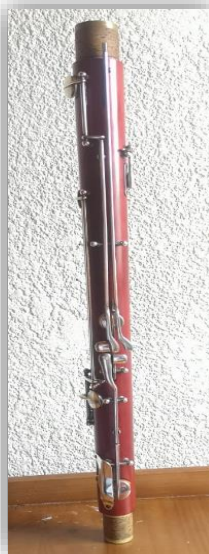
Ilustración 77: Tubo bajo.

El tubo bajo es el que permite llegar a las notas más graves del instrumento,