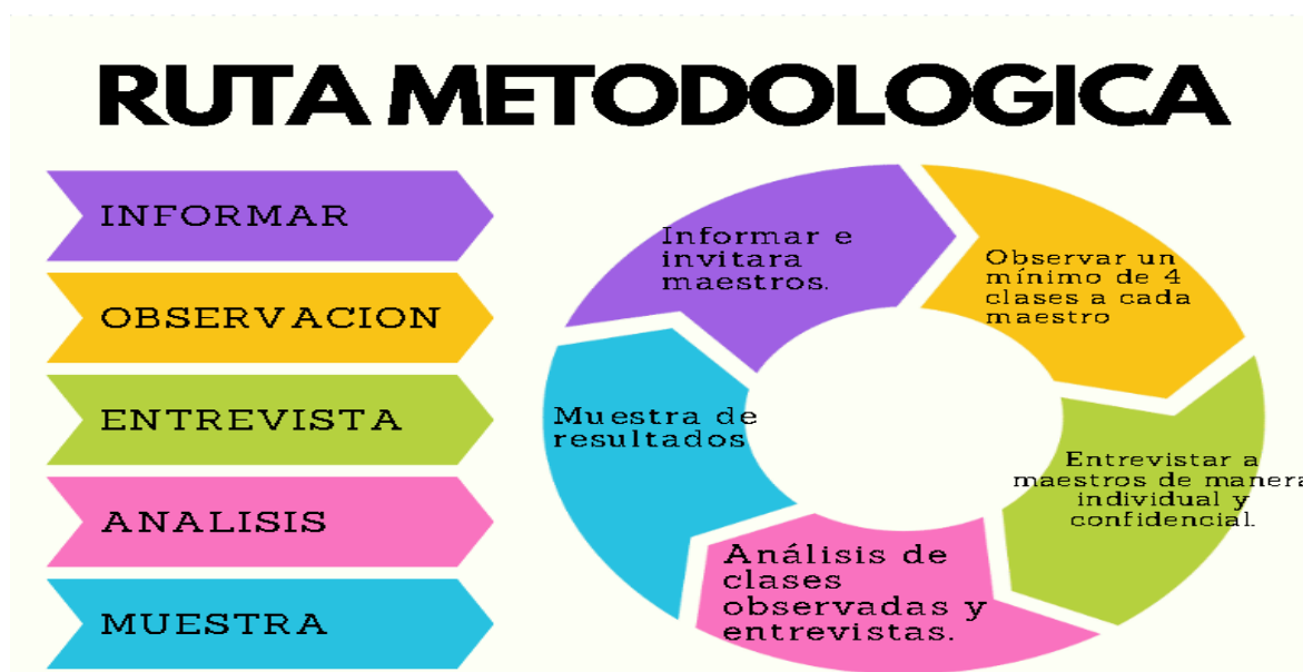
Ilustración 1 Ruta metodológica

maestros que están enseñando, se seleccionaron dos maestros quienes al presentarles la propuesta de trabajo de grado estuvieron muy dispuestos a colaborar con el mismo, con ellos se realizó 4 observaciones de clases con cada uno en sus respectivas universidades y al finalizar el periodo de observación se le hizo la entrevista semi estructurada, los maestros citaban en sus respectivas horas y se tomaba registro escrito de lo que se vivía en la clase en ese momento.