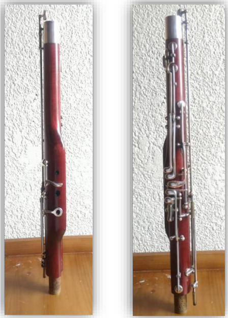
Ilustración 88: Tubo tenor.

Esta sección tiene agujeros estratégicamente colocados y un delicado entramado de llave o varillas, está construido tanto por agujeros y por llaves.