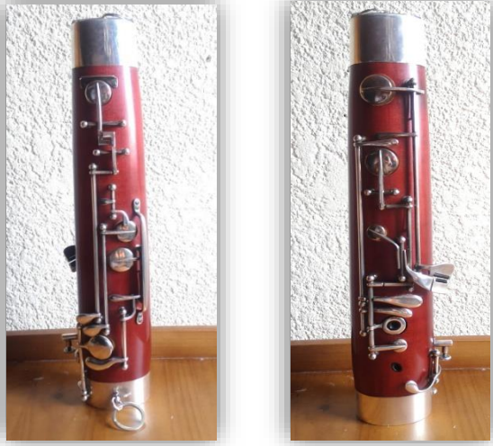
Ilustración 33: Culata.