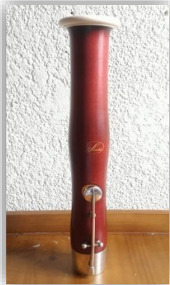
Ilustración 99: Campana.