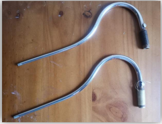
Ilustración 44: Tudel.