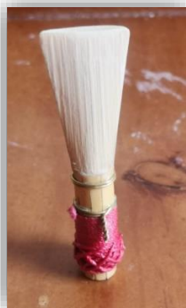
Base de la caña.

el sonido y en el instrumento, usualmente es muy reemplazada ya que están hechas por un material orgánico que puede llegar a desgastarse o rajarse.