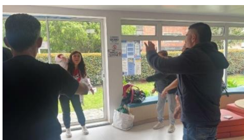
Foto 2. Taller de fortalecimiento familiar Casa de La Madre y el Niño.

Para mí, la Casa ha sido una verdadera escuela, donde he aprendido no solo a ser mejor profesional, sino también a ser más humana.