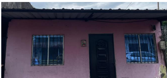
Foto 4. Hogar de la tía en Ecuador.

Meses después, el Bienestar volvió a recogerlos. Yo me escondí por miedo, pero mi tía me dijo que no tenía dinero y que lo mejor era que me fuera. Salí de mi escondite y me subí a la camioneta con más miedo y ansiedad que cualquier otra cosa.