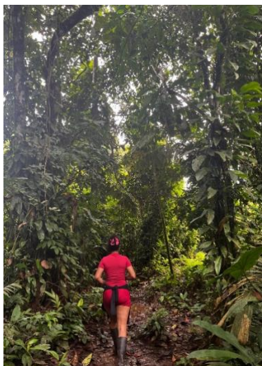
Foto 7. Egreso del sistema de protección y cierre del ciclo formativo

La experiencia aquí sistematizada permite reconocer tensiones entre el enfoque de derechos y las prácticas institucionales, así como la necesidad de fortalecer modelos de acompañamiento más humanos, continuos y sensibles a las trayectorias vitales de quienes transitan por el sistema.