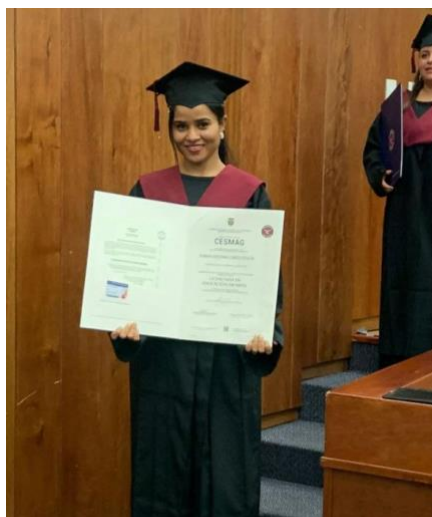
Foto 6. Imagen que evidencia el inicio de un nuevo camino.

Nota. Esta imagen representa el momento en el cual la vida da un giro y contra toda adversidad empiezo a escalar profesionalmente.