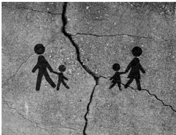
Foto 5. Imagen simbólica de la ruptura y separación.

Ese lugar me marcó para siempre. Me sentía muerta por dentro. Entendí que el sistema que debía protegerme no lo haría, y que debía protegerme sola.