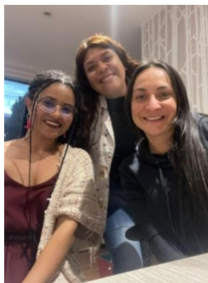
Foto 8. Coordinadora adopciones Casa de La Madre y el Niño

Coordinadora adopciones Casa de La Madre y el Niño