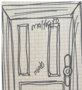
Foto 3. Representación gráfica del encierro