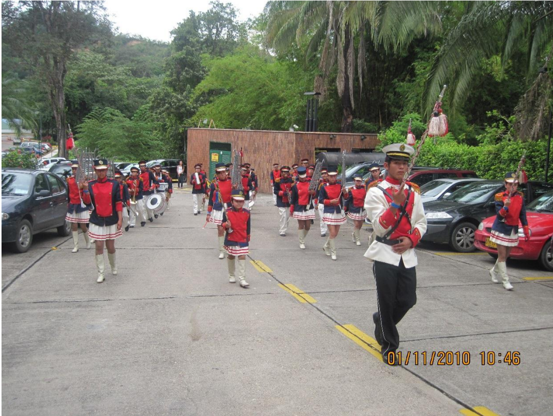
Presentación Banda Marcial I.E.D. Gonzalo Jiménez de Quesada Nov 01 de 2010. Club Cafam Melgar (Tolima)

Aunque durante estos años se realizaron pocas salidas se evidenciaron aspectos importantes como la aceptación total de que los participantes de la agrupación fueran los que quisieran pertenecer a ella. Lo anterior, porque a raíz de la integración de las instituciones, desde la coordinación académica que estaba bajo mi cargo se sostenían algunas “discusiones” con los docentes de la Básica secundaria con respecto a las dinámicas de la Banda y algunos de ellos sostenían que allí debían estar los mejores. Es decir, se quería que la agrupación fuera un espacio con el fin que se creó cuando inició en primaria: Para los “mejores”.