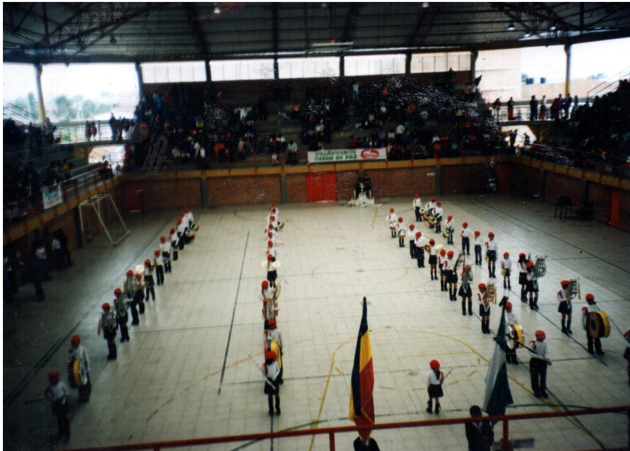
Participación Concurso de Bandas Madrid (Cundinamarca) 1998