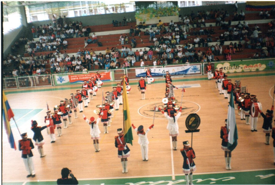
Concurso de bandas Fusagasugá (Cundinamarca) año 2005

Aunque en esta investigación, lo principal no es dar mayor valor a los resultados tangibles en cuanto a los concursos en los cuales se participaba, si es quizá pertinente resaltar que durante los años 2004 al 2009, la agrupación se fortaleció y siempre había un reconocimiento positivo cuando se participaba en concursos durante estos años, lo cual se puede atribuir a varios aspectos como: