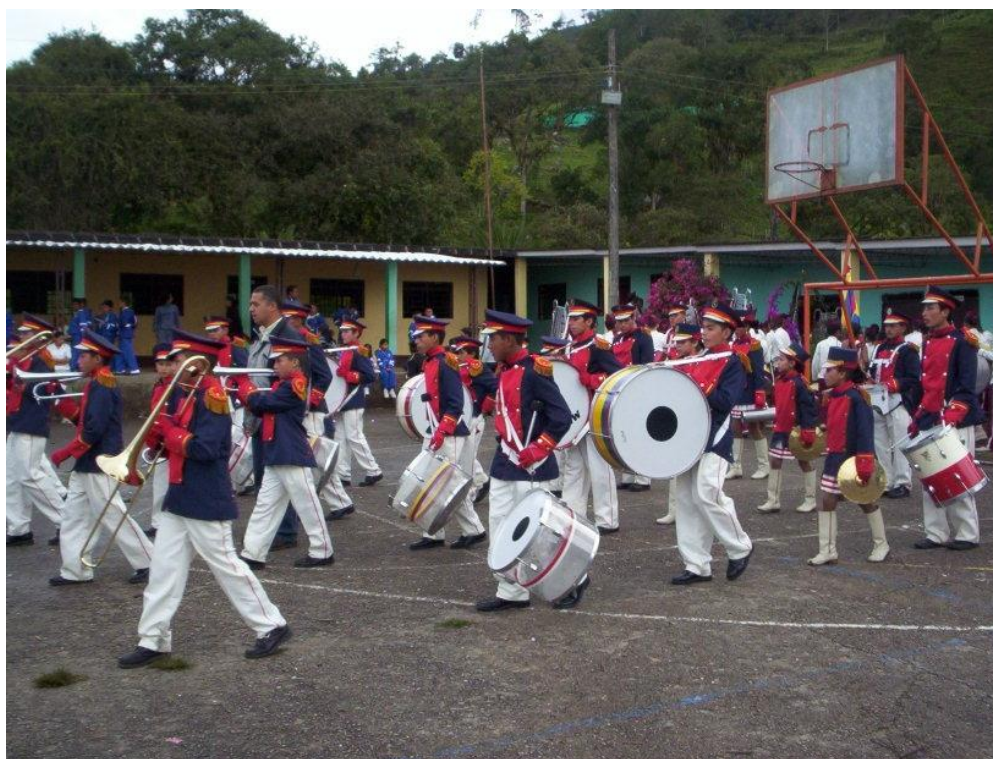
Concurso de Bandas municipio de Zetaquirá (Boyacá) 2007