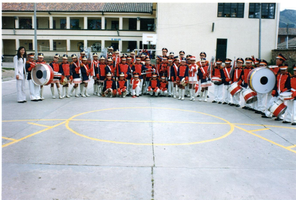
Banda Marcial I.E.D. Gonzalo Jiménez de Quesada año 2005

Se continuó con la gestión y fue así como en noviembre del 2004 se radicó en el Consejo Municipal un proyecto que llevaba por nombre “implementación Banda Marcial”, el cual fue aprobado y se cambió de modalidad Tradicional a tradicional A. Así mismo, se radicó un proyecto ante una empresa del municipio (Cementos Tequendama), con el fin de gestionar uniformes propios para ésta agrupación. Para la fecha sus integrantes oscilaban entre 45 y 50 y sus dinámicas se fortalecieron debido a que por la integración de las instituciones que para nuestro caso fue la resolución N° 4544 del 29 de Diciembre de 2004, se pudo continuar con los estudiantes que terminaron su básica primaria y continuaron en la Básica Secundaria.