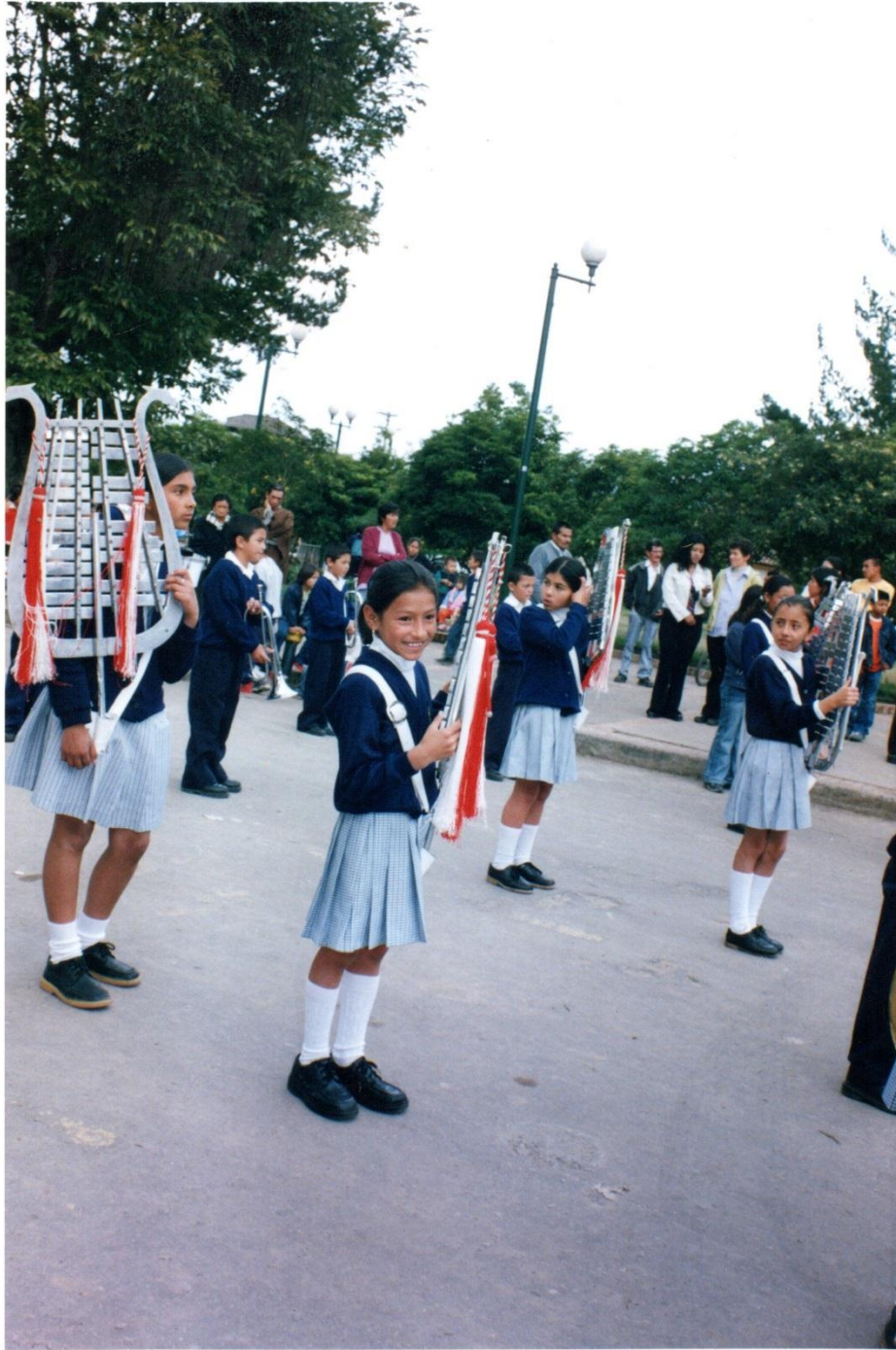
Banda Marcial Escuela General Santander año 2002