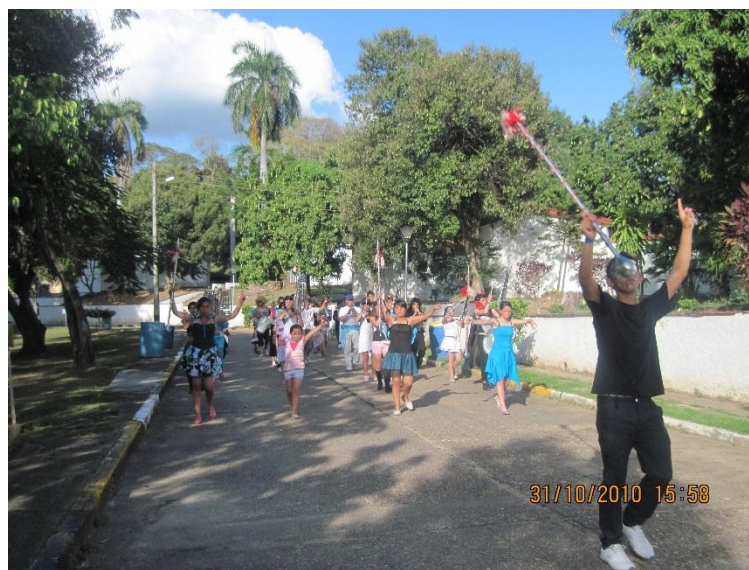
Invitación Club Cafam Melgar (Tolima), tarde de Halloween. 2010