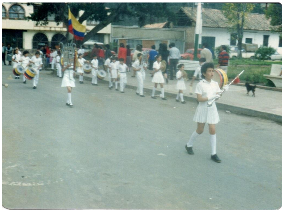
Primer salida Banda Marcial año 1989

Por el relato que hace el presidente de la Asociación de Padres de familia que ejercía para el año 1989, se puede identificar que la Banda Marcial inició en Categoría Infantil y modalidad Tradicional, según los lineamientos de la Fundación Educando Colombia mediante un documento publicado en el año 2004 PROTOCOLO UNICO OFICIAL PARA CONCURSOS DE BANDAS DE MARCHA EN LA REPÚBLICA DE COLOMBIA, cuyo contenido se esbozó en un apartado anterior; con respecto a los integrantes, debían ser quienes tuvieran excelente rendimiento académico, excelente disciplina, es decir, era un espacio al que podían pertenecer “los mejores”.